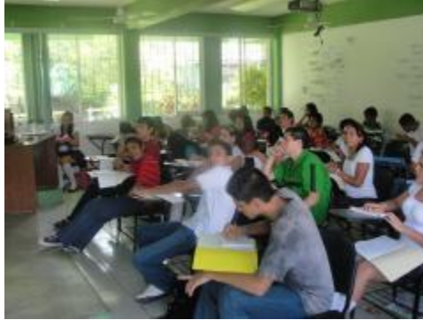
Curso de inducción a la Universidad de Colima