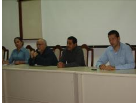
Visita del Rector al bachillerato