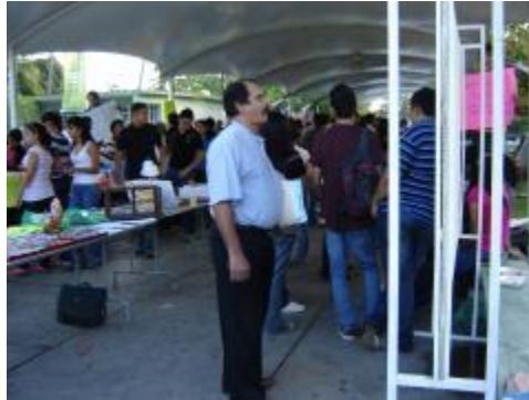
Exposición área ciencias sociales