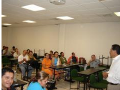
Cursos al personal docentes y administrativo