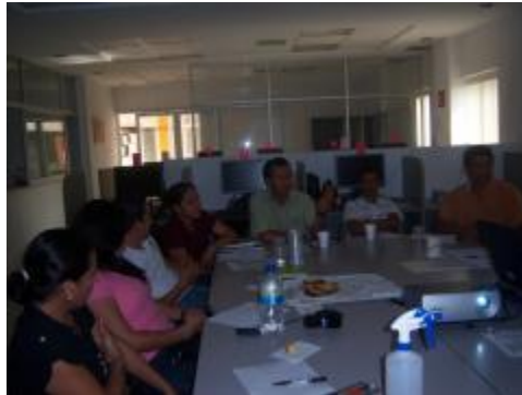
Reuniones de trabajo