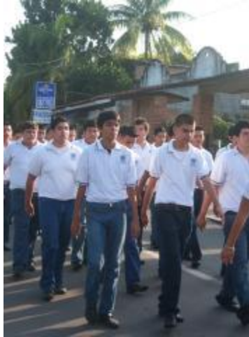
Desfile "16 de septiembre"