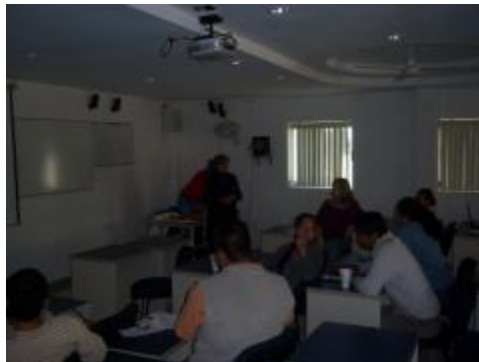
Comunidades de aprendizaje