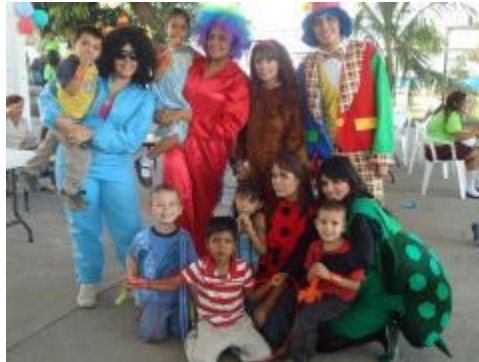
Voluntariado "Casa hogar amor y protección al niño"