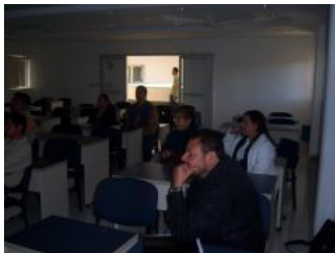
Comunidades de aprendizaje