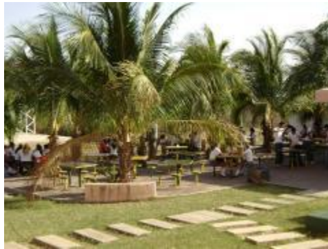
Área de cafetería