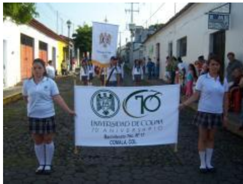
Desfile "16 de septiembre"