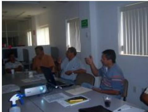
Reuniones de trabajo