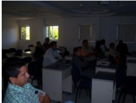
Comunidades de aprendizaje