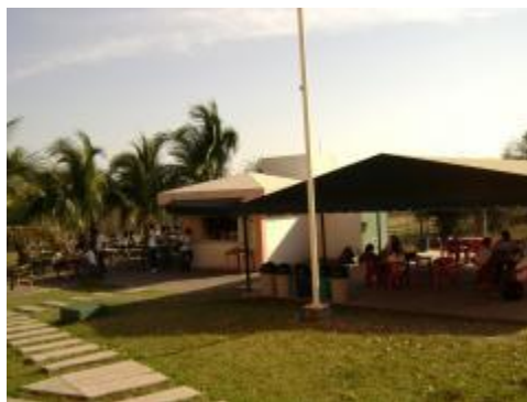
Área de cafetería