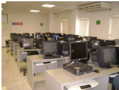
Centro de cómputo