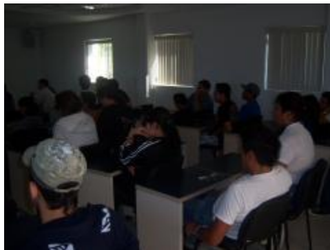
Campaña de "Descacharrización"