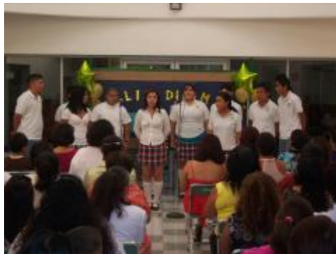
Festejo "Día de las madres"