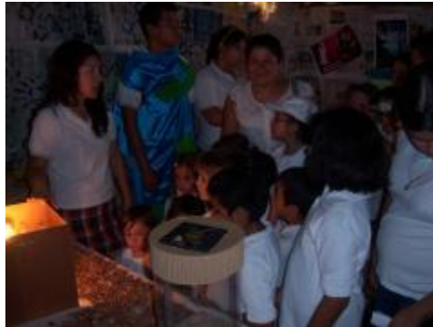
Exposición de trabajos "El impacto Negativo de la Contaminación Ambiental"