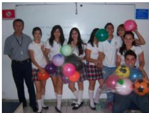
Voluntariado "Casa hogar amor y protección al niño"