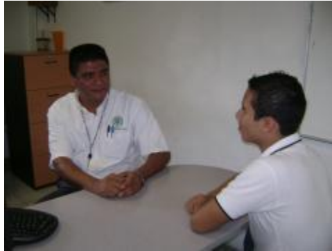
Programa de tutorías