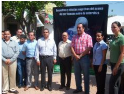
Exposición de trabajos "El impacto Negativo de la Contaminación Ambiental"