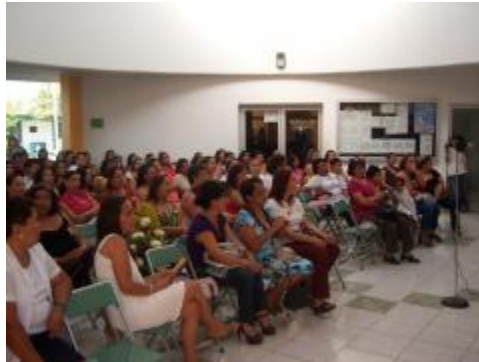
Festejo "Día de las madres"