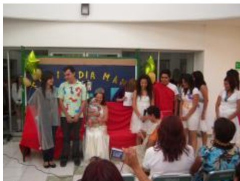
Festejo "Día de las madres"