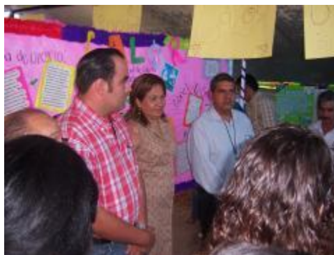
Exposición de trabajos "El impacto Negativo de la Contaminación Ambiental"