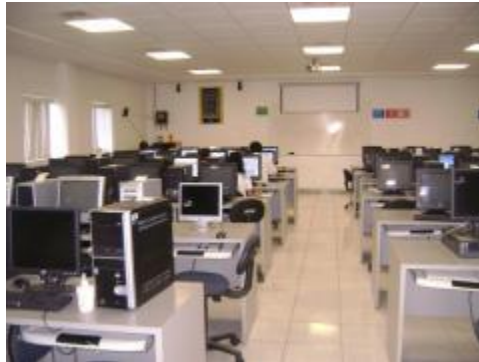
Centro de cómputo