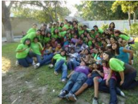
Campaña de "Descacharrización"