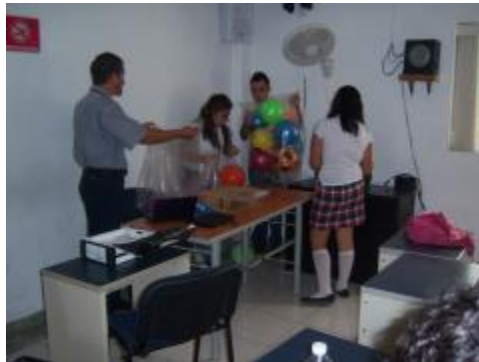
Voluntariado "Casa hogar amor y protección al niño"