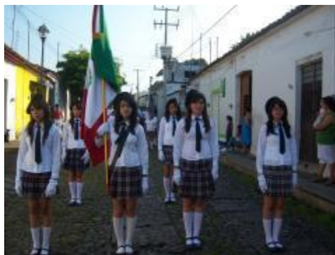
Desfile "16 de septiembre"