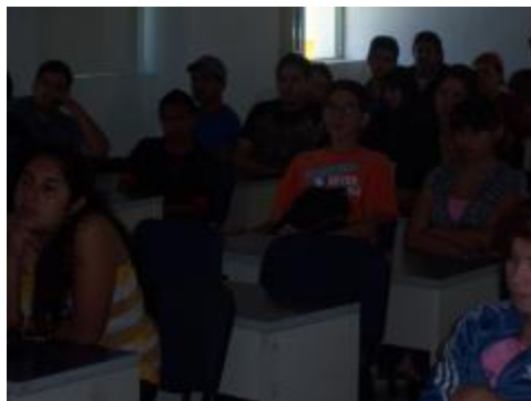
Campaña de "Descacharrización"