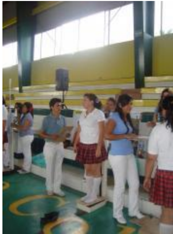
Examen Médico Automatizado en el Polideportivo de Colima.