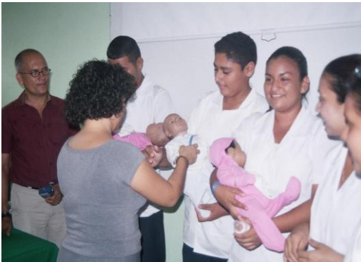
Estrategias de apoyo psicológico a estudiantes