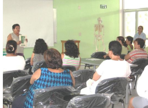
Descripción de reglamentos a padres de familia