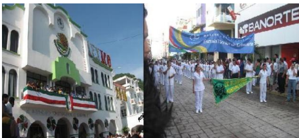
Conmemorativo al Bicentenario de la Independencia de México