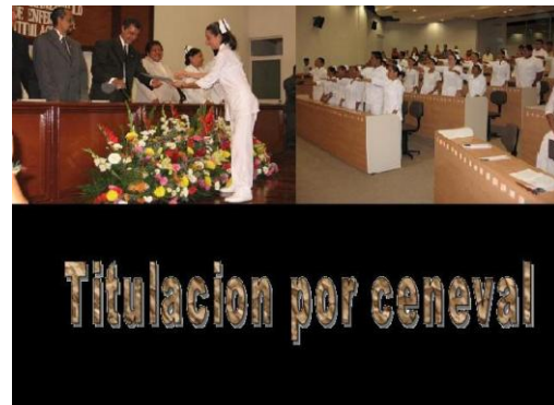
Acto protocolario de titulación