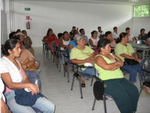
Reunión de padres de familia