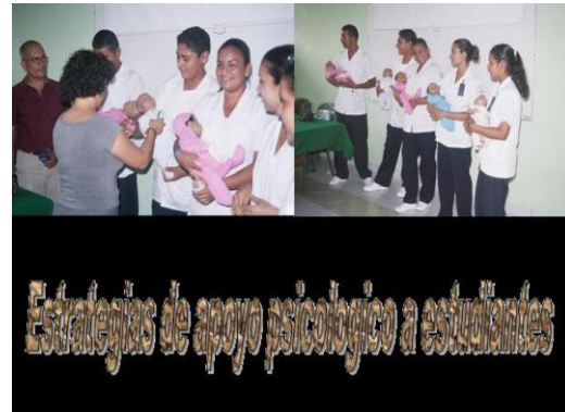
Estrategias de apoyo psicológico a estudiantes