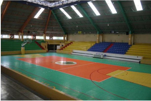
Polideportivo de Villa de Alvarez