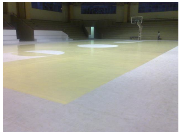
Cancha de Futbol Rápido (Tecoman)