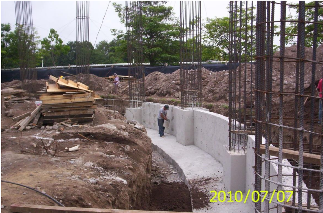
Primera Etapa de Construcción de Edificio Administrativo – Financiero