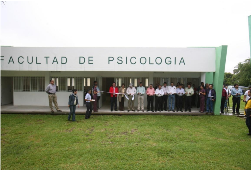
Inauguración Aulas.- Facultad de Psicología