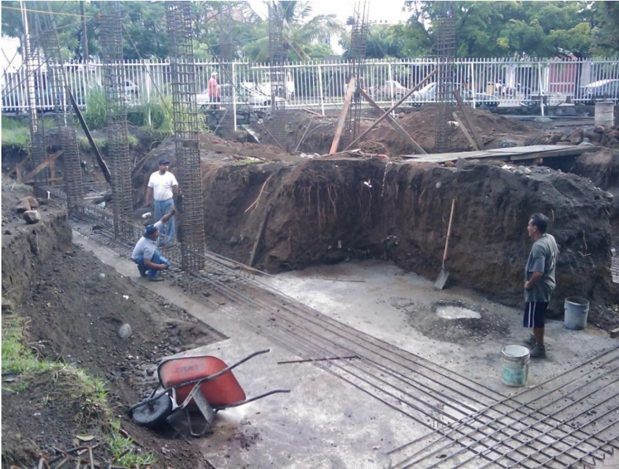
Construcción de Cubículos para P.T.C.- Facultad de Pedagogía