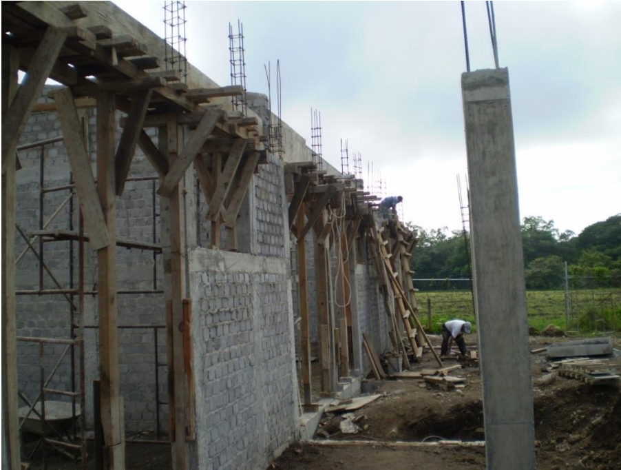
Primera etapa de edificio de Aulas-Taller para Artes Visuales.- I.U.B.A.