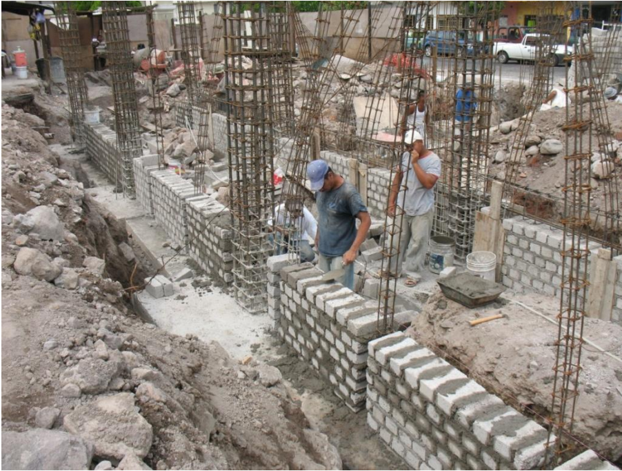
Construcción de aulas y Cubículos de P.T.C.- Departamento de Danza I.U.B.A.