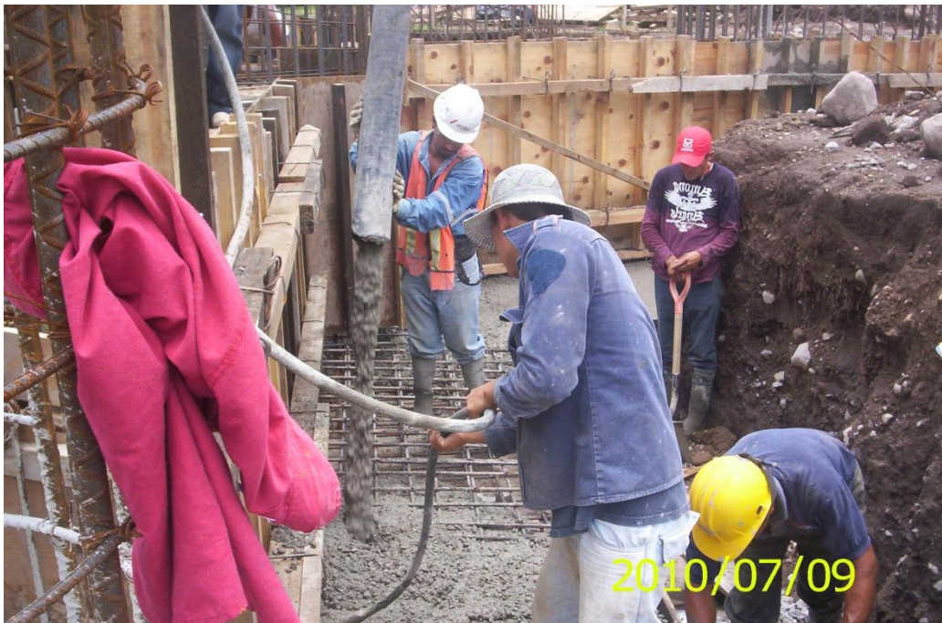
Primera Etapa de Construcción de Edificio Administrativo - Financiero