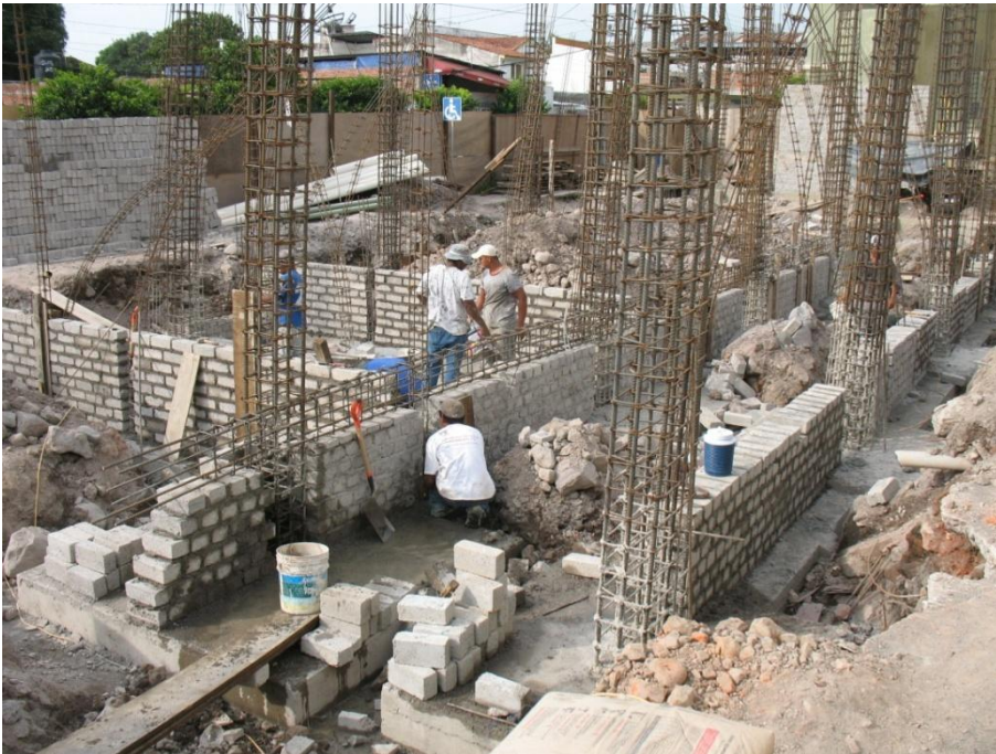
Construcción de aulas y Cubículos de P.T.C.- Departamento de Danza I.U.B.A.