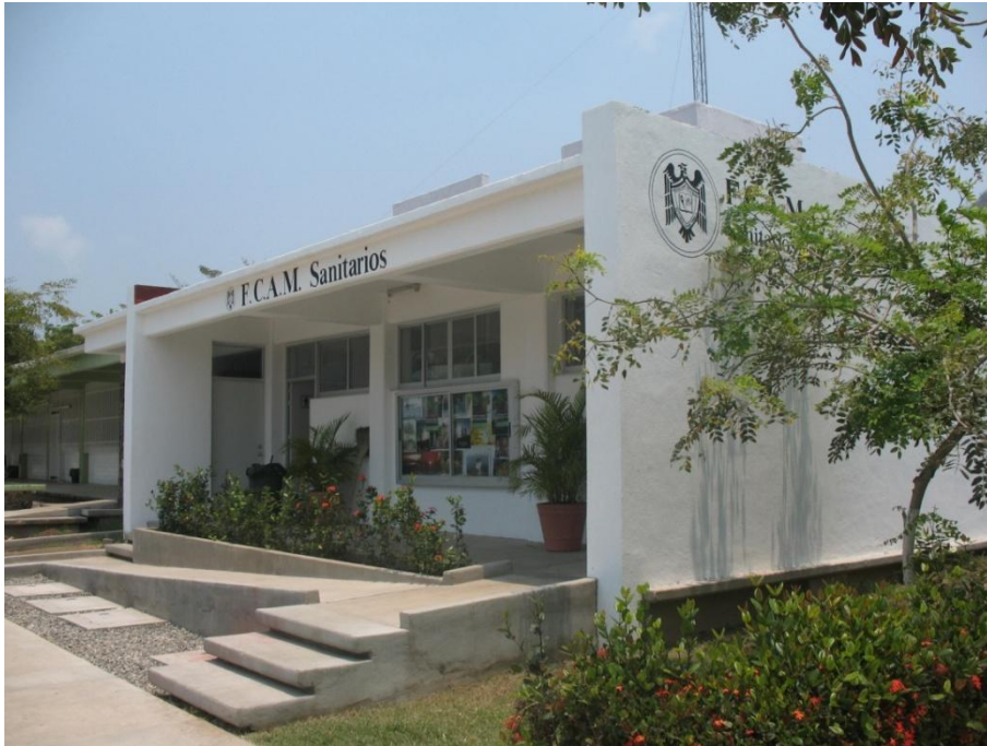
Módulo de Baños.- Facultad de Contabilidad y Administración