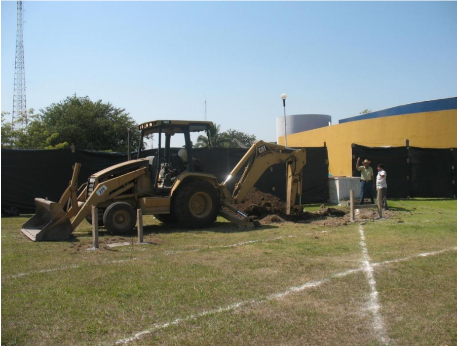
Primera Etapa de Construcción de Edificio Administrativo – Financiero