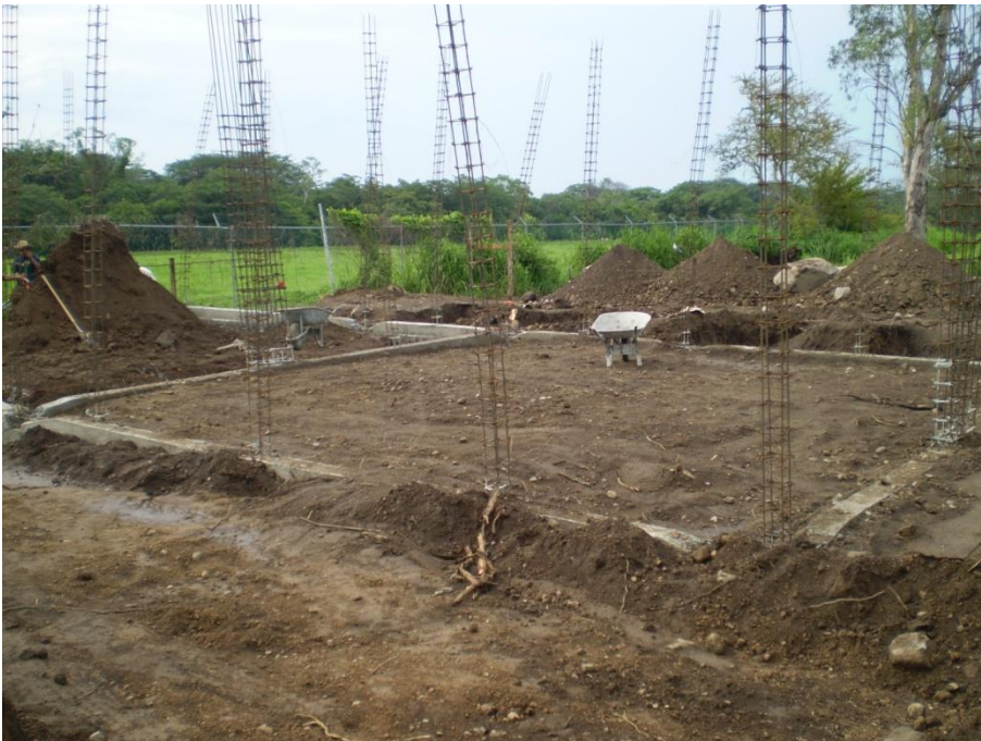
Primera etapa de edificio de Aulas-Taller para Artes Visuales.- I.U.B.A.