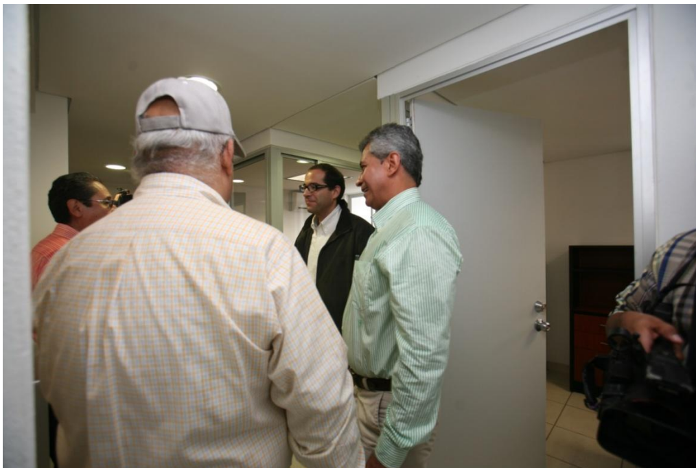
Cubículos para P.T.C.- Facultad de Ciencias de la Educación