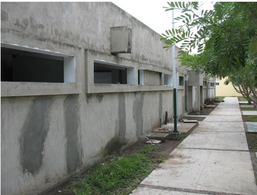
Adecuación del Laboratorio de Fertilidad de Suelos.- Facultad de Ciencias Biológicas y Agropecuarias