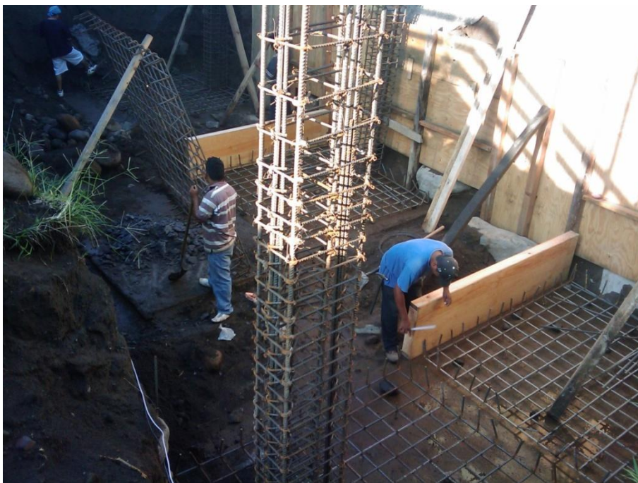
Construcción de Edificio para Aula-Taller.- Facultad de Lenguas Extranjeras