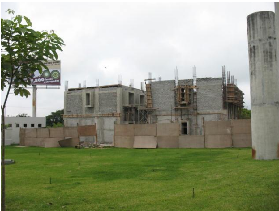
Construcción de Cubículos para P.T.C.- Facultad de Derecho