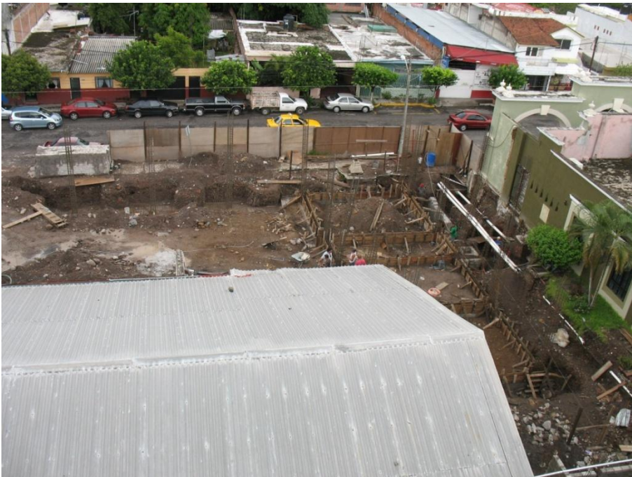
Construcción de aulas y Cubículos de P.T.C.- Departamento de Danza I.U.B.A.