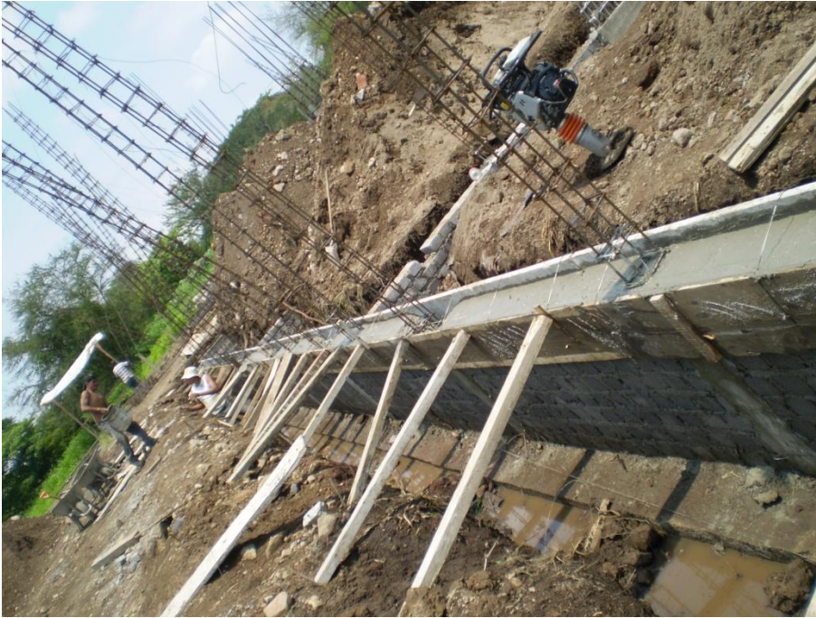
Primera etapa de edificio de Aulas-Taller para Artes Visuales.- I.U.B.A.