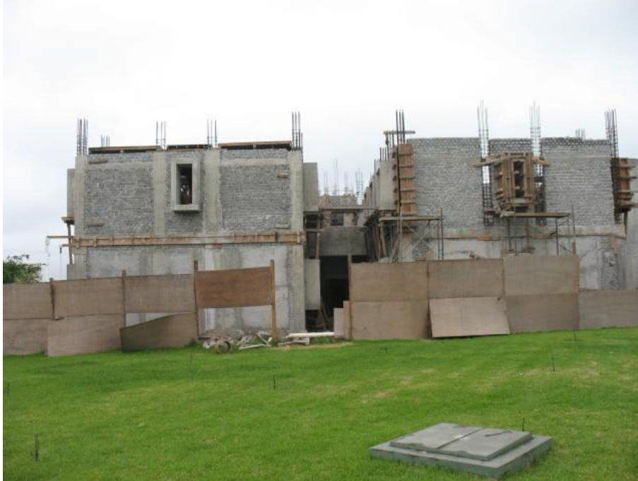
Construcción de Cubículos para P.T.C.- Facultad de Derecho