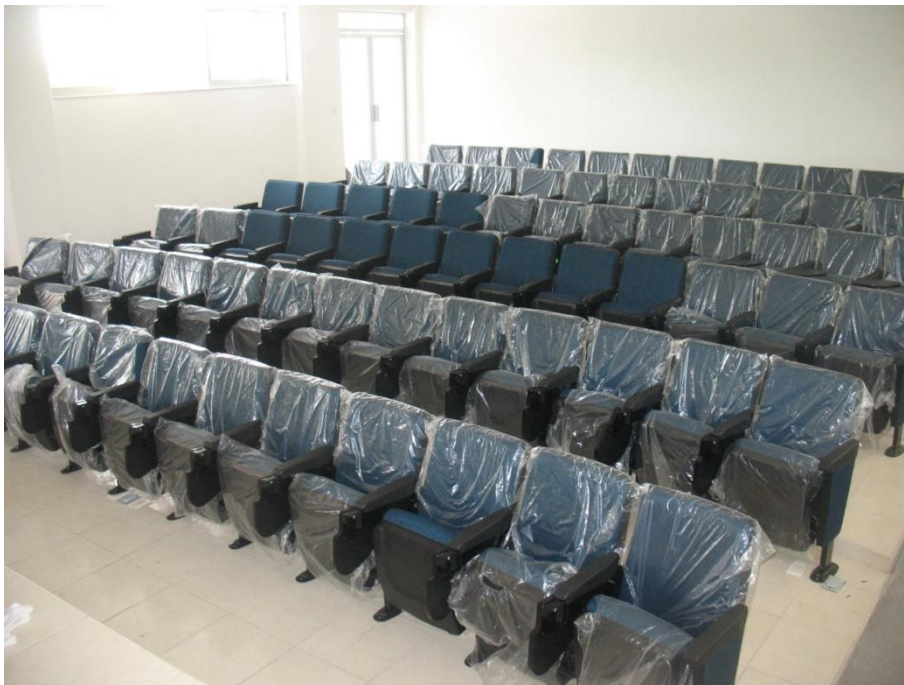
Aula tipo Auditorio.- Centro Universitario de Investigación Biomédica