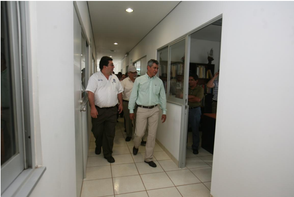
Construcción de Cubículos para P.T.C.- Facultad de Ingeniería Mecánica y Eléctrica