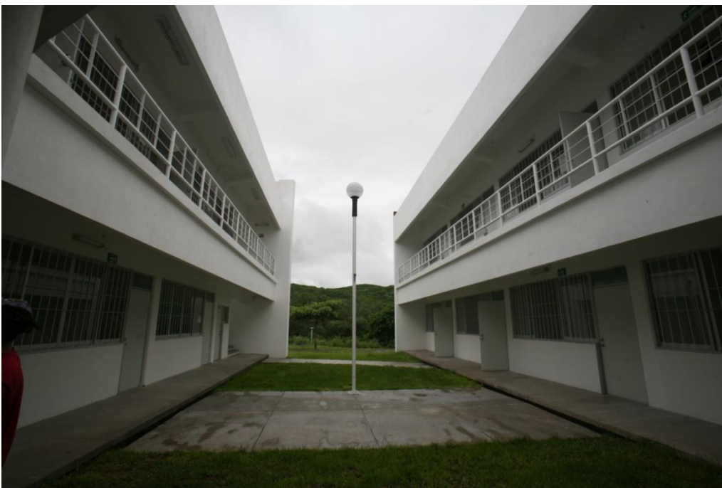
Construcción de 16 Aulas.- Facultad de Ingeniería Mecánica y Eléctrica