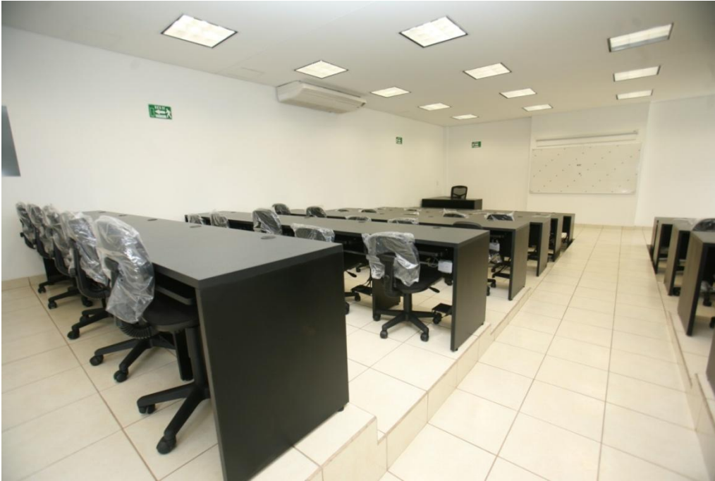
Centro de Computo.- Facultad de Ciencias de la Educación