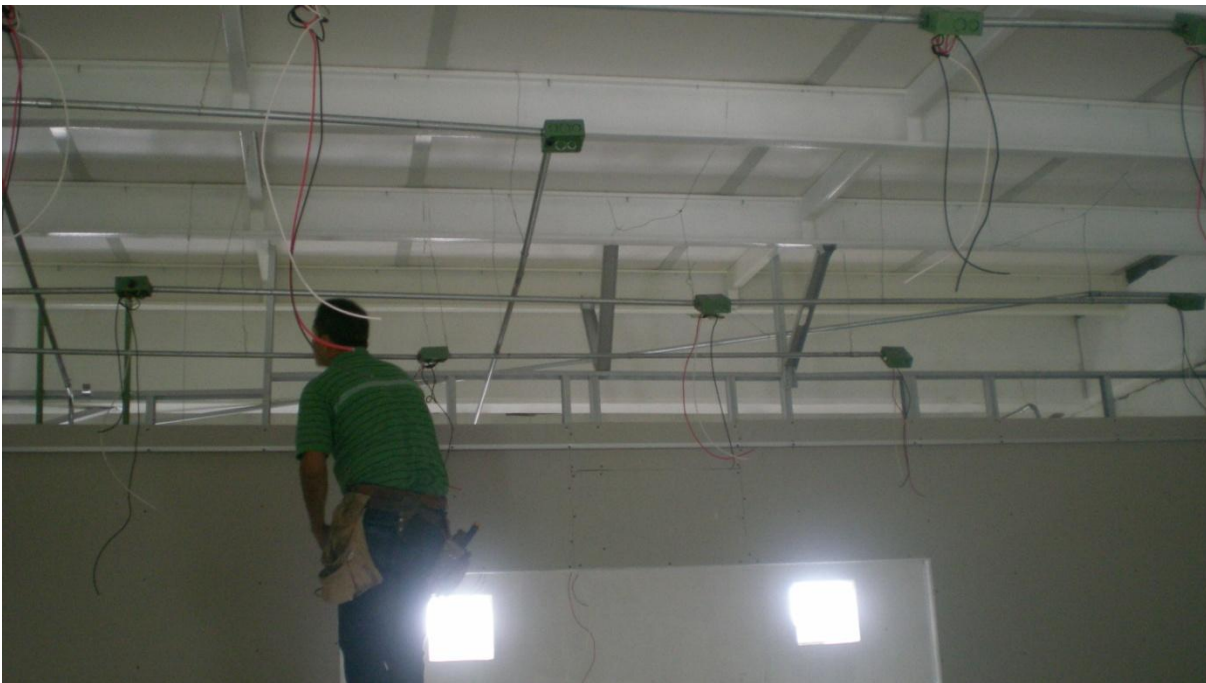
Construcción de Aula Tipo Gessel.- Facultad de Mercadotecnia