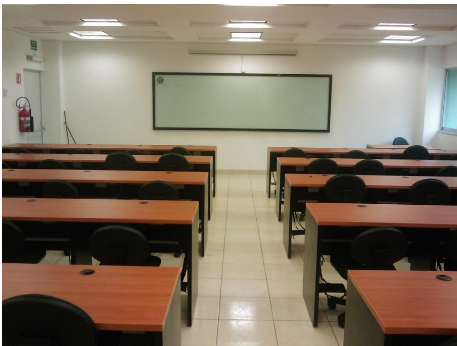
Construcción de edificio para Centro de Computo + Cubículos para P.T.C.-Facultad de Economía