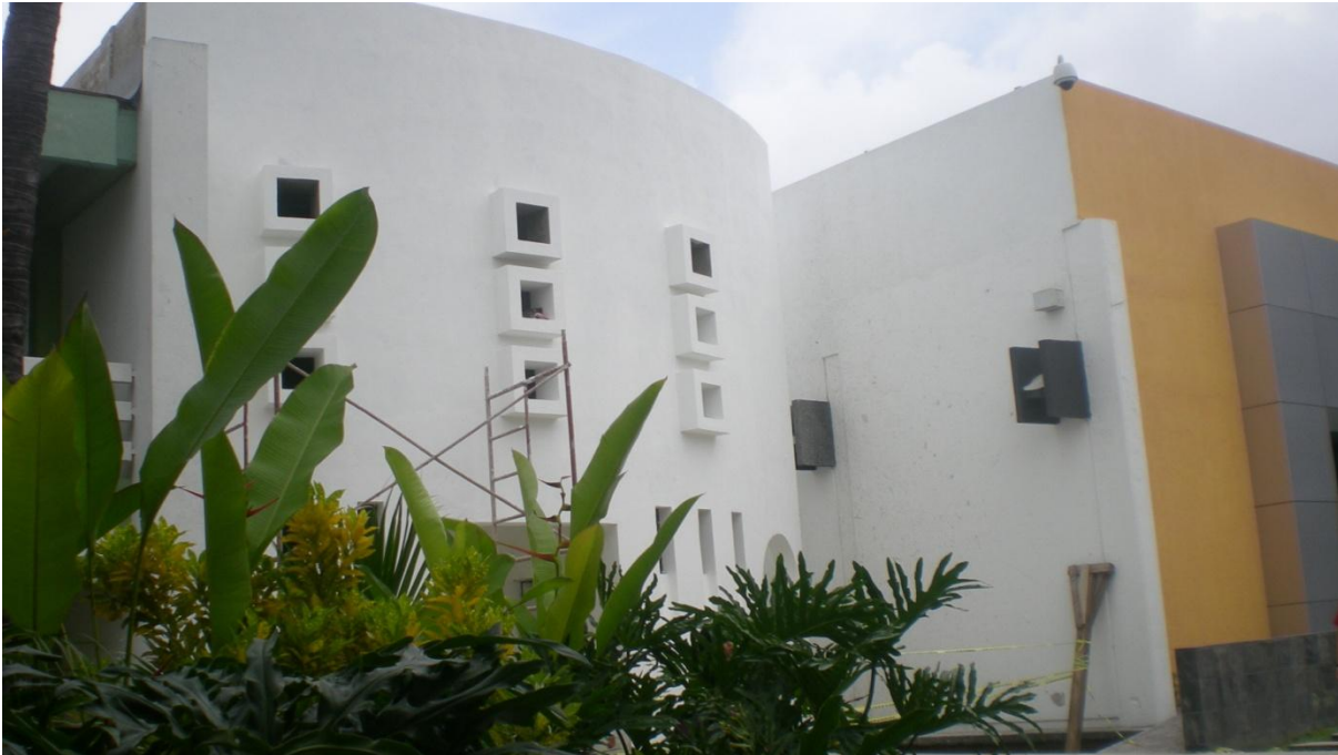
Construcción de Aula Tipo Gessel.- Facultad de Mercadotecnia