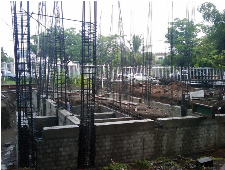
Construcción de Cubículos para P.T.C.- Facultad de Pedagogía