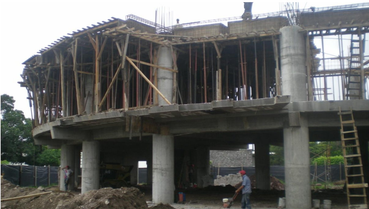
Primera Etapa de Construcción de Edificio Administrativo - Financiero