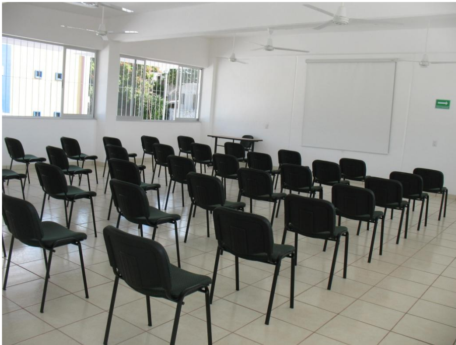
Construcción de 5 Aulas para la Lic. en Nutrición.- Facultad de Medicina