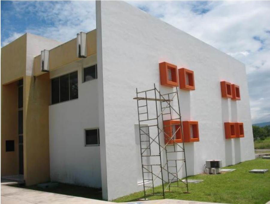
Pintura para el Laboratorio de Mecánica de Suelos.- Facultad de Ingeniería Civil