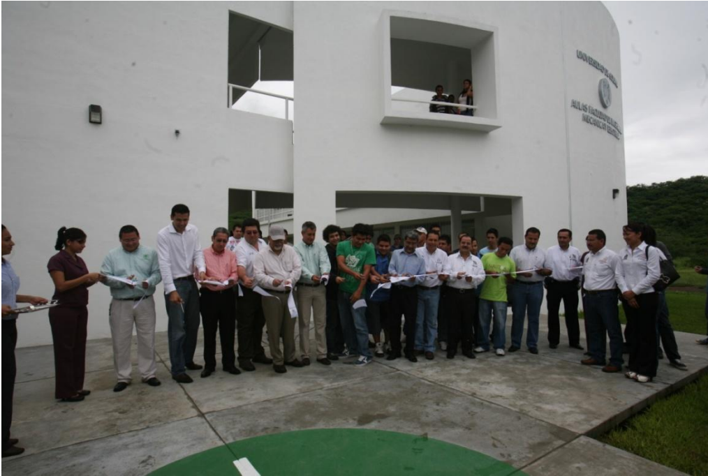
Construcción de 16 Aulas.- Facultad de Ingeniería Mecánica y Eléctrica