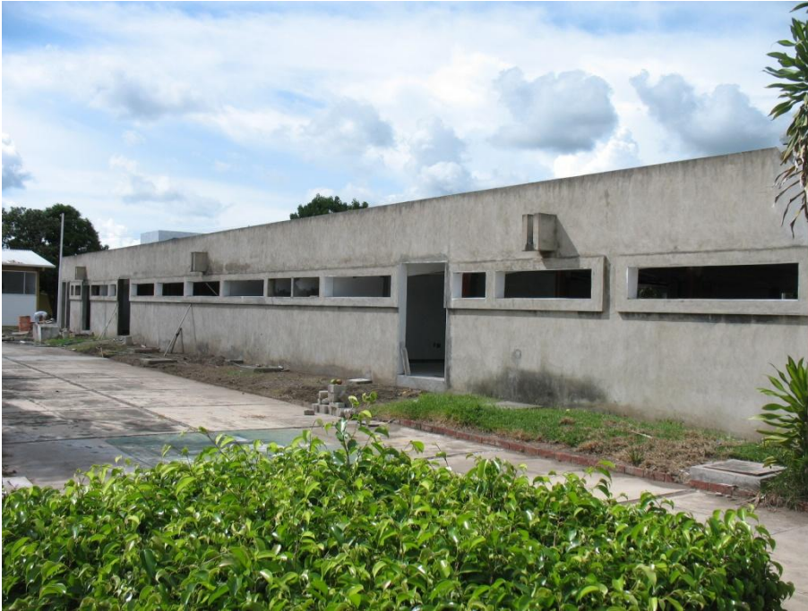
Adecuación del Laboratorio de Fertilidad de Suelos.- Facultad de Ciencias Biológicas y Agropecuarias