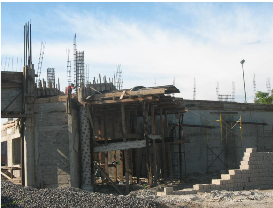
Primera etapa de Talleres de Gastronomía y Gestión Turística