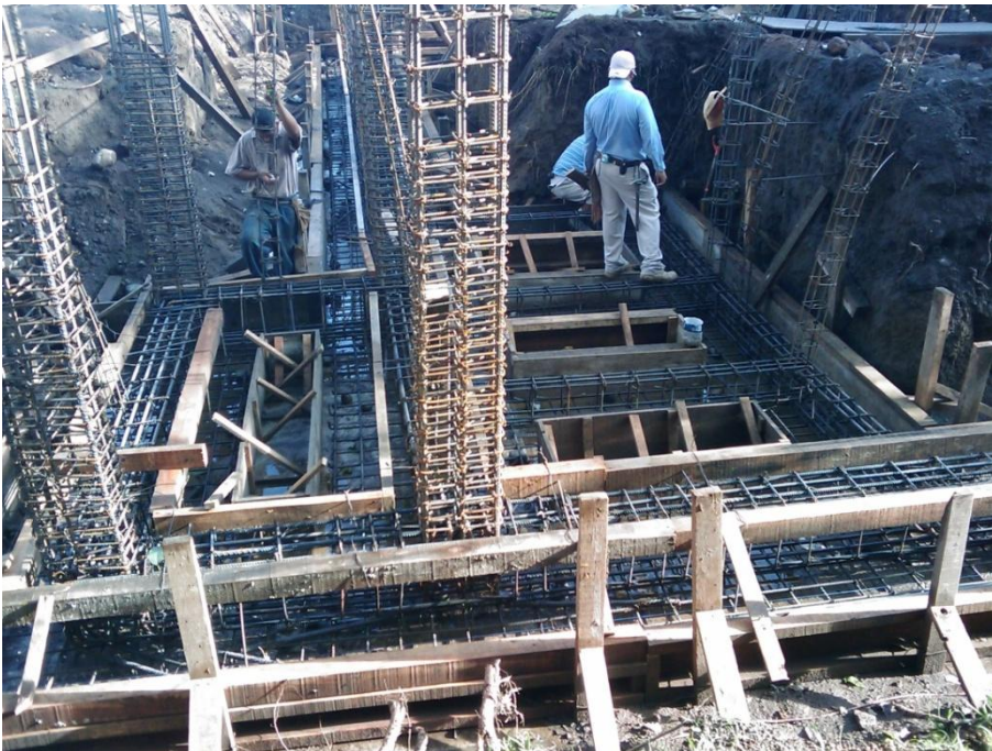
Construcción de Cubículos para P.T.C.- Facultad de Pedagogía