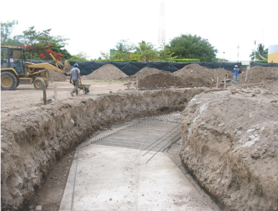
Primera Etapa de Construcción de Edificio Administrativo - Financiero