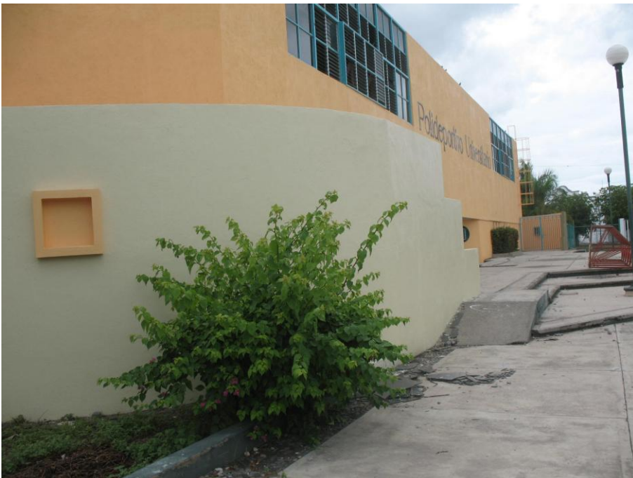
Mantenimiento de Pintura.- Polideportivo de Tecomán