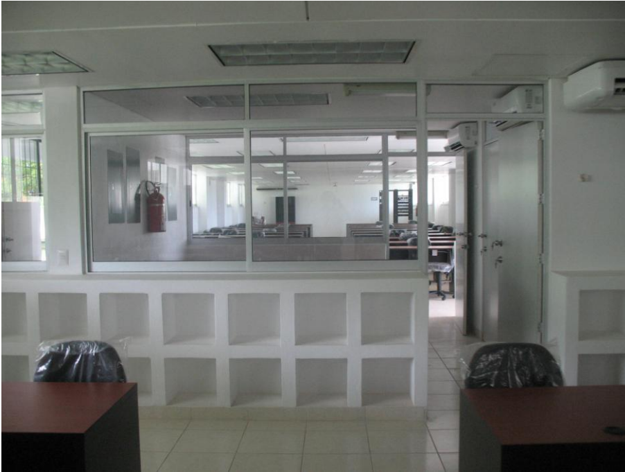
Centro de Cómputo y Taller de Informática.- Facultad de Contabilidad y Administración