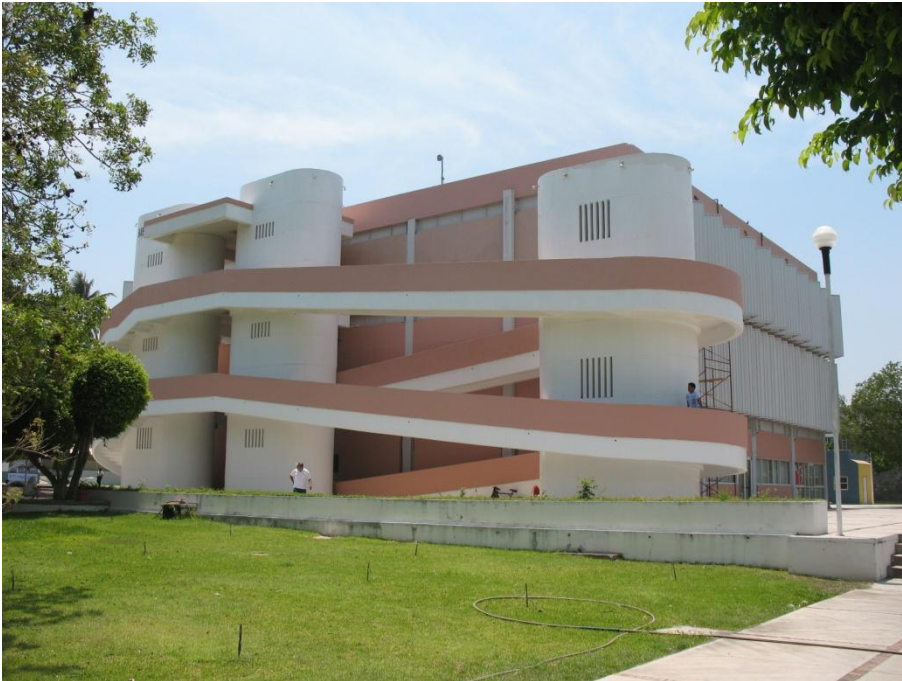
Pintura en el edificio de la Delegación 4