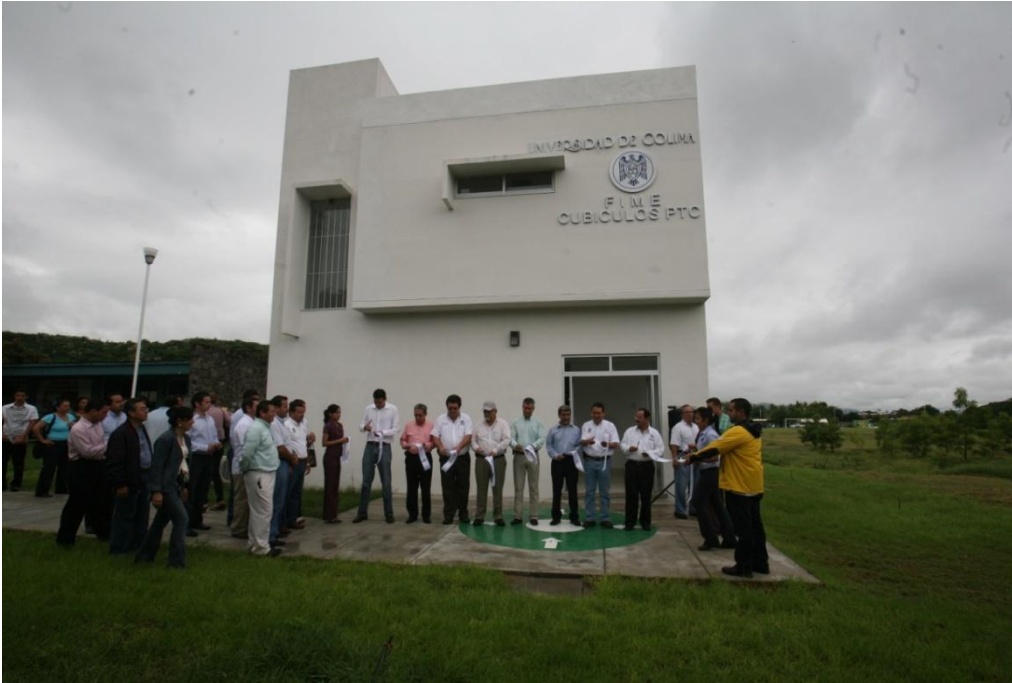
Construcción de Cubículos para P.T.C.- Facultad de Ingeniería Mecánica y Eléctrica