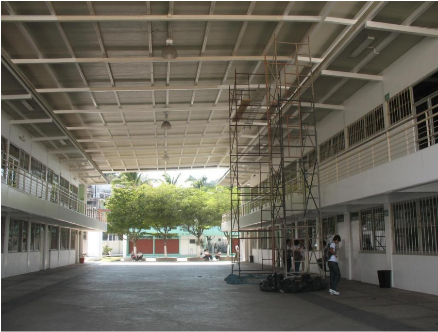
Mantenimiento de Pintura en el Campus San Pedrito