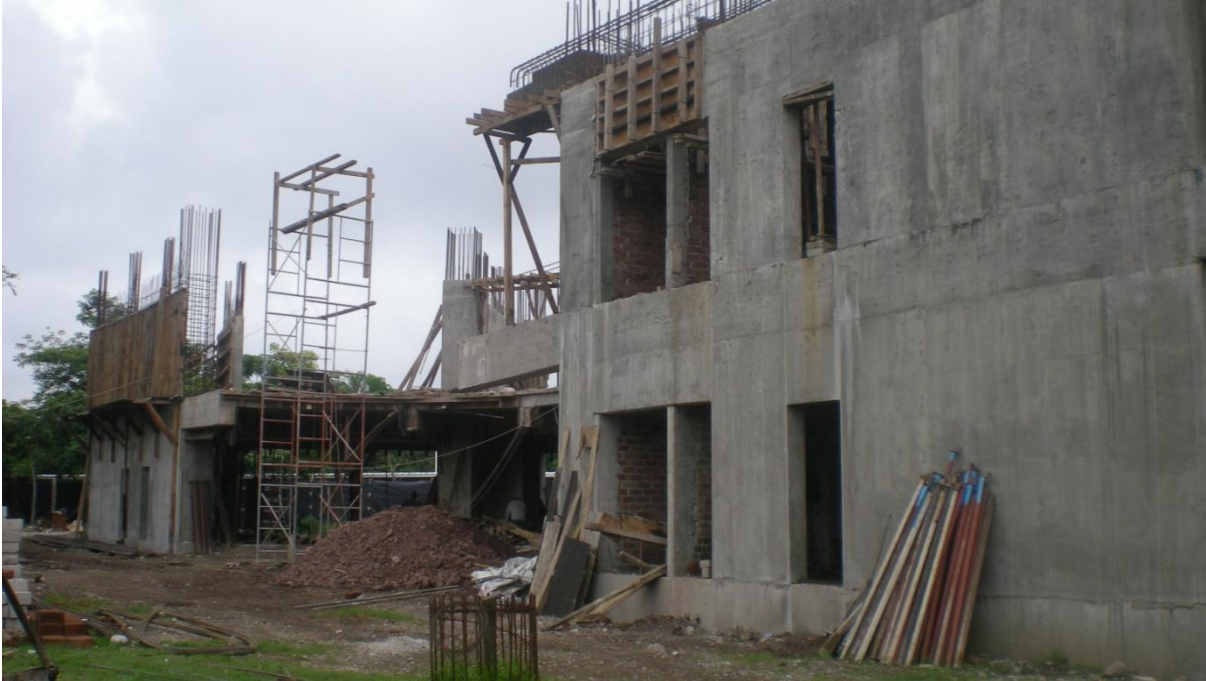
Primera Etapa de Construcción de Edificio Administrativo - Financiero