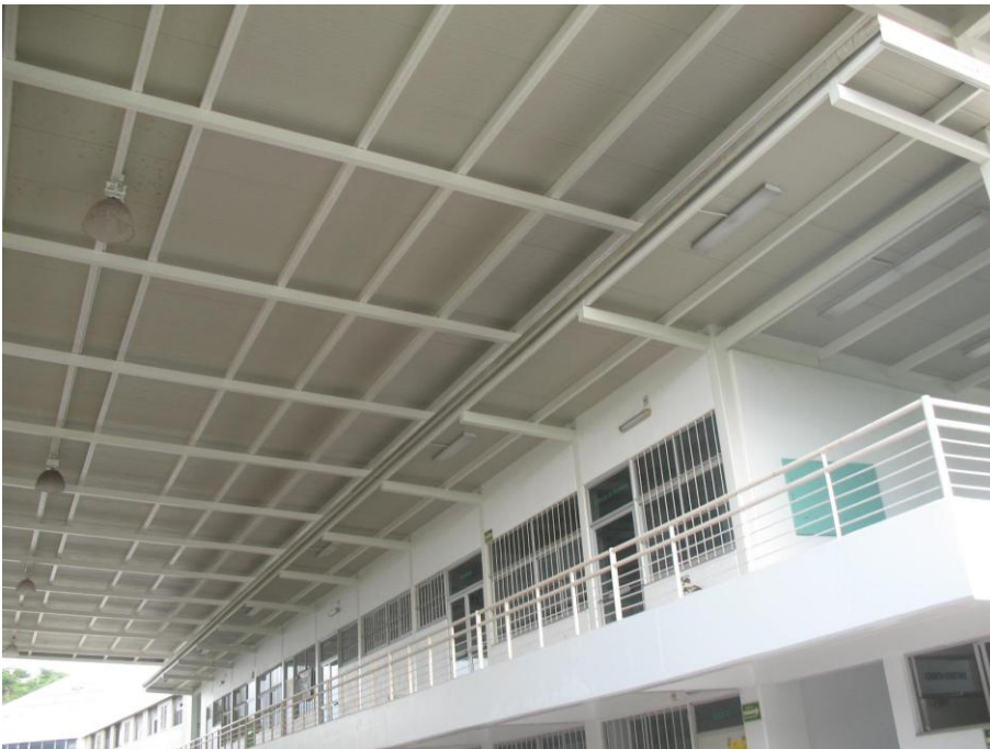
Mantenimiento de Pintura en el Campus San Pedrito