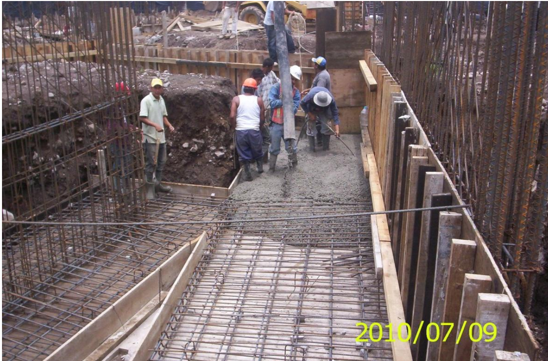
Primera Etapa de Construcción de Edificio Administrativo – Financiero