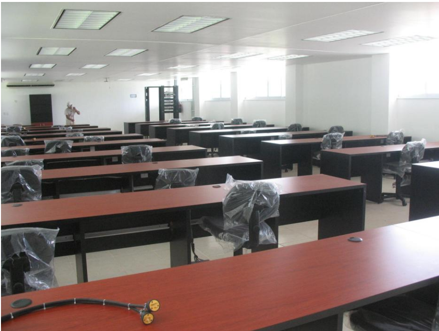
Centro de Cómputo y Taller de Informática.- Facultad de Contabilidad y Administración