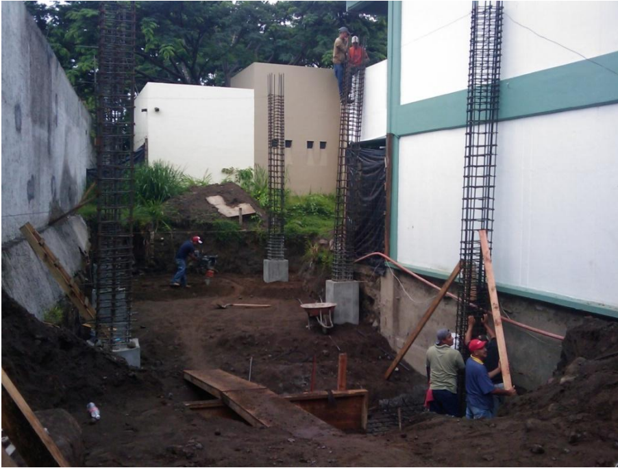
Construcción de Edificio para Aula-Taller.- Facultad de Lenguas Extranjeras