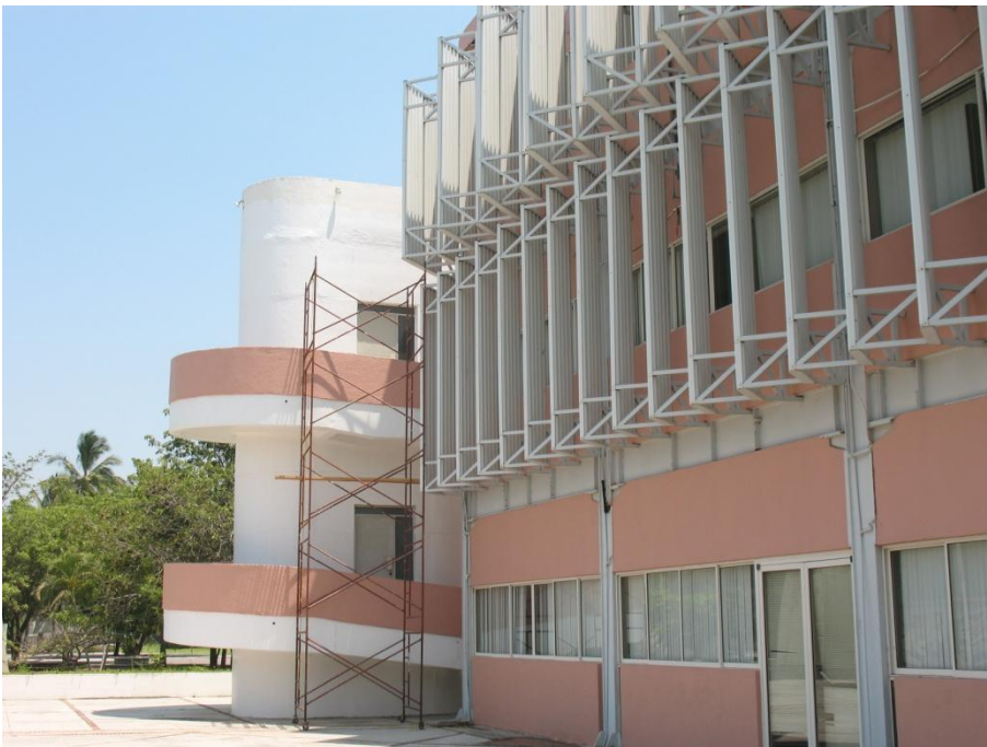
Pintura en el edificio de la Delegación 4