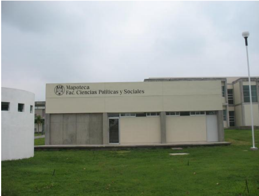
Construcción de Aula-Mapoteca.- Facultad de Ciencias Políticas y Sociales