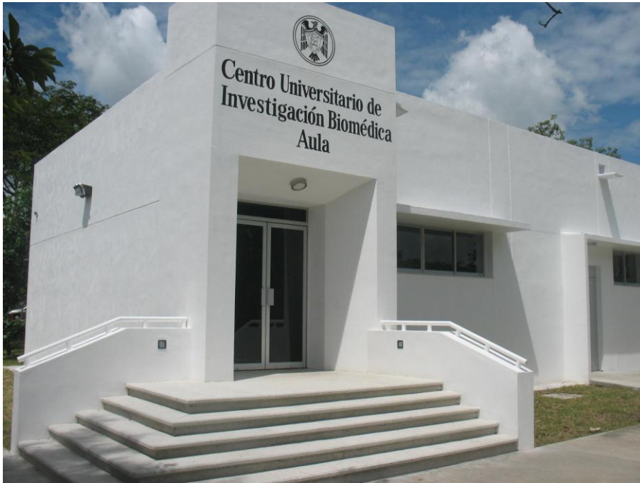
Aula tipo Auditorio.- Centro Universitario de Investigación Biomédica