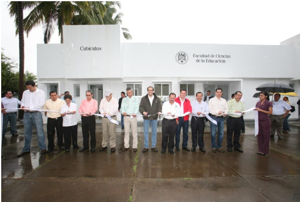
Cubículos para P.T.C.- Facultad de Ciencias de la Educación