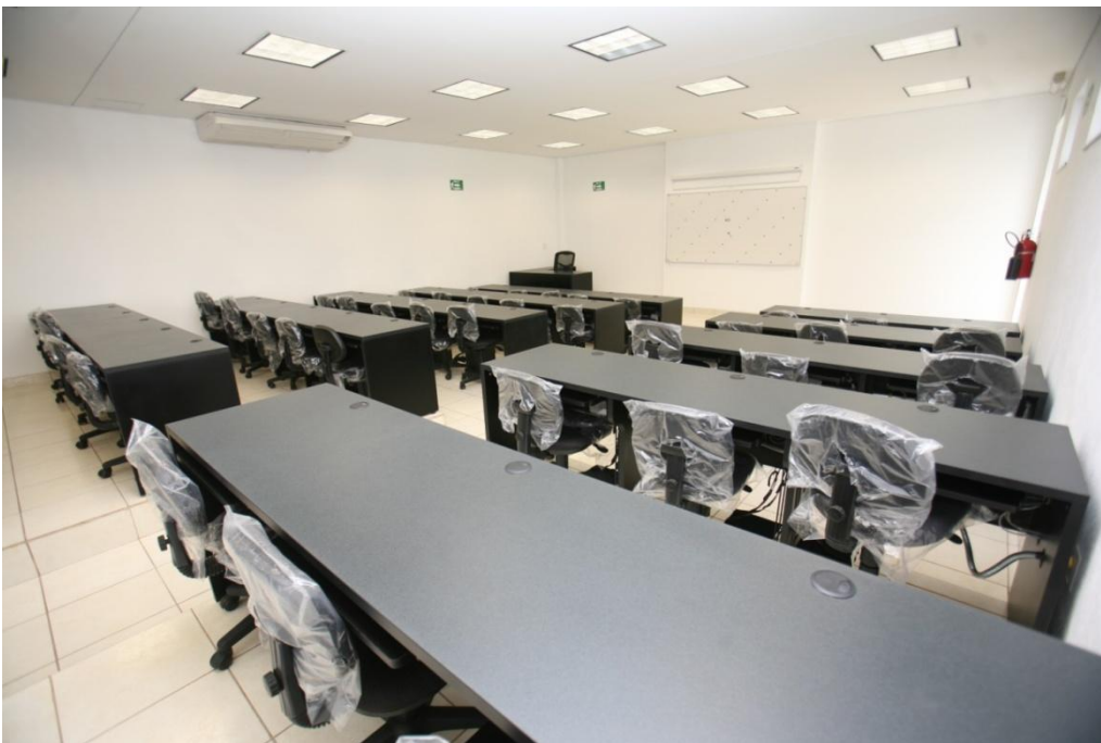
Centro de Computo.- Facultad de Ciencias de la Educación