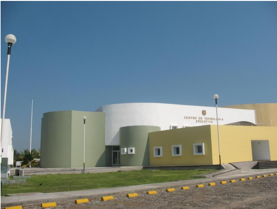
Mantenimiento de Pintura.- Centro de Tecnología Educativa