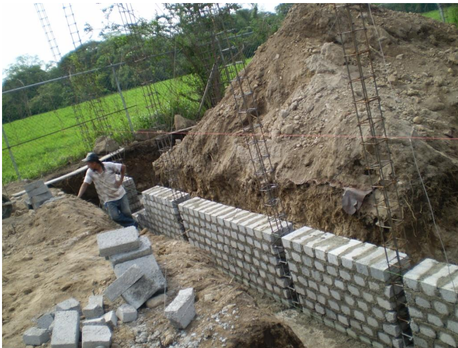
Primera etapa de edificio de Aulas-Taller para Artes Visuales.- I.U.B.A.