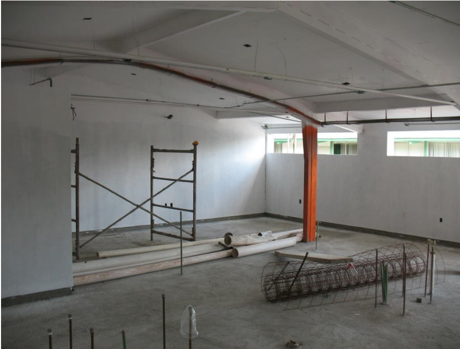
Adecuación del Laboratorio de Fertilidad de Suelos.- Facultad de Ciencias Biológicas y Agropecuarias