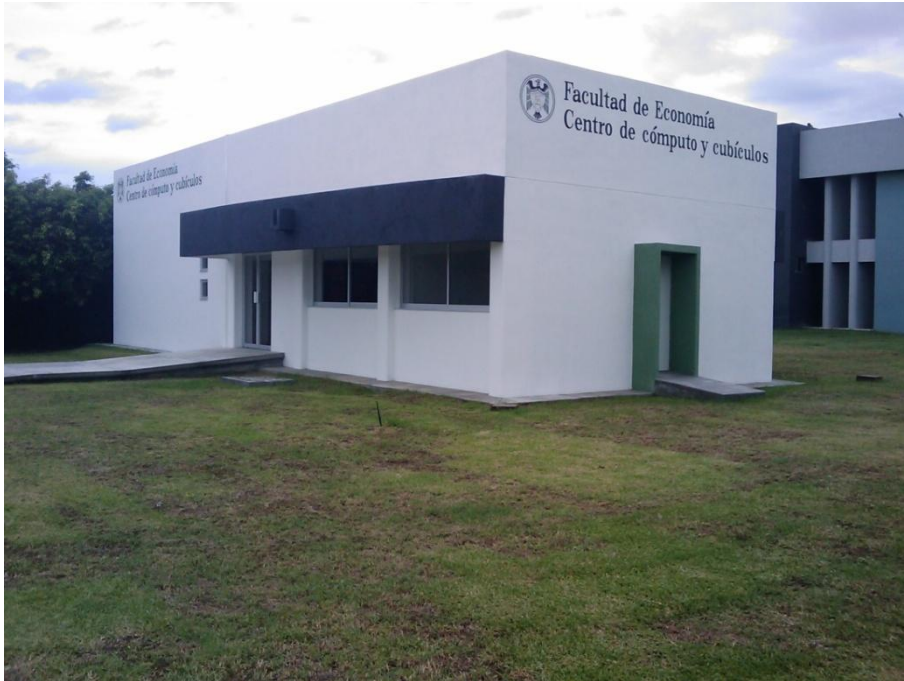
Construcción de edificio para Centro de Computo + Cubículos para P.T.C.-Facultad de Economía