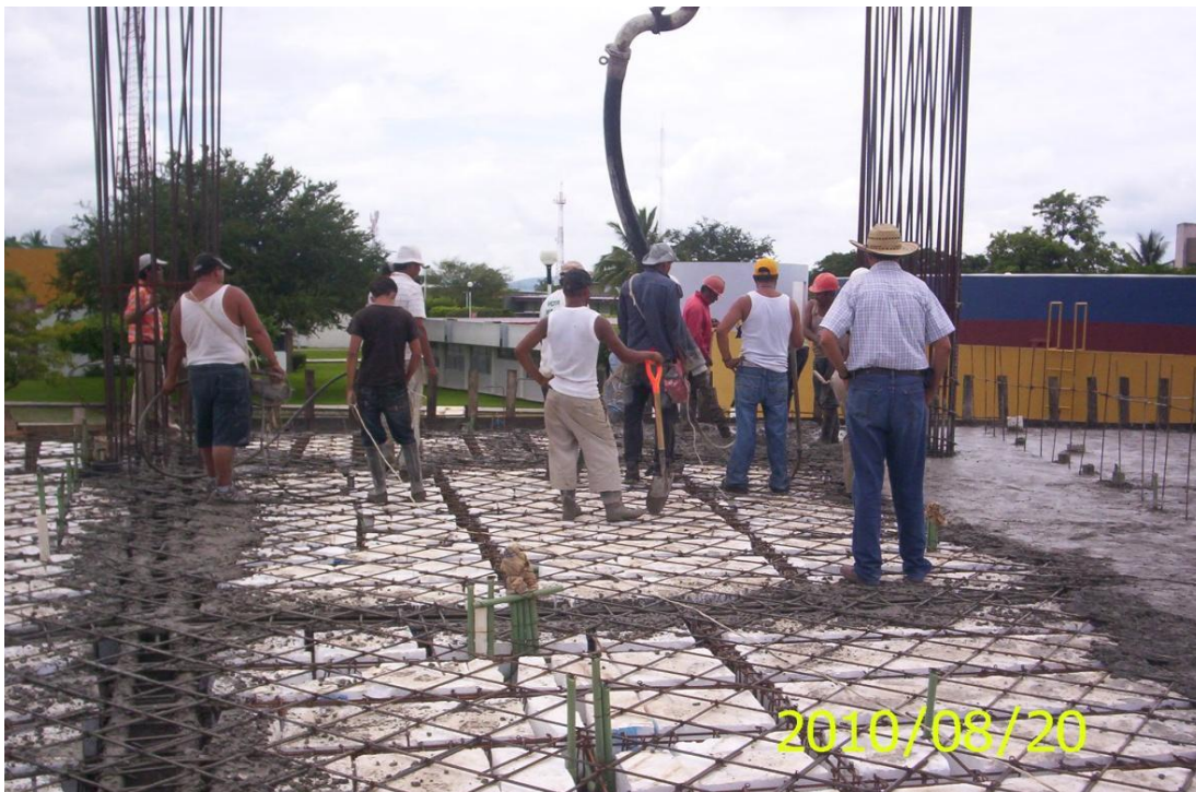
Primera Etapa de Construcción de Edificio Administrativo - Financiero