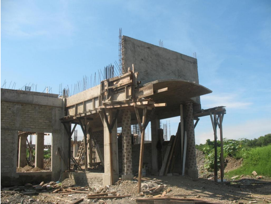
Primera etapa de Talleres de Gastronomía y Gestión Turística