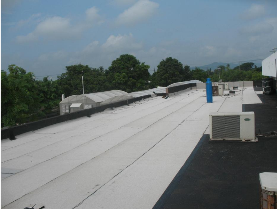
Mantenimiento de Impermeabilizante.- Laboratorio de Biotecnología