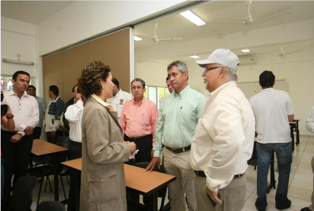
Construcción de Aulas.- Facultad de Psicología