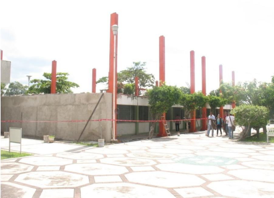
Ampliación a Segundo Nivel edificio de 4 Aulas.- Facultad de Medicina