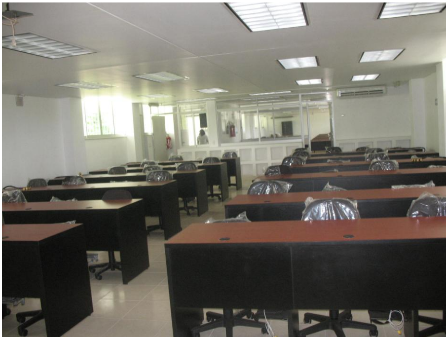
Centro de Cómputo y Taller de Informática.- Facultad de Contabilidad y Administración