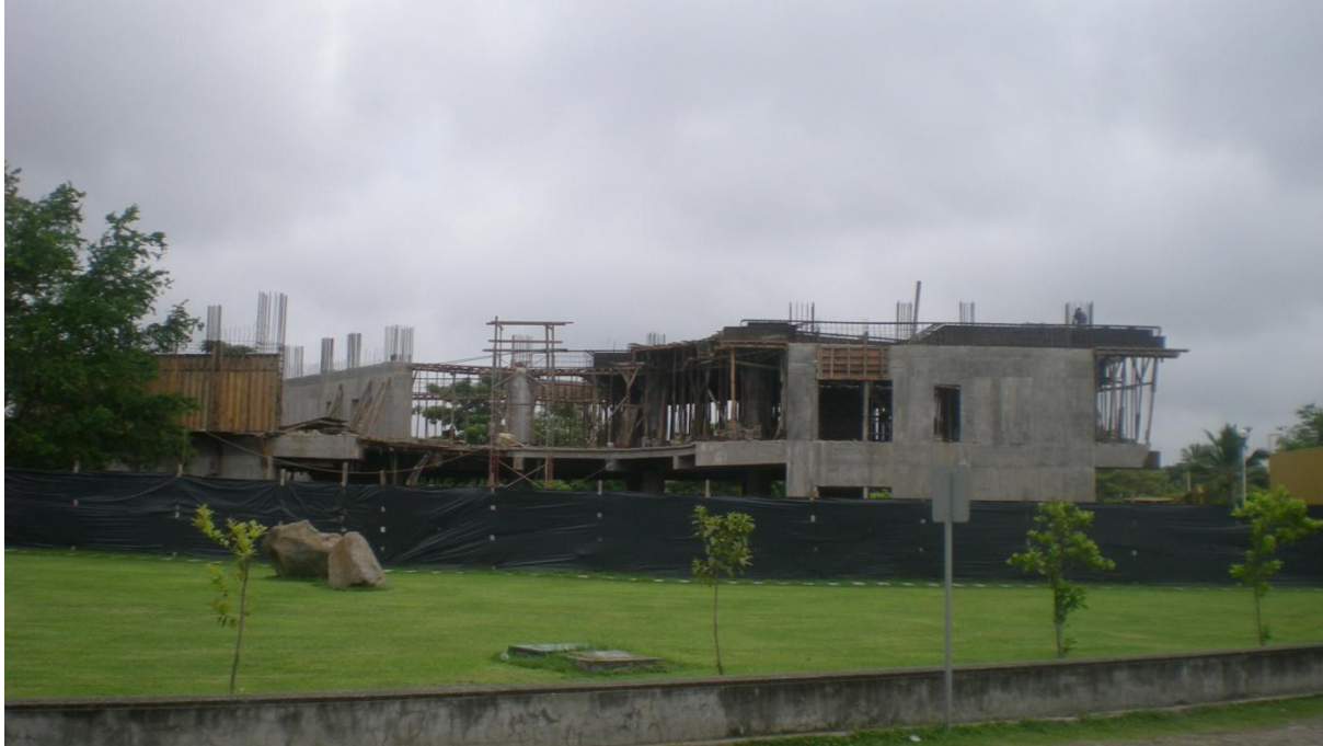
Primera Etapa de Construcción de Edificio Administrativo – Financiero