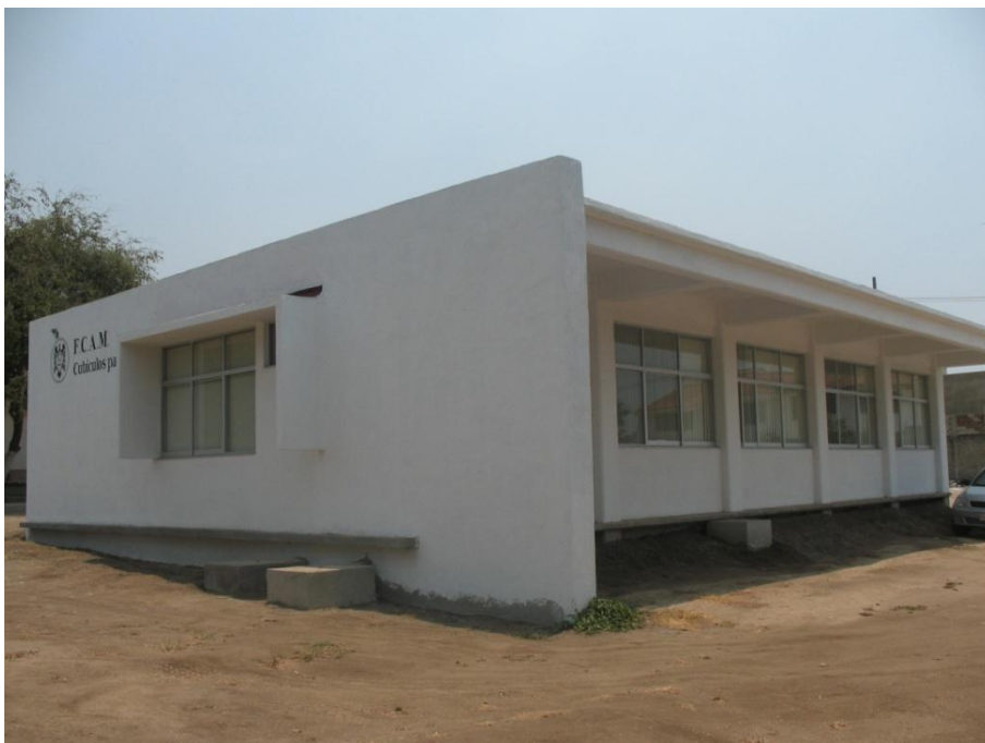
Edificio de Cubículos para P.T.C.- Facultad de Contabilidad y Administración