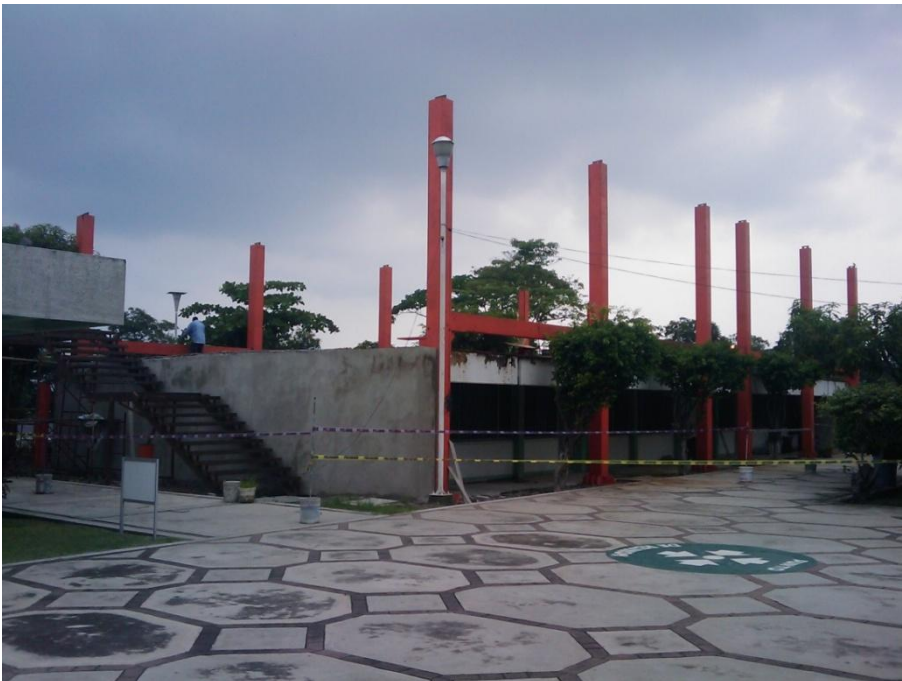
Ampliación a Segundo Nivel edificio de 4 Aulas.- Facultad de Medicina