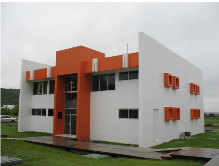
Pintura para el Laboratorio de Mecánica de Suelos.- Facultad de Ingeniería Civil