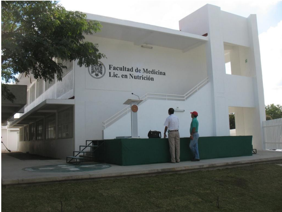
Construcción de 5 Aulas para la Lic. en Nutrición.- Facultad de Medicina