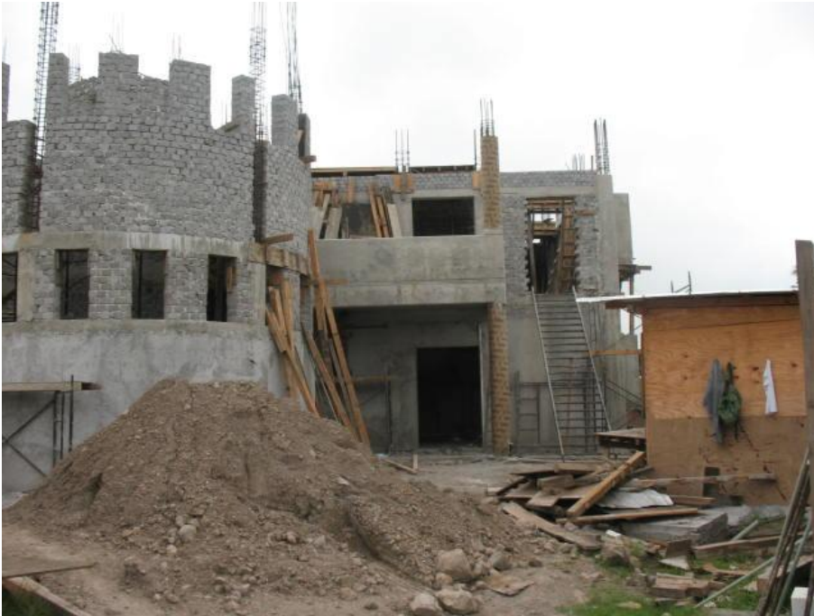
Construcción de Cubículos para P.T.C.- Facultad de Derecho