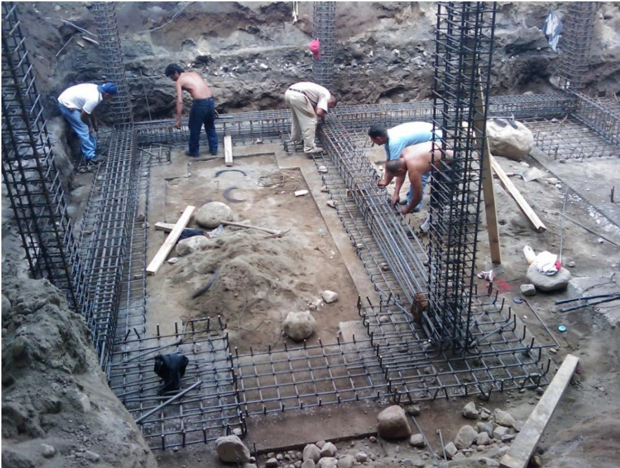
Construcción de Edificio para Aula-Taller.- Facultad de Lenguas Extranjeras