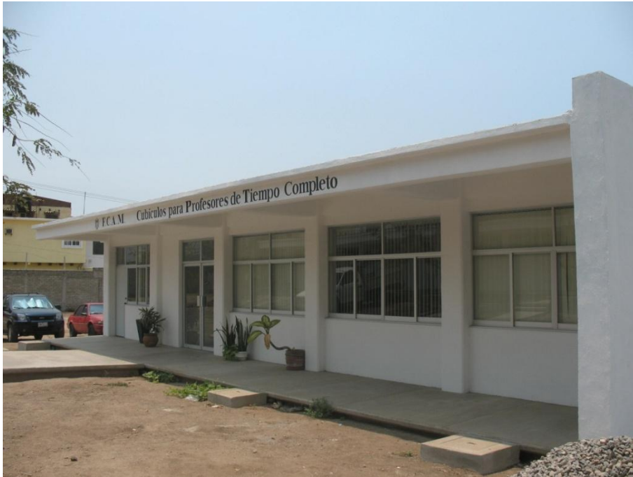
Edificio de Cubículos para P.T.C.- Facultad de Contabilidad y Administración