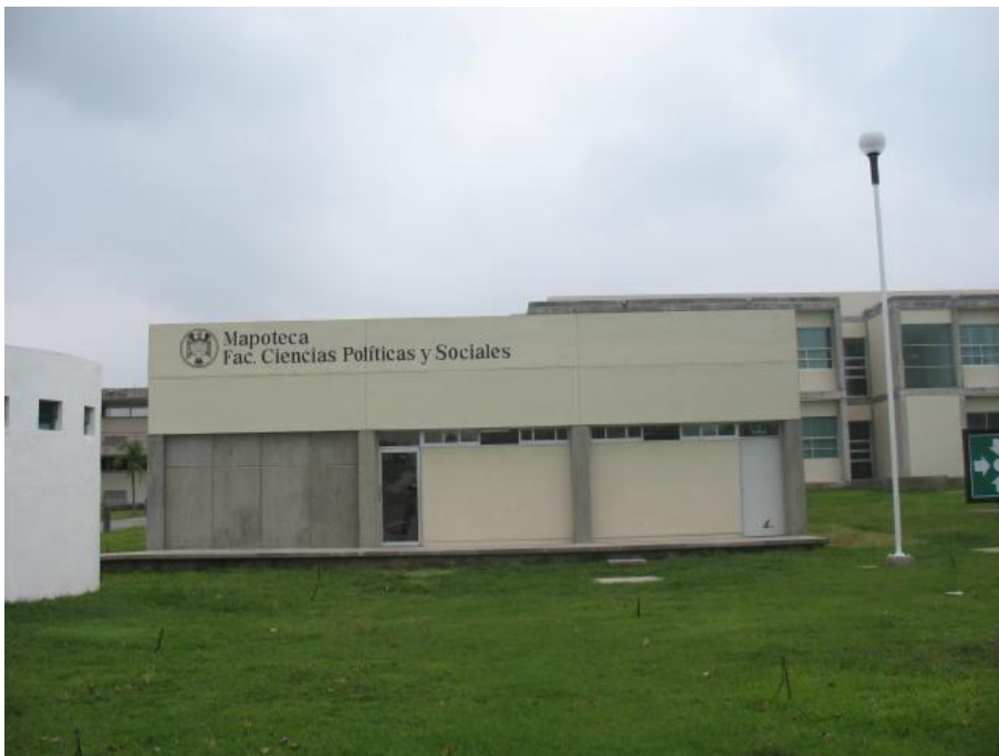
Construcción de Aula-Mapoteca.- Facultad de Ciencias Políticas y Sociales