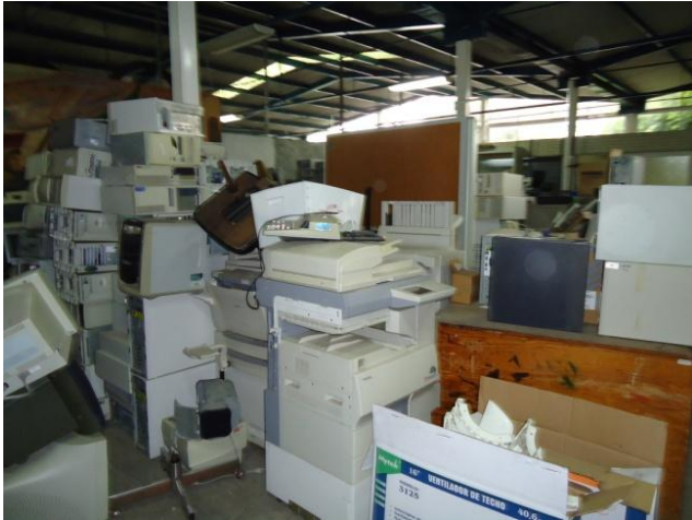
Centro de acopio después de la depuración