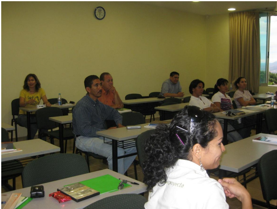
Asistencia a cursos de capacitación