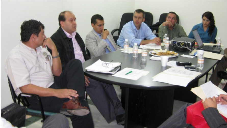
Actividades colegiadas con integrantes del IFAI y la CAIPEC.