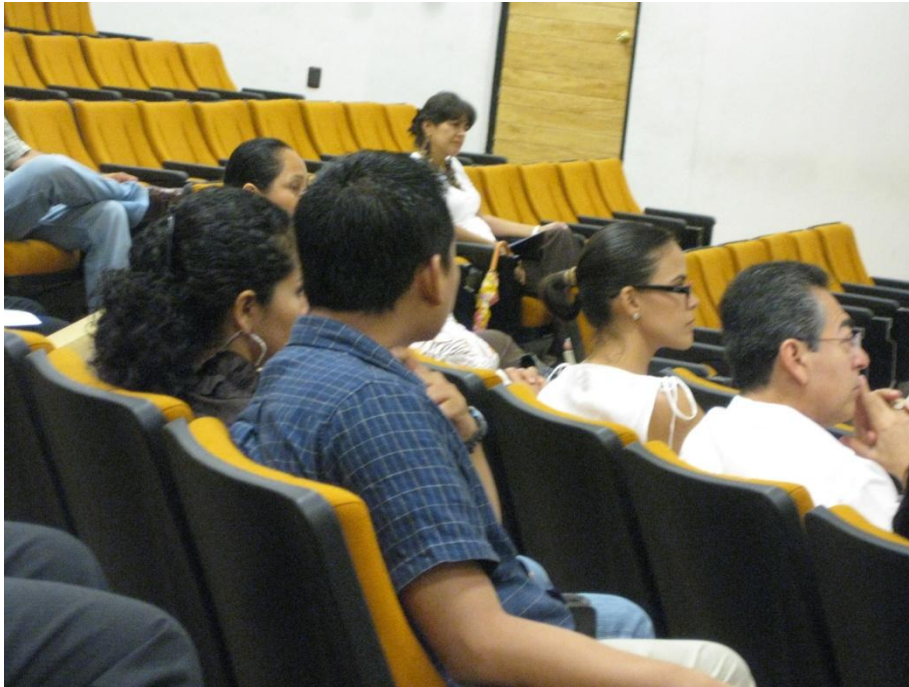
Asistencia a cursos de capacitación

UNIDAD DE ENLACE Informe de Actividades 2010