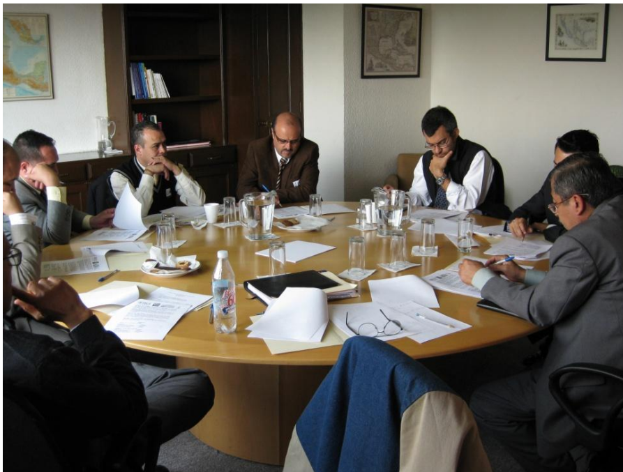
Actividades colegiadas con integrantes del IFAI y la CAIPEC