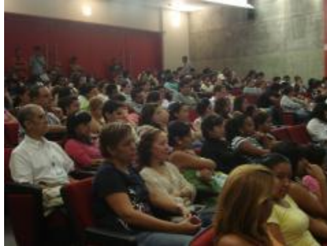
Público asistente al Coloquio Internacional de las Humanidad 2010