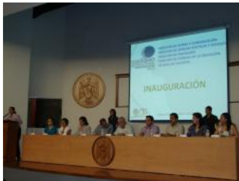
Inauguración del Coloquio Internacional de las Humanidades 2010