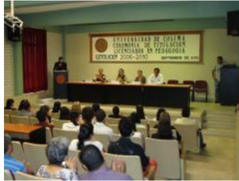
Titulación de la Generación 2006-2010