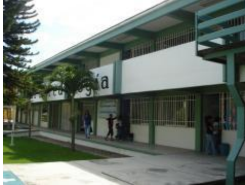
Aulas de la Facultad de Pedagogía