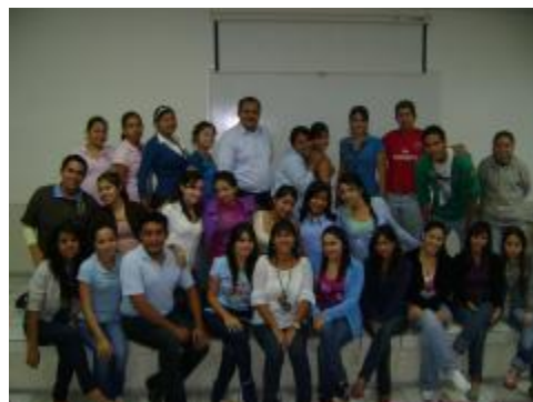
Taller Normativa APA dentro de la Semana de Aniversario 2010