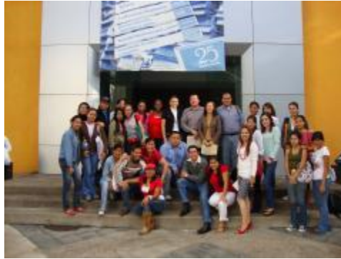
Participantes en la Semana de Aniversario 2010 (Alumnos, egresados, profesores y directivos)