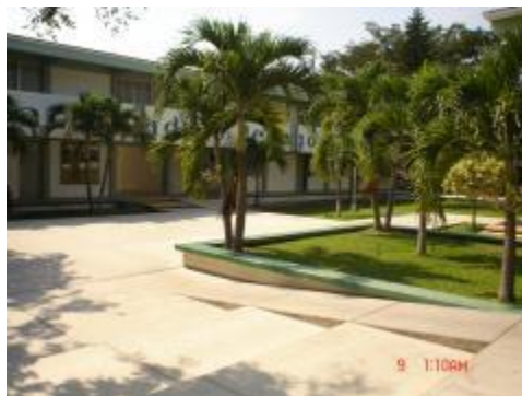
Patio central de la Facultad de Pedagogía