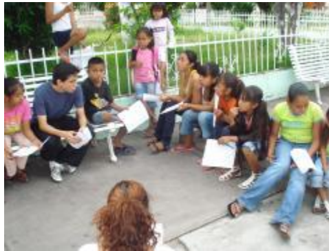
Estudiantes de Filosofía coordinan la comunidad de investigación de los niños de Zacualpan