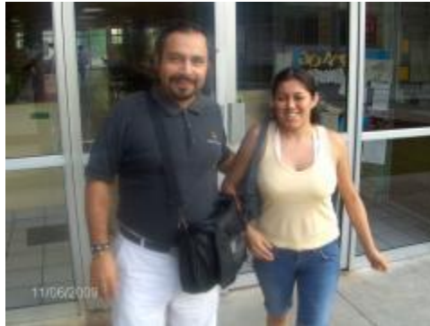
Estudiantes de Filosofía en la biblioteca de Humanidades

Escuela de Filosofía Informe de Actividades 2011