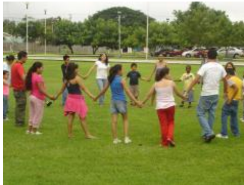
Filosofía para Niños: una comunidad para la indagación y la convivencia pacífica.