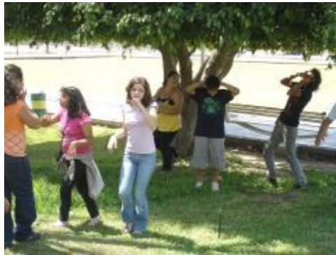
Facilitadores con los niños y adolescentes