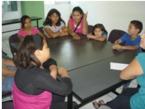
La comunidad de investigación de Filosofía para niños