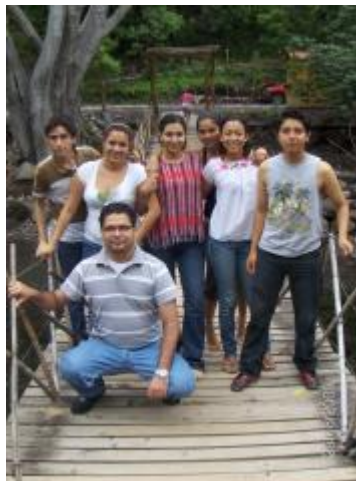
Algunos estudiantes que participan en el proyecto Formas convivenciales en la zona conurbada de Colima: Zacualpan y Real de Minas.