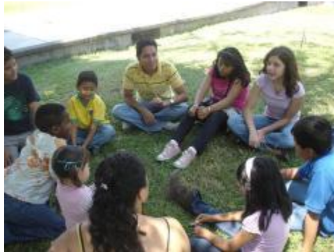
Filosofía para Niños en la Escuela de Filosofía

Escuela de Filosofía Informe de Actividades 2011