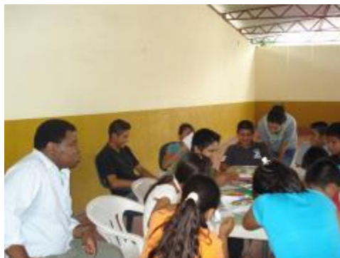
Trabajando con niños y adolescentes en Zacualpan