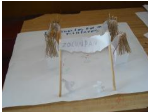
Zacualpan visto por sus niños