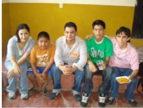
Profesora y estudiantes de Filosofía acompañados por un niño de Zacualpan