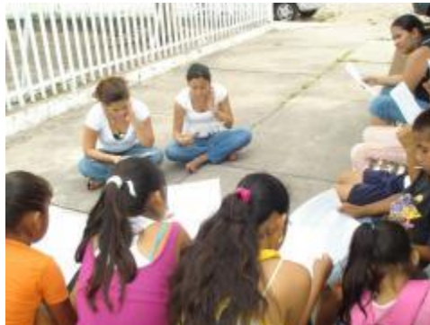
Las alumnas de Filosofía coordinan el trabajo de los niños