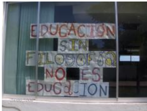
Pronunciamiento visual de los estudiantes, en contra de la eliminación de la filosofía en la educación media superior.