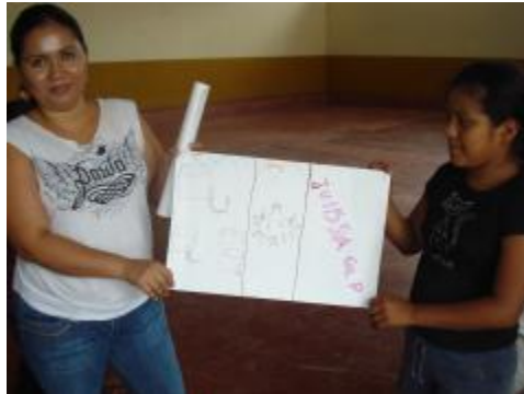
Otra versión de Zacualpan, de una niña trabajando con estudiante de Filosofía

Escuela de Filosofía Informe de Actividades 2011