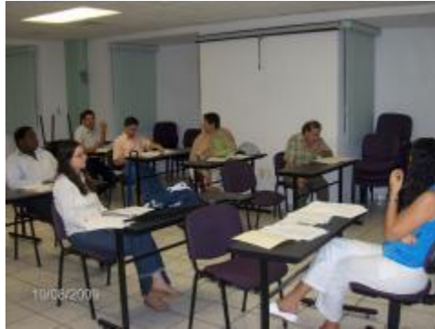
Profesores de la Escuela, en reunión de trabajo.