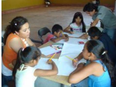
Otro equipo de trabajo en Zacualpan