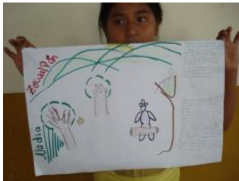
Así se percibe Zacualpan