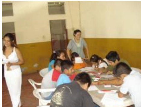
Trabajando con los niños en Zacualpan