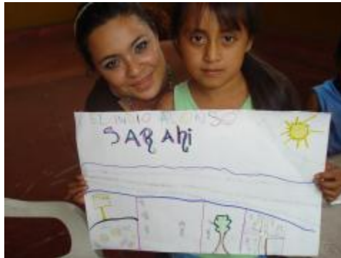
Recuperando y reflexionando la historia de Zacualpan