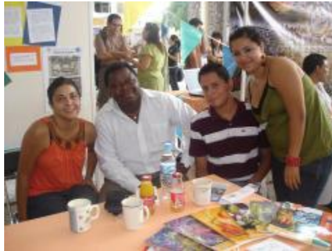
Difundiendo la Filosofía en la feria profesiográfica

Escuela de Filosofía Informe de Actividades 2011