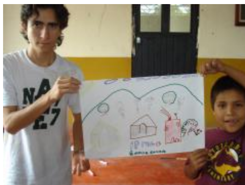
Zacualpan visto por sus niños, trabajando con estudiantes de Filosofía