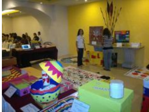
Exposición de Materiales en FIEEL 2011