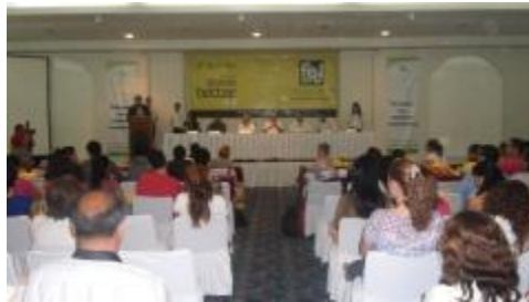
Ceremonia de Inauguración del IV Foro Internacional de Especialistas en Enseñanza de Lenguas