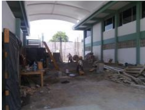
Construcción de Aula - Taller y explanada