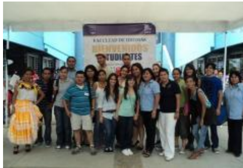
Bienvenida a alumnos de la FLEX en viaje de estudios a Oaxaca