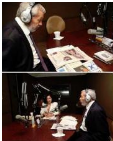
El periodista Miguel Ángel Granados Chapa en Radio Universo