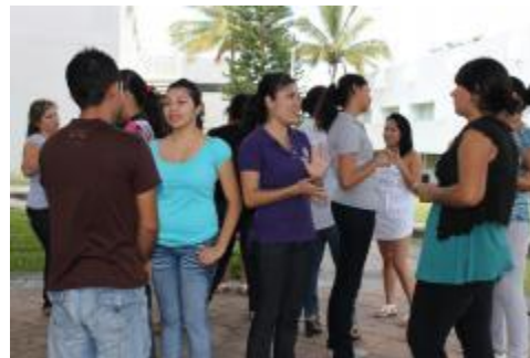
Alumnos realizando una dinámica en clase como estrategia de enseñanza - aprendizaje