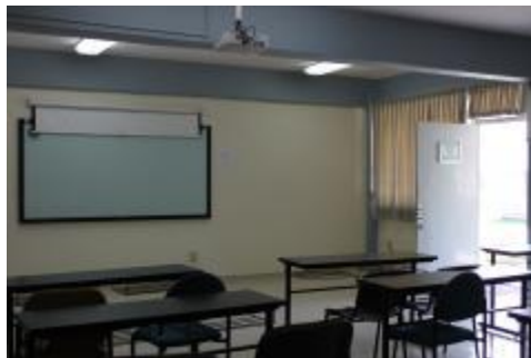
Instalacion de proyector de multimedia en las salas y aulas