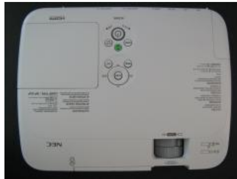
Proyector de multimedia

Facultad de Trabajo Social Informe de Actividades 2011