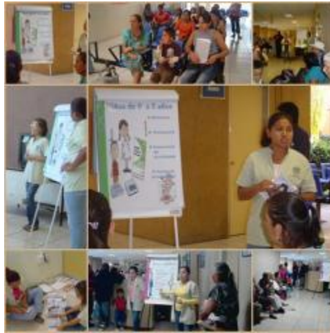
Ejecución de proyecto en el área de la salud