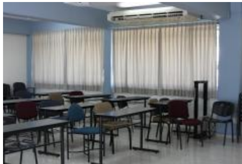
Instalacion de vitropiso y persianas y pintura del aula de usos multiples