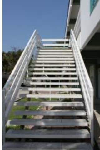
Reconstrucción de las escaleras del edificio B (aulas)