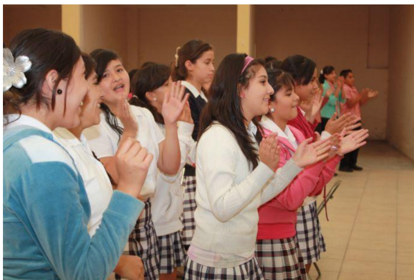
“2011, 35 Años de la Facultad de Ciencias Biológicas y Agropecuarias”

La DGI también participa como representante de la U de C en el programa estatal Ecoaventura, donde este año les apoyamos nuevamente en la gestión para que participaran decenas de estudiantes de bachillerato y licenciatura en diversas actividades y les quemamos un total de diez mil discos compactos con la música de ese programa.