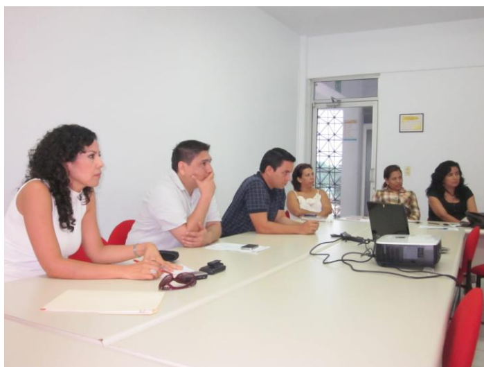
“2011, 35 Años de la Facultad de Ciencias Biológicas y Agropecuarias”

La DGI no ha trabajado en ningún sistema de gestión de la calidad. Sin embargo, ya comenzamos a definir el modelo de comunicación institucional, como Unidad de Comunicación Social que somos ahora, con el propósito de certificar en algún momento uno de los procesos, el proceso más frecuente de comunicación en la Universidad de Colima.