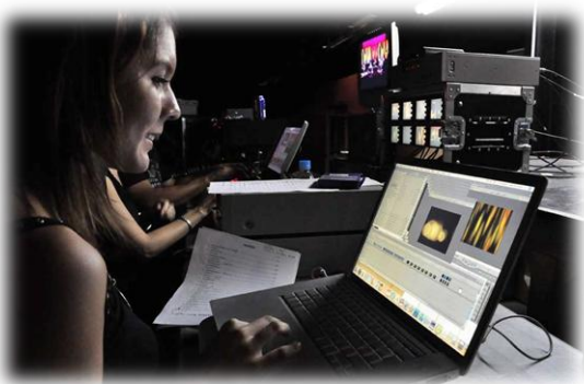
PRODUCCIÓN DE VIDEO Y AUDIO DIGITAL

A continuación presentamos los proyectos y programas desarrollados este año en las diferentes áreas que integran nuestra dependencia: