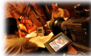
El comentario en Radio y Televisión

Los tres programas se transmiten de manera diferida como se explica a continuación: