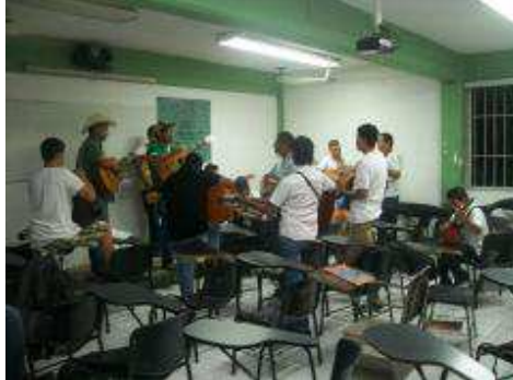
Ensayos de alumnos del Bachillerato Técnico N° 11 que integran la Rondalla del plantel.