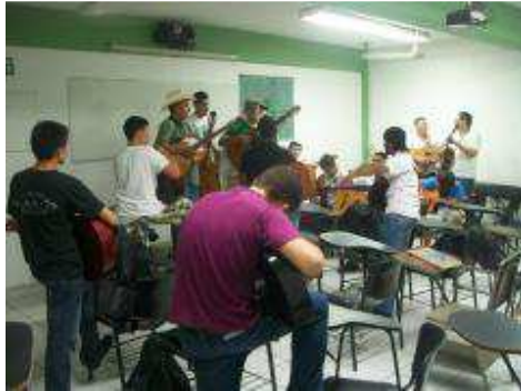
Rondalla del Bachillerato Técnico N° 11