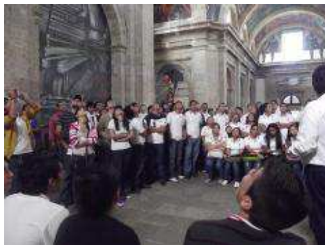
Alumnos en su visita al Hospicio Cabañas