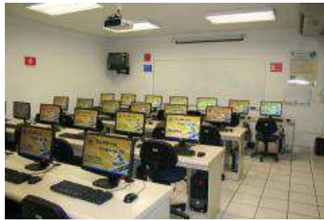
Centro de Cómputo del Bachillerato