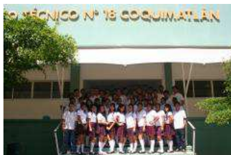
Alumnos de primer semestre grupo B