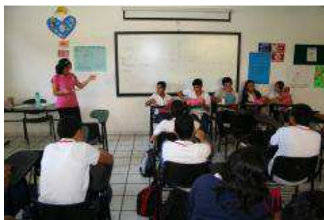
Alumnos de 3er. semestre en la Charla -Taller " Prevención de Embarazo".