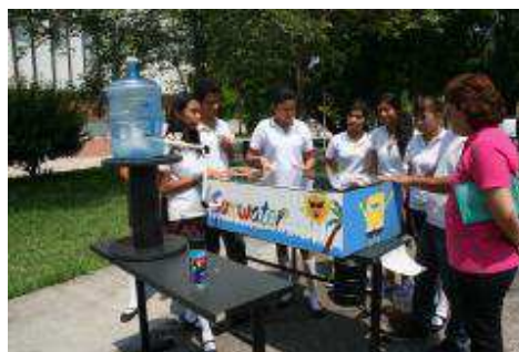
Proyecto "Calentadores Solares" con alumnos de 5to. Semestre