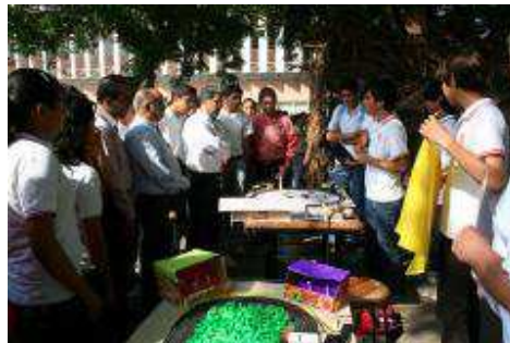
Alumnos del plantel en la ExpoBach 2012