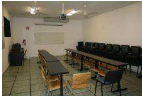
Biblioteca del plantel