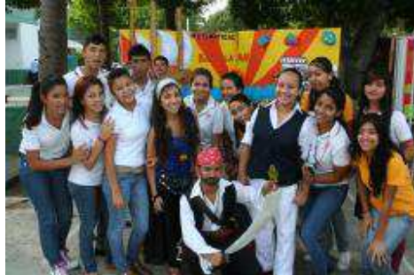
Alumnos de 5to. semestre grupo B en la ExpoBach 2012