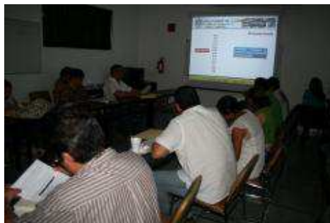
Semestre Enero - Julio 2012