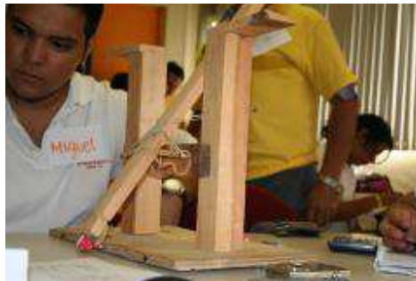
5to. Foro de Estudiantes de Bachillerato "Construyendo la Ciencia".