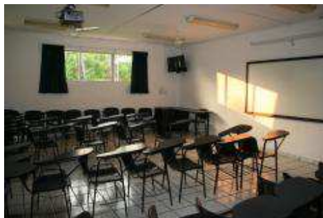
Aulas del Bachillerato Técnico No. 18