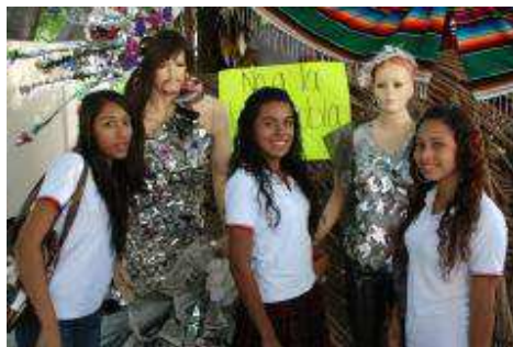
Alumnos en la ExpoBach 2012