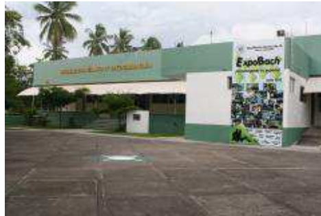
Edificio del Bachillerato Técnico No. 18