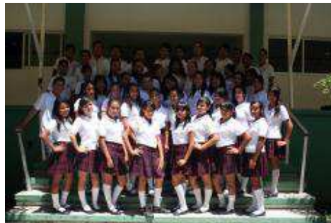
Alumnos de primer semestre grupo A