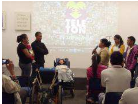
Alumnos del Bachillerato en su visita al CRIT Guadalajara