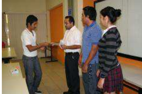
Entrega de Becas a los alumnos del Bachillerato Técnico No. 18