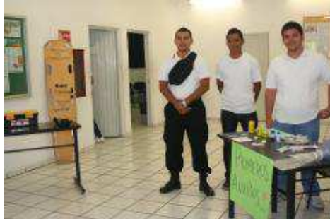
Feria de Oficios 2012