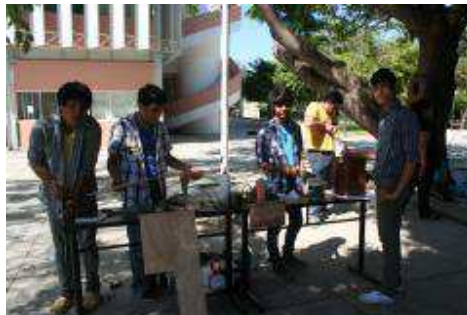
Feria de Oficios 2012