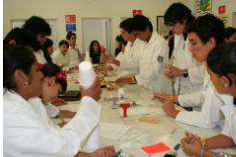
5to. Foro de Estudiantes de Bachillerato "Construyendo la Ciencia".