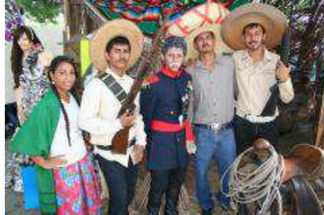
Alumnos del plantel en la ExpoBach 2012