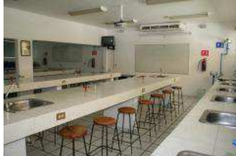
Laboratorio del plantel