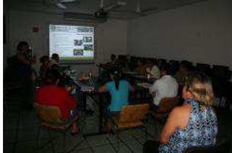
Reunión de trabajo con docentes del plantel