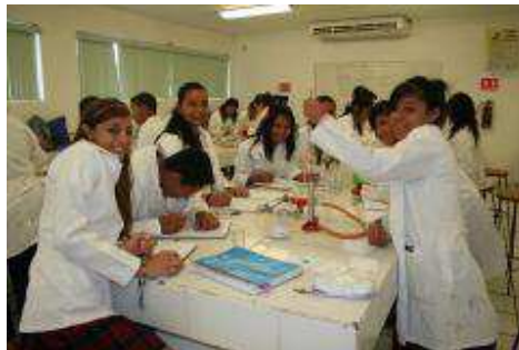
Alumnos de primer semestre realizando práctica de laboratorio de Química I