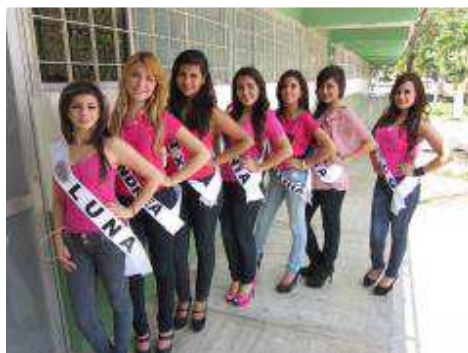
Colecta Anual Cruz Roja Mexicana