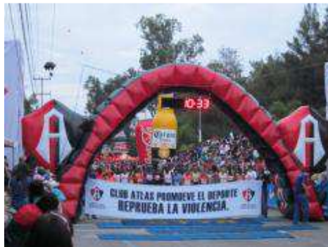
22vo. Medio Marat

22vo. Medio Maratón (21.0975 km), organizado por el Club Átlas, En Colomos, Guadalajara