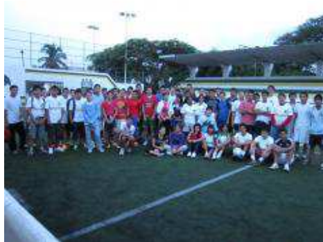
Torneo de F

Segundo Torneo de Fútbol Rápido Varonil, en el Polideportivo Central de Colima, realizado el 7 de octubre del 2011, para los primeros semestres, participando un total de 120 alumnos, quedando en PRIMER LUGAR el 1ºF, SEGUNDO LUGAR EL 1ºH Y TERCER LUGAR EL 1ºC, otorgandose como premios material deportivo a cada uno de los ganadores.