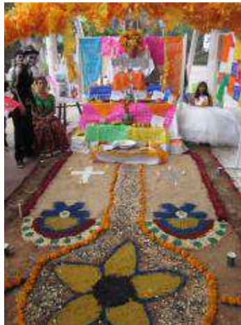
Altare de Muertos

Se realizo la celebración, montaje y concurso de Altare de Muertos el 31 de Octubre del 2011, en los patios del plantel, con un total de 24 Altare, donde se mostro la gran creatividad, trabajo en equipo, organización, disposición y sobretodo las competencias genericas puestas en practica por los mas de 1200 alumnos participantes. Se otorgaron premios por semestre a cada grupo ganador.