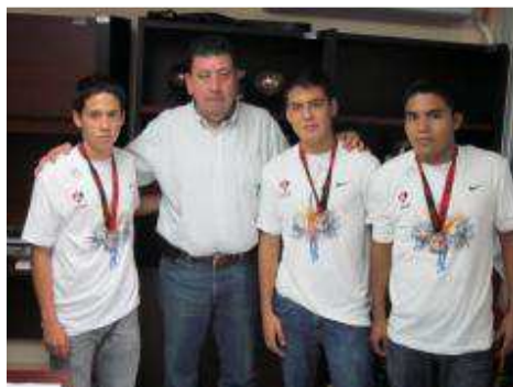
22vo. Medio Marat

22vo. Medio Maratón (21.0975 km), organizado por el Club Átlas, En Colomos, Guadalajara