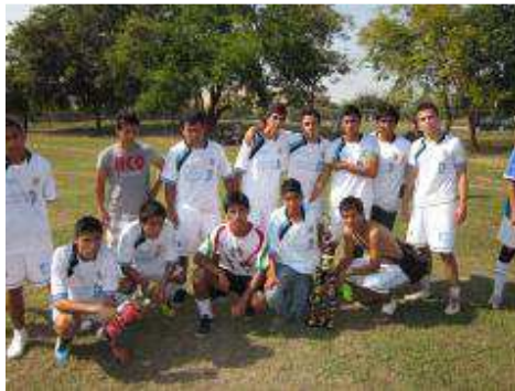
Liga Universitaria 2011