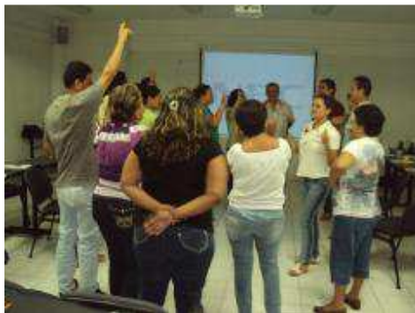
CURSOS ESCUELA PARA PADRES.