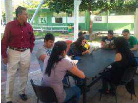
ACTIVIDADES DEL CLUB SABATINO DE LECTURA