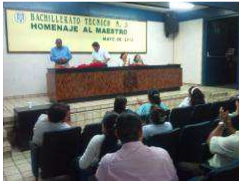
HOMENAJE AL MAESTRO, MAYO 2012.