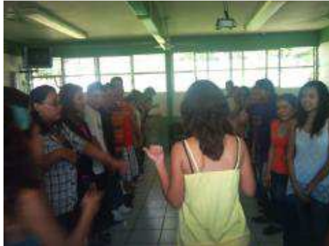
CLUB SABATINO DE SUPERACIÓN PERSONAL (SUPERA)