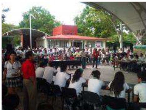
MARATON DE CONOCIMIENTOS.