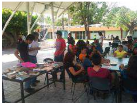
CLUB SABATINO DE LECTURA