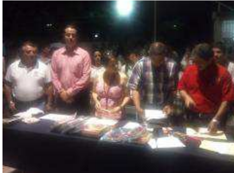
MARATON DEL CONOCIMIENTO.