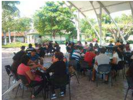
CLUB SABATINO DE LECTURA