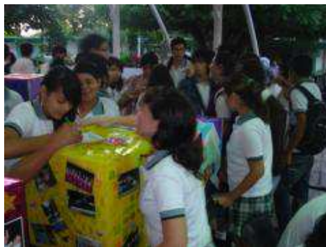
ENCUESTA DE VALORES Y TRADICIONES.