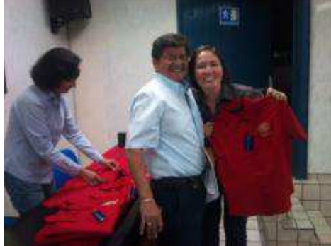
HOMENAJE AL MAESTRO, MAYO 2012.