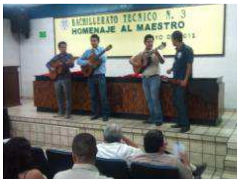
HOMENAJE AL MAESTRO, MAYO 2012.