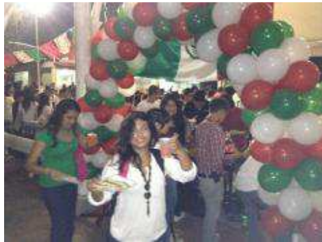
VERBENA MEXICANA MES DE SEPTIEMBRE