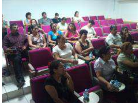
CURSO DE ESCUELA PARA PADRES