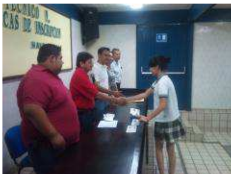
ENTREGA DE BECAS DE INSCRIPCIÓN.