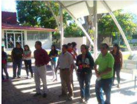
INICIO DE ACTIVIDADES DEL CLUB DE LECTURA.