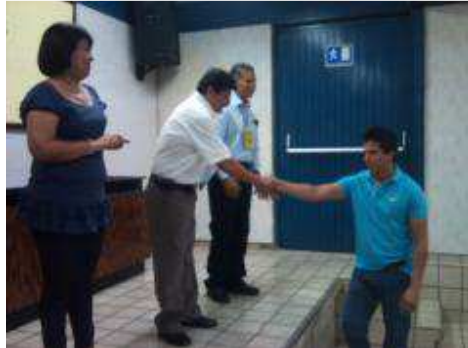
ENTREGA DE BECAS DE EXCELENCIA.