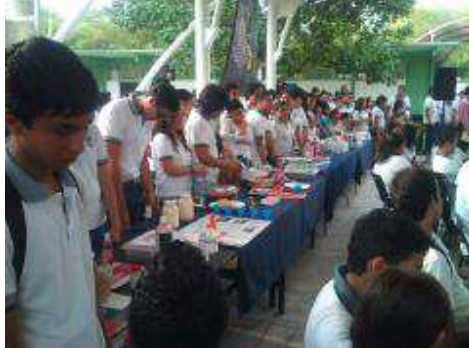
EXPOSICIÓN DE EVIDENCIAS DE QUIMICA I.