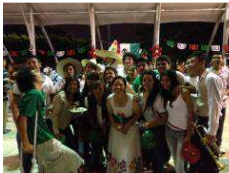
VERBENA MEXICANA MES DE SEPTIEMBRE