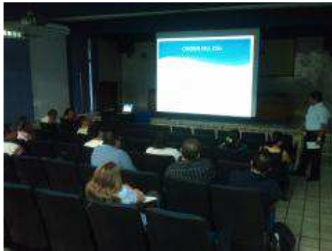
REUNIÓN DE TRABAJO CON DOCENTES DEL SEMIESCOLARIZADO.