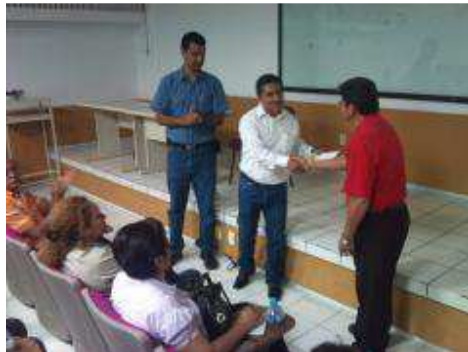
CLAUSURA DE LA ESCUELA PARA PADRES