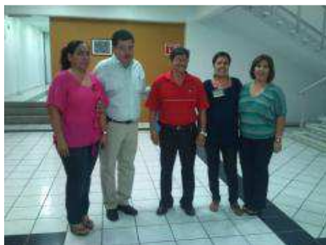
EQUIPO DE TRABAJO: ESCUELA PARA PADRES.