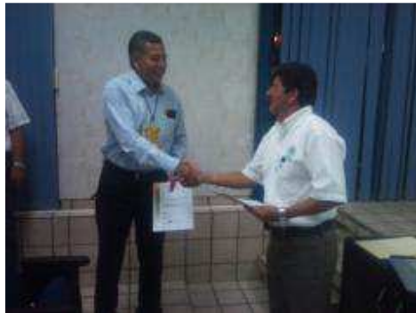
ENTREGA DE CONSTANCIAS DE CURSOS INTERSEMESTRALES.