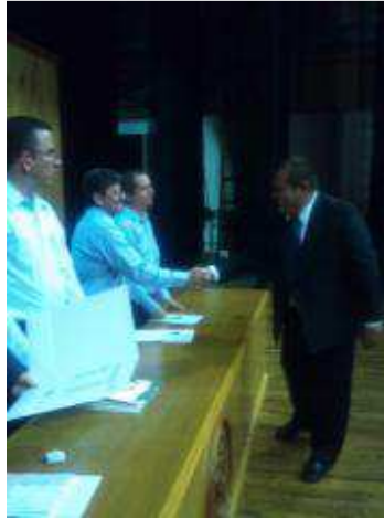
CEREMONIA DE ENTREGA DE CERTIFICADOS DE LA GENERACIÓN 2009-2012 SEMIESCOLARIZADO.