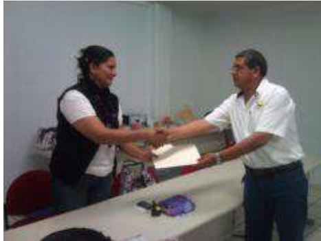
CLAUSURA DE LA ESCUELA PARA PADRES