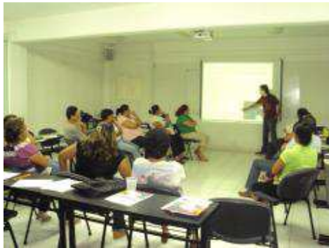
CURSOS ESCUELA PARA PADRES.