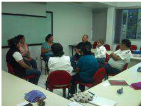
ACTIVIDADES DE LA ESCUELA PARA PADRES