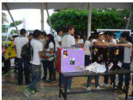
ENCUESTA DE VALORES Y TRADICIONES.