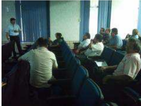
REUNIÓN DE TRABAJO CON DOCENTES DEL SEMIESCOLARIZADO.