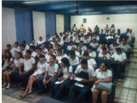
ENTREGA DE BECAS DE INSCRIPCIÓN.