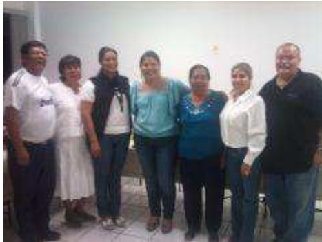
ASISTENTES AL CURSO DE ESCUELA PARA PADRES