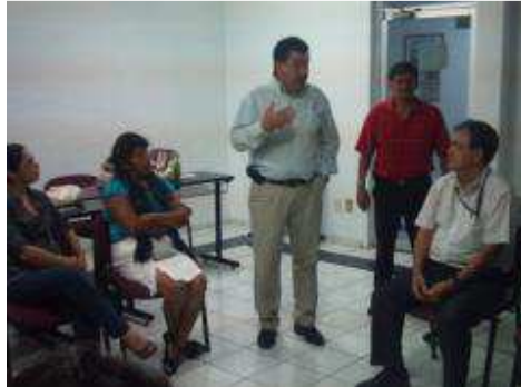
ESCUELA PARA PADRES