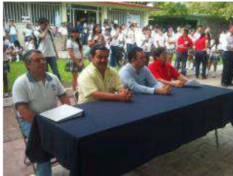
FESTIVAL DE LECTURA 2012.