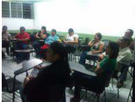
REUNIÓN DE ACADEMIAS