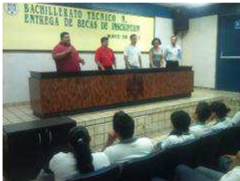
ENTREGA DE BECAS DE INSCRIPCIÓN.