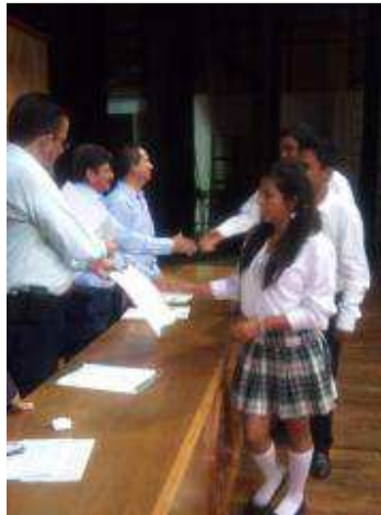
CEREMONIA DE ENTREGA DE CERTIFICADOS DE LA GENERACIÓN 2009-2012