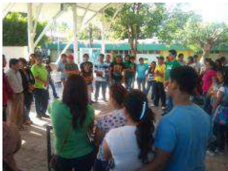
INICIO DE ACTIVIDADES DEL CLUB DE LECTURA.