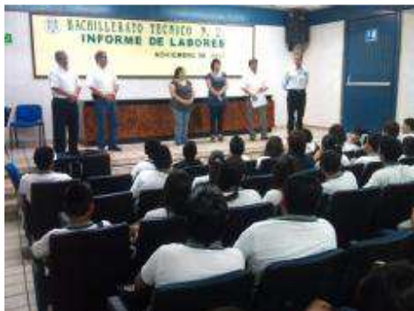
ENTREGA DE BECAS DE EXCELENCIA.