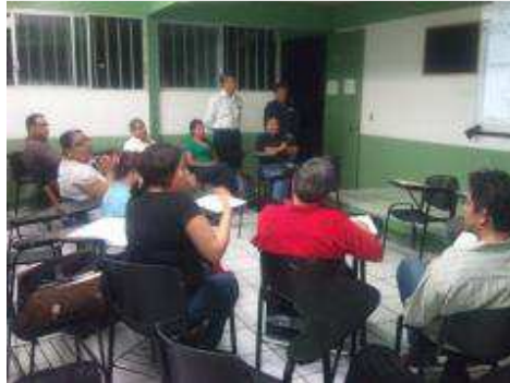
REUNIÓN DE ACADEMIAS