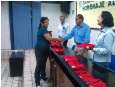
HOMENAJE AL MAESTRO, MAYO 2012.