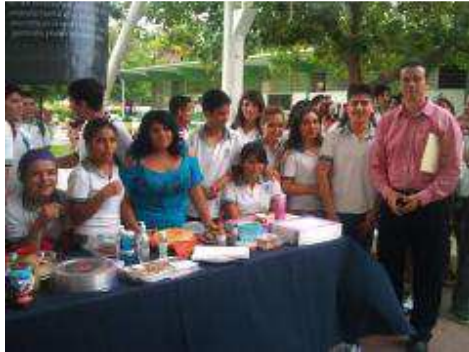
EXPOSICIÓN DE EVIDENCIAS DE QUIMICA I.