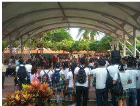
FESTIVAL DE LECTURA