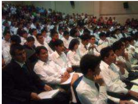
CEREMONIA DE ENTREGA DE CERTIFICADOS DE LA GENERACIÓN 2009-2012