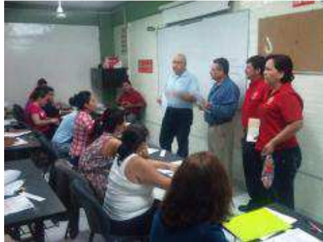
REGISTRO AL CENEVAL, SEMIESCOLARIZADO 2012.