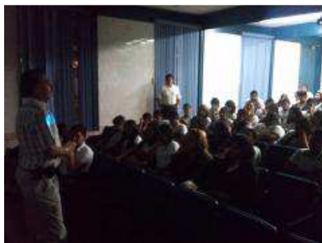
CURSOS DE NIVELACIÓN MATEMÁTICAS