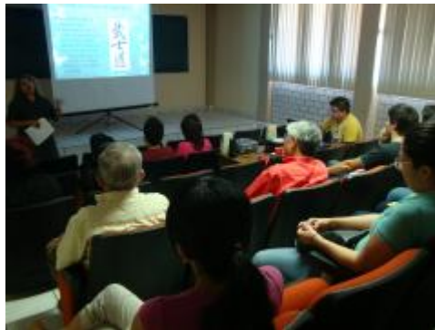
Verano de Investigaci