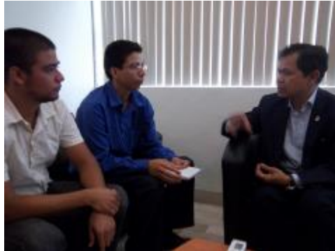
Seminario Internacional sobre la Cuenca del Pacífico 2011

Centro Universitario de Estudios e Inv. Sobre la Cuenca del Pacífico Informe de Actividades 2012