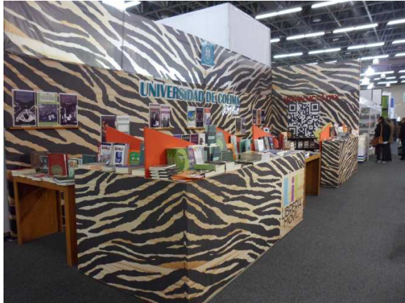
Feria Internacional del Libro de Guadalajara / FIL 2011