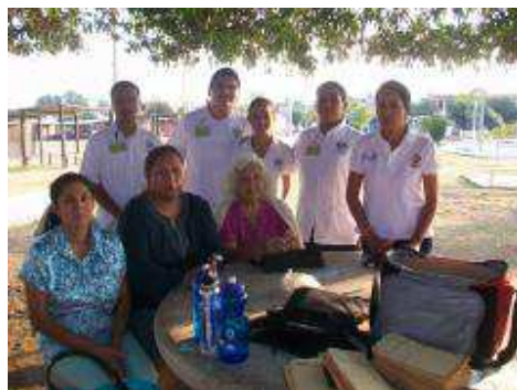
Estudiantes realizan proyectos de intervención en Colonias del Municipio de Colima.