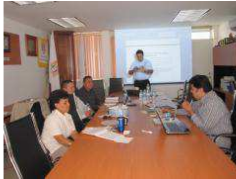
Profesores de Tiempo Completo participan en actividades de CA con otras Universidad del país.