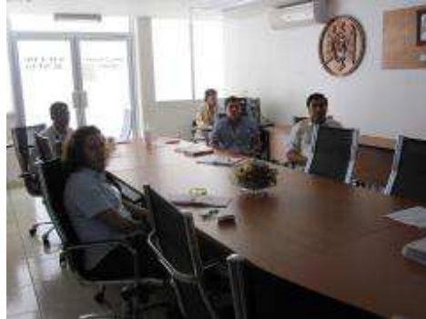
Profesores que participan en academias.