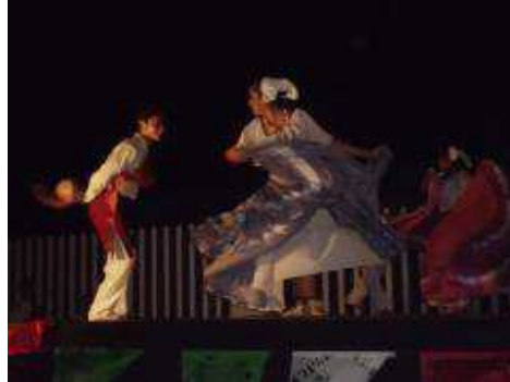
Ballet folklórico de IUBAM