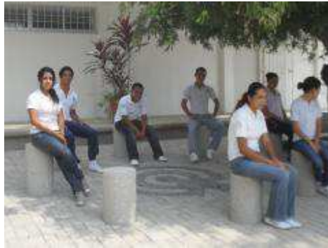
Alumnos de Informática.