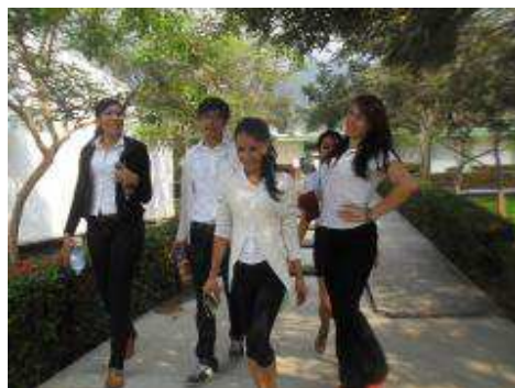
Alumnos de la Licenciatura en Administración de Empresas.