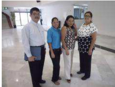
Directivos del plantel.