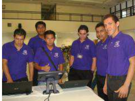
Exposición de trabajos.