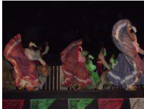
Ballet folklórico de IUBAM