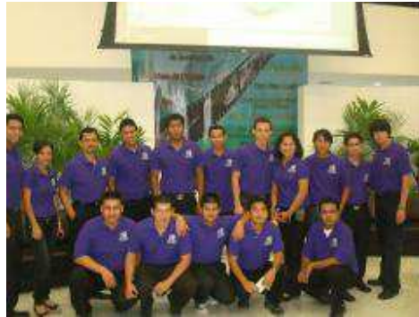
Alumnos de la Licenciatura en Informática Administrativa.