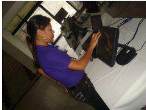
Exposición de trabajos.