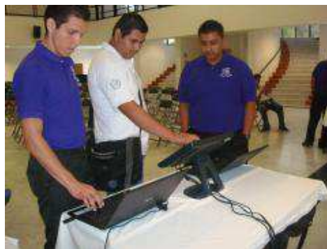
Exposición de trabajos.