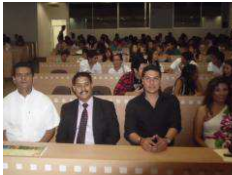
Ponentes de las conferencias.