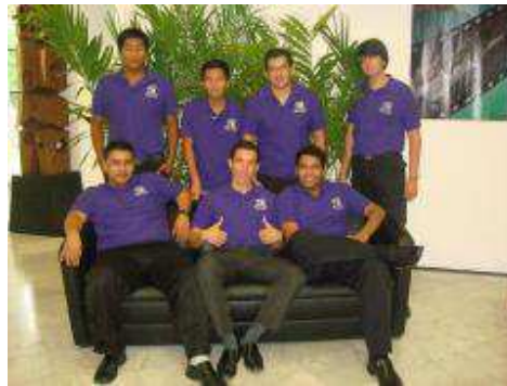
Alumnos Ideas Creativas FCAM 2012.