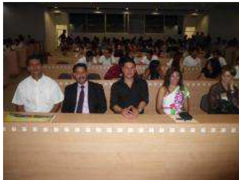
Ponentes de las conferencias.