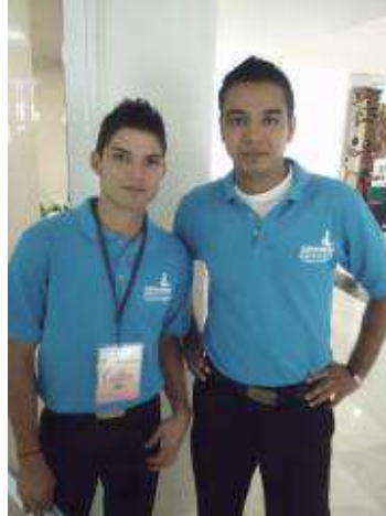
Alumnos miembros del comité organizador del congreso.