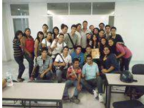
Alumnos al término del taller.