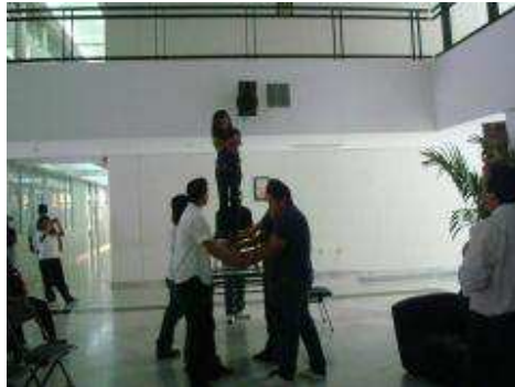
Conferencia "Rompiendo tus límites"

Ideas creativas FCAM 2012 Liderazgo y Tecnología