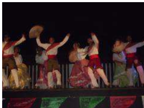
Ballet folklórico de IUBAM