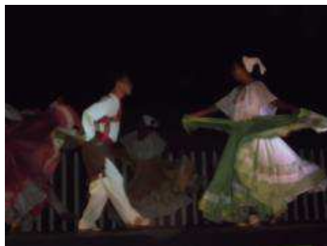
Ballet folklórico de IUBAM