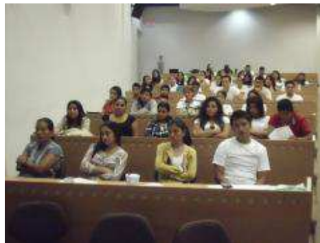
Alumnos en conferencia