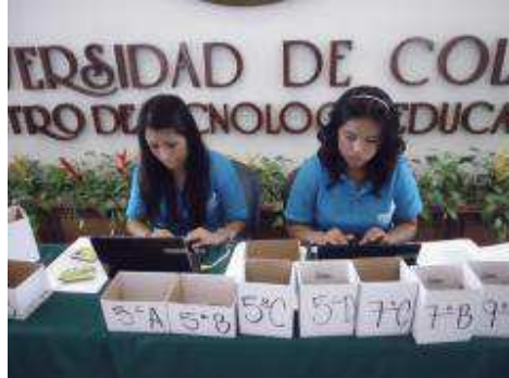
Alumnos encargados en registro de asistentes.