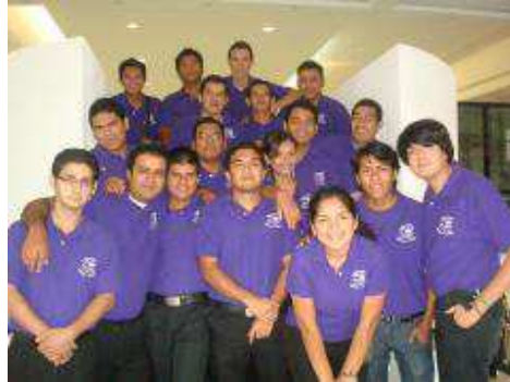
Alumnos Ideas Creativas FCAM 2012.