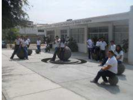
Alumnos de Contador Público en plazoleta.