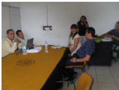
Docentes en reunión de trabajo.