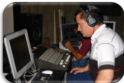
PRODUCCIÓN DE VIDEO Y AUDIO DIGITAL