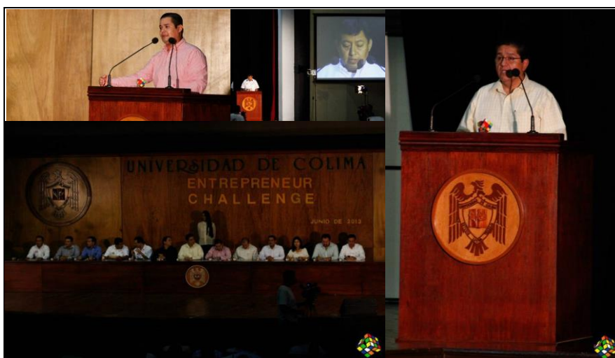
Inauguración Entrepreneur Challenge