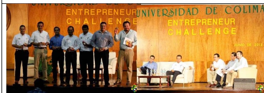
Panel Entrepreneur Challenge