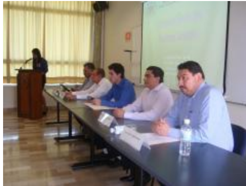
XXXIII Aniversario. Participación de experiencias de Ex-Municipales egresados de esta Facultad.