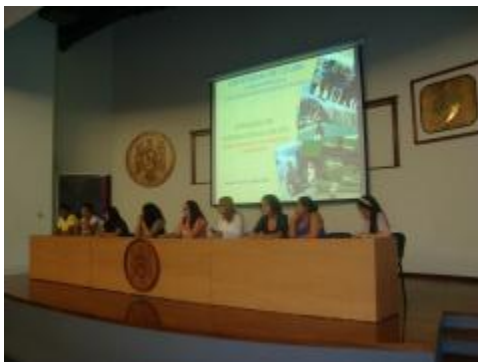
XXXIII Aniversario. Exposición de experiencias de Intercambios Académicos.