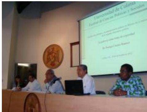
XXXIII Aniversario. Mesa de trabajo "Desafíos del gobierno y la gestión pública en México"