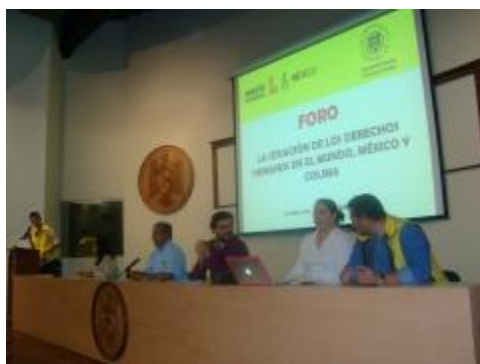
Foro sobre Amnistía Internacional.