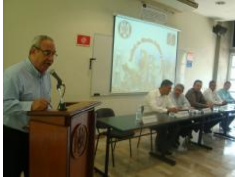
Inauguración del XXXIII Aniversario de la Facultad de Ciencias Políticas y Sociales.