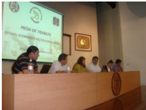
XXXIII Aniversario. Mesa de trabajo "Estado, Economía y Política en la Región."