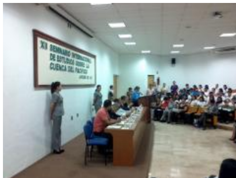
XII Seminario Internacional de estudios sobre la Cuenca del Pacífico.