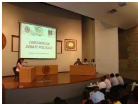
XXXIII Aniversario. Concurso de Debate Político.