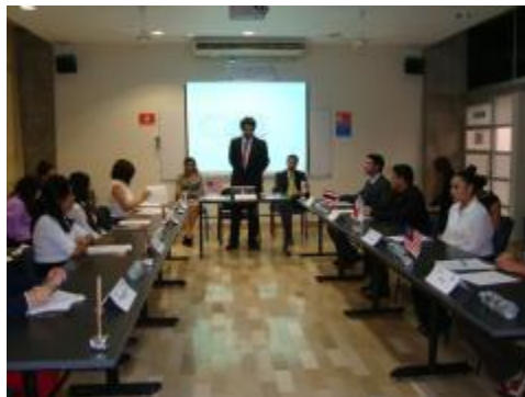
Simulación de la APEC.