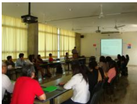
Exposición de ponencias por alumnos de la Licenciatura en Relaciones Internacionales.