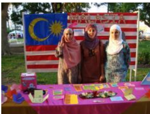
XXXIII Aniversario. Country Fair.