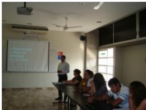
Charla sobre la Legislación local en materia electoral.