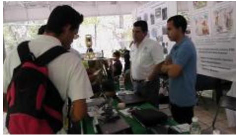
Alumno y profesor de FIME dando orientación