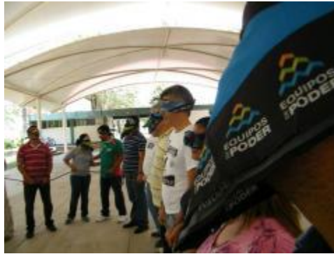
Ejercicio de comunicación