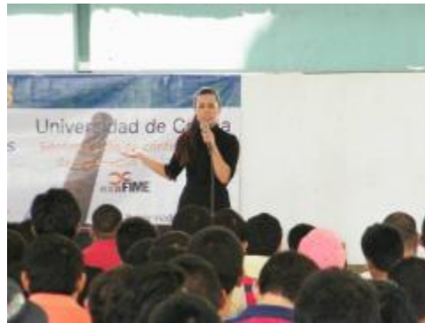
Alumnos en conferencia