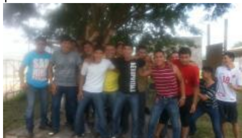
Curso de liderazgo y trabajo en equipo 2013: alumnos