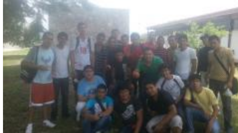
Curso de liderazgo y trabajo en equipo 2013: alumnos