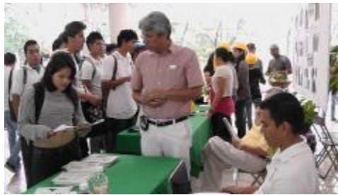
Profesores promocionando las carreras de FIME