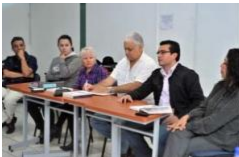
Inauguración del Diplomado en Metodología en Ciencias Sociales, organizado por la Facultad de Letras y Comunicación y el Centro Universitario de Investigaciones Sociales.