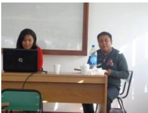
Alumnos exponiendo en el Encuentro Panamericano de Comunicación, en la Universidad Nacional de Córdoba, Argentina.