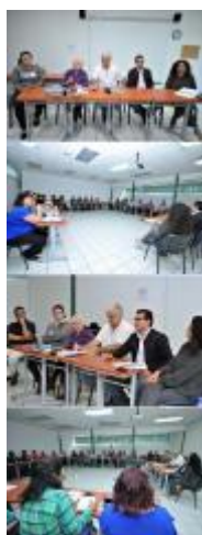
Aspectos del Diplomado en Metodología de Investigación en Ciencias Sociales, organizado por la Facultad de Letras y Comunicación y el Centro Universitario de Investigaciones Sociales.