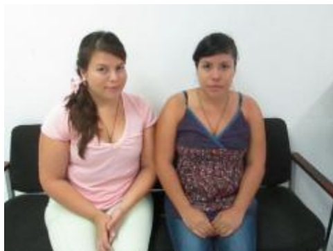
Alumnas participantes en el Congreso LASA 2013, en Santiago de Chile.