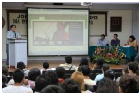
Presentación del sitio de internet de Andante ( www.andante.org.mx ).