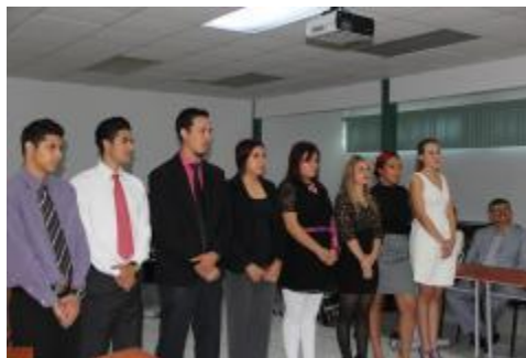
Firma de títulos de nuevos licenciados.