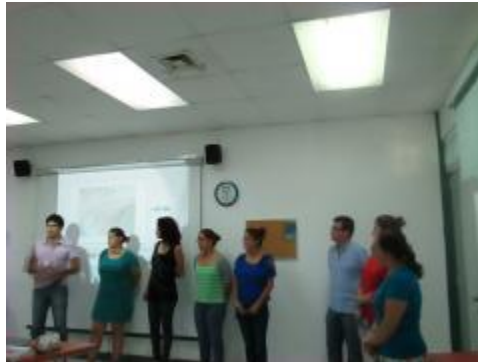
Inauguración de los cursos del Programa de Español Académico para Extranjeros.