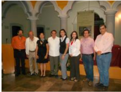
Otro aspecto de las Jornadas Académicas en honor a Griselda Álvarez, en la Pinacoteca Universitaria.