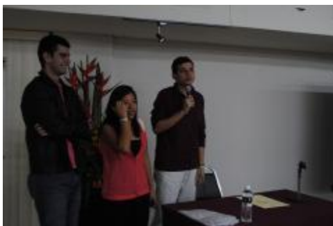
Alumnos que participaron en el Congreso Nacional CONEIC, en la Universidad Autónoma de Nuevo León.