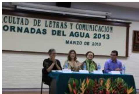
Mesa de trabajo de las Jornadas del Agua 2013.