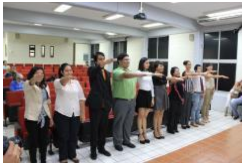
Toma de protesta a alumnos titulados.