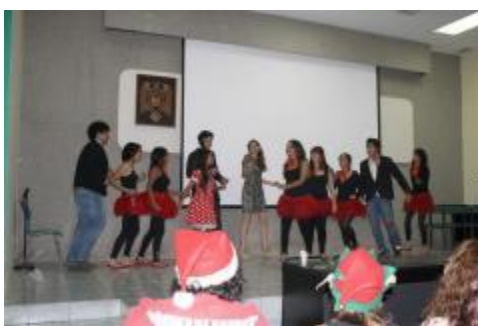
Aspecto del Xmas Fest, organizado por la Academia de Inglés del plantel.