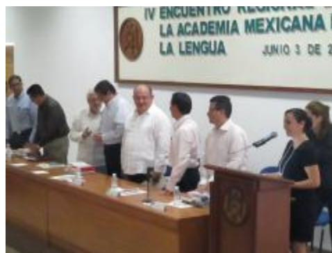
Inauguración del IV Encuentro Regional de la Academia Mexicana de la Lengua y firma de convenio entre la Universidad de Colima y la Academia Mexicana de la Lengua.