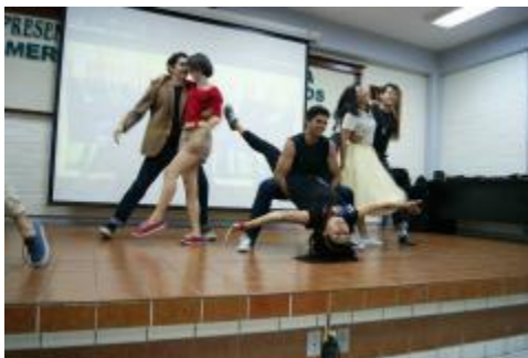
Actividades realizadas durante el Summer Fest, organizado por la Academia de Inglés del plantel.