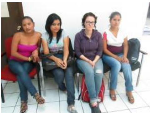
Alumnos visitantes que participaron en la Facultad de Letras y Comunicación, dentro de las actividades del Verano de la Investigación Científica.