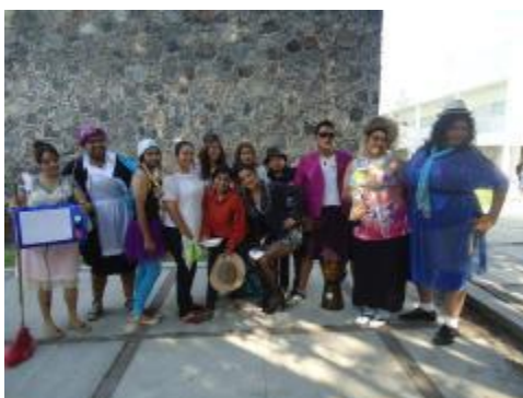
Aspecto del Summer Fest, organizado por la Academia de Inglés del plantel.