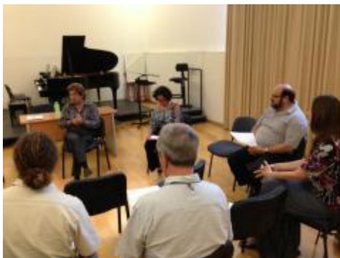
Reunión de trabajo para la definición de las LGAC del UCOL-CA-Arte y Sociedad.