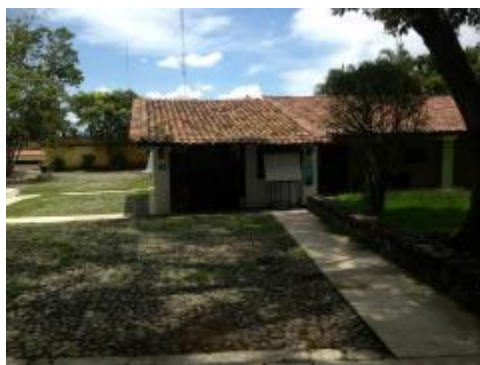
Instalaciones físicas del Departamento de Artes Visuales en la Ex Hda del Cóbano.