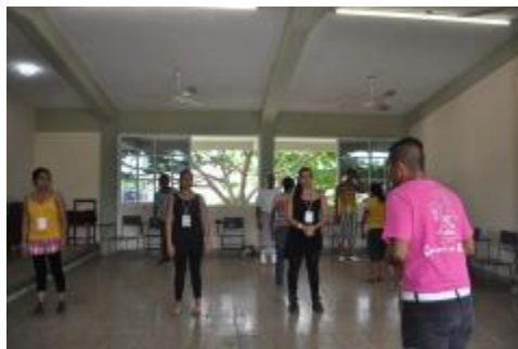
Viaje de estudios de los estudiantes de la Licenciatura en Danza Escénica a la ciudad de Cozumel.