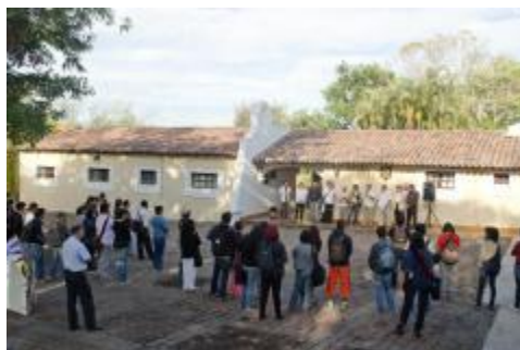
Estudiantes de la Licenciatura en Artes Visuales presentes en la inauguración de la XII Semana de las Artes Visuales.