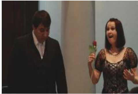
Estudiantes de la Licenciatura en Música en Concierto de Excelencia de Canto.