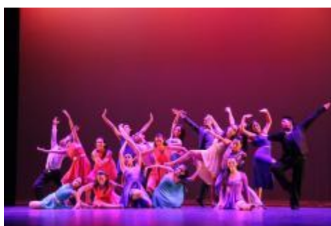
Estudiantes de la Licenciatura en Danza Escénica.