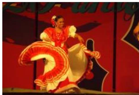
Viaje de estudios de los estudiantes de la Licenciatura en Danza Escénica a la ciudad de Xalapa, Veracruz.