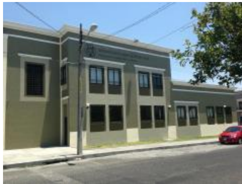
Instalaciones físicas de la ampliación del edificio, sala y cubículos de profesores.