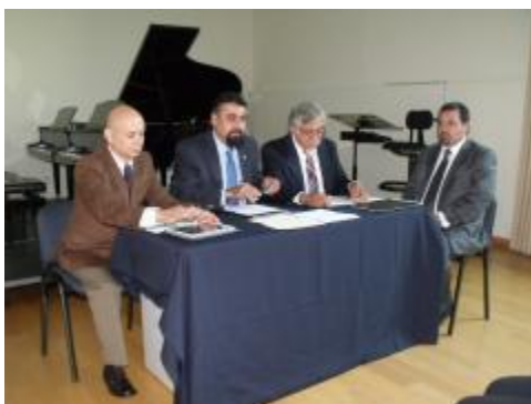
Titulación de estudiantes del PE de Lic. en Artes Visuales.