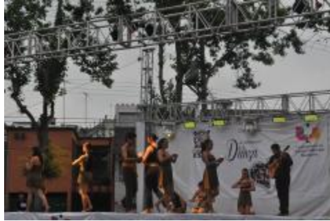
Viaje de estudios de los estudiantes de la Licenciatura en Danza Escénica a la ciudad de Xalapa, Veracruz.