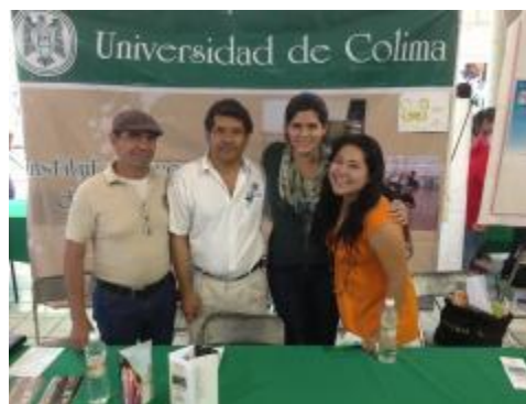
Estudiantes y profesores del IUBA participando en la Feria Profesiográfica 2013 en la ciudad de Colima.