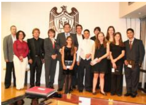
Concierto en Cd de México con la presencia del Sr. Rector de la Universidad de Colima.