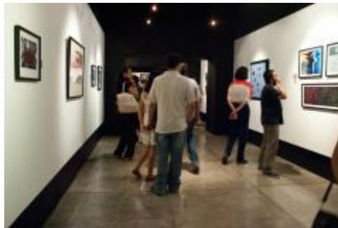
Exposición "Polifonías" que fue inaugurada en la XII Semana de las Artes Visuales.