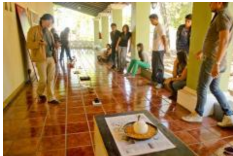
Taller de Experimentación Plástica impartido por el reconocido artista visual, Eloy Tarcisio.