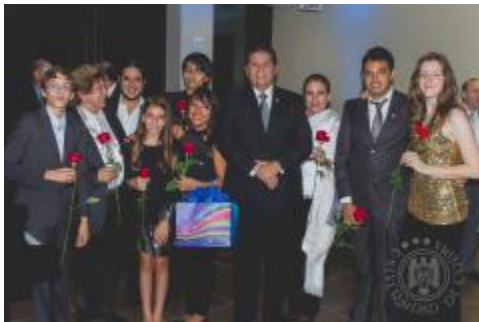
Formalización de relaciones de colaboración del IUBA con la International Music Academý en Dallas, Texas, EU.