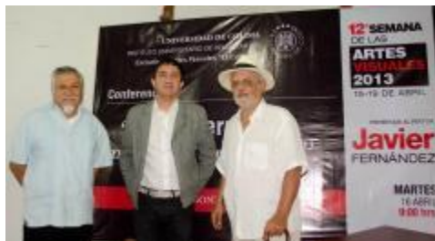
Evento de la Semana de las Artes Visuales.