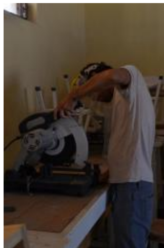
Estudiante de la Licenciatura en Artes Visuales en el Taller de Escultura.