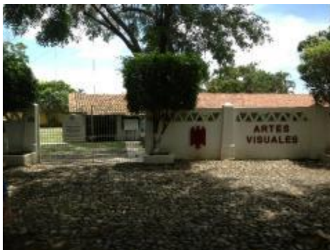
Instalaciones físicas del Departamento de Artes Visuales.