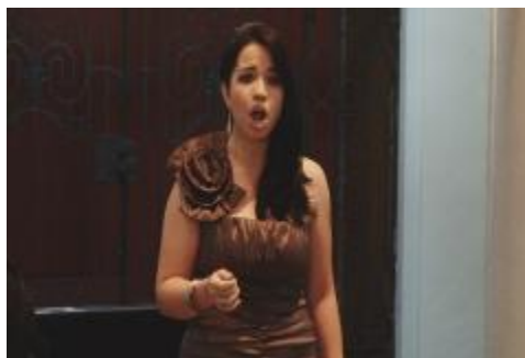
Estudiante de la Licenciatura en Música en Concierto de Excelencia de Canto.