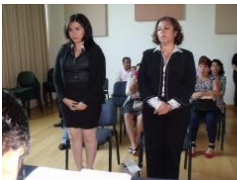
Titulación de egresadas del PE de Lic. en Artes Visuales.