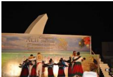
Viaje de estudios de los estudiantes de la Licenciatura en Danza Escénica a la ciudad de Cozumel.