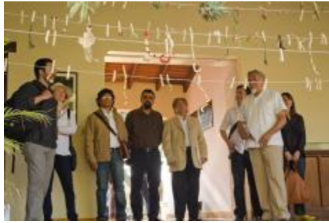
Trabajos realizados por los estudiantes de la Licenciatura en Artes Visuales.