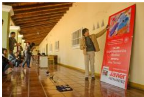
Taller de Experimentación Plástica impartido por el reconocido artista visual, Eloy Tarcisio.