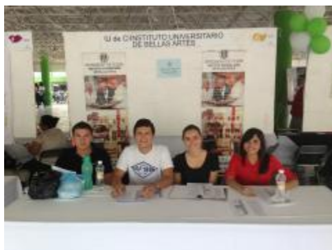
Estudiantes en Feria Profesiográfica.