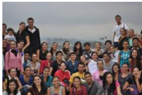
Viaje de estudios de los estudiantes de la Licenciatura en Danza Escénica a la ciudad de Xalapa, Veracruz.