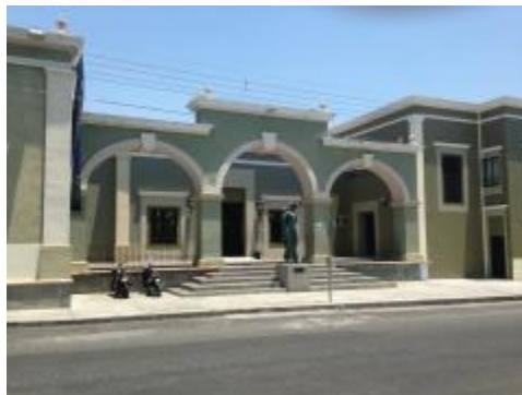
Fachada de la entrada al edificio del Departamento de Danza.