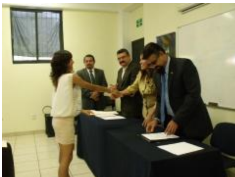
Titulación de estudiantes del PE de Lic. en Danza Escénica.