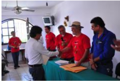
Entrega de reconocimiento al reconocido artista visual Eloy Tarcisio, director de "La Esmeralda".