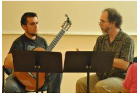
Festival Internacional de Guitarra "Guitarromanía 2013".