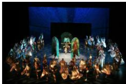
Ballet Folklórico de la Universidad de Colima (Oficial).