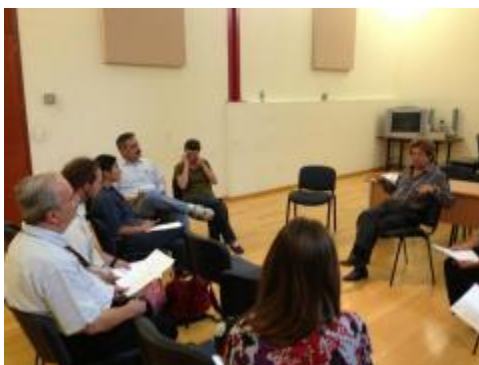
Reunión de trabajo para la conformación del UCOL-CA-Arte y Sociedad del IUBA.