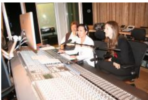
Grabación del Idilio Mexicano.