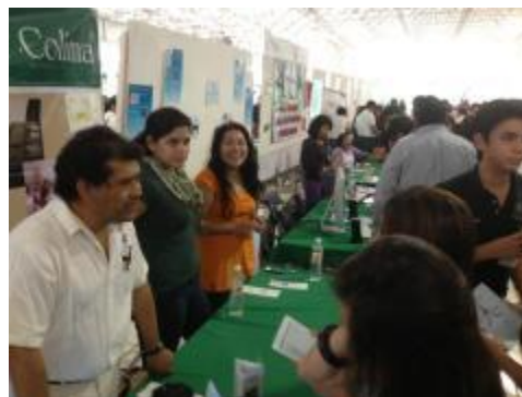
Estudiantes y profesores del IUBA haciendo promoción de las carreras que se ofrecen.