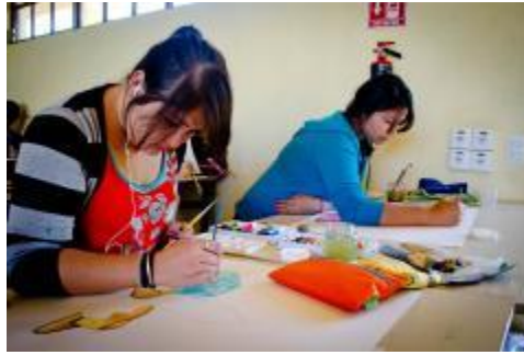
Estudiantes de la Licenciatura en Artes Visuales.