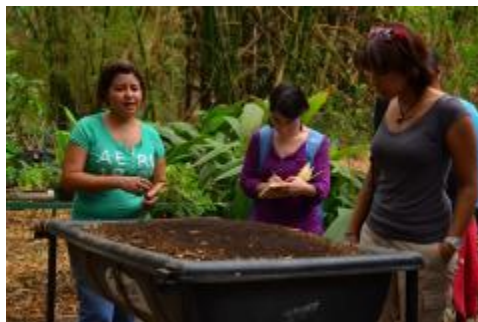
Asistencia de los alumnos al Taller de elaboración de composta imparido en el CEUGEA.