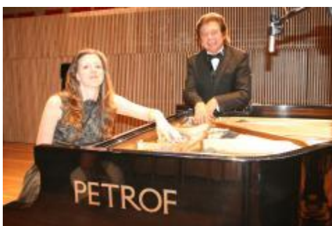
Grabación de un producto académico denominado Idilio Mexicano.