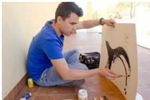
Estudiante de la Licenciatura de Artes Visuales.