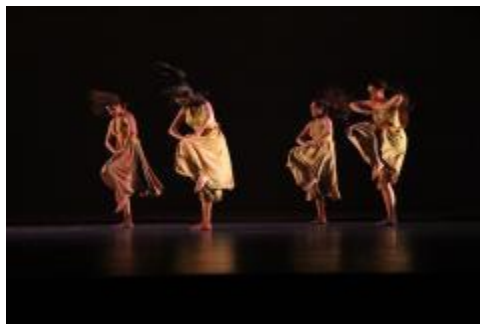
Estudiantes de la Licenciatura en Danza Escénica.