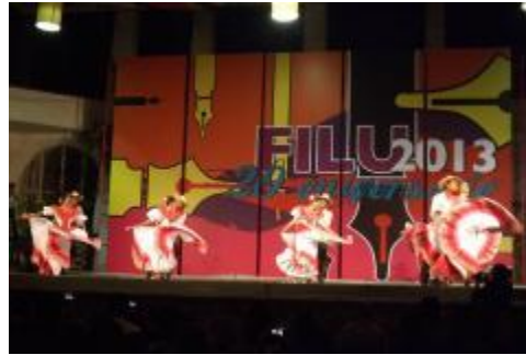
Viaje de estudios de los estudiantes de la Licenciatura en Danza Escénica a la ciudad de Xalapa, Veracruz.