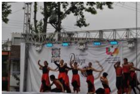
Viaje de estudios de los estudiantes de la Licenciatura en Danza Escénica a la ciudad de Xalapa, Veracruz.