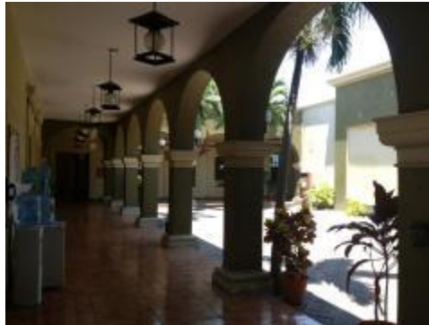
Instalaciones físicas del Departamento de Danza.