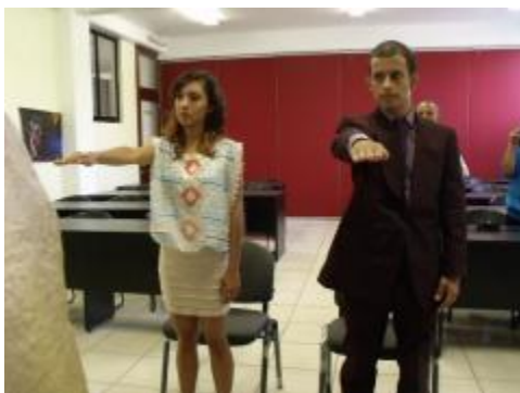
Titulación de estudiantes del PE de Lic. en Danza Escénica.