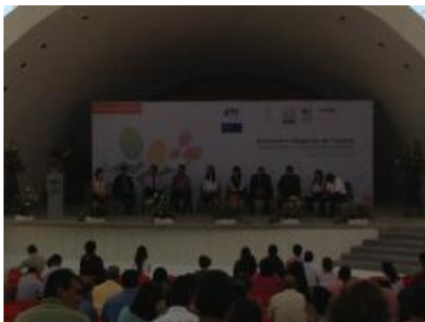
Asistencia al Encuentro Regional de Tutoría en Irapuato, Gto.