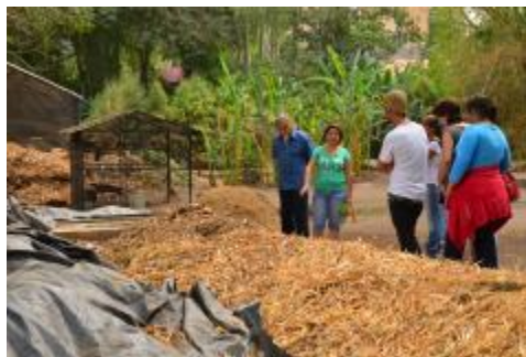
Asistencia de los alumnos al Taller de elaboración de composta imparido en el CEUGEA.