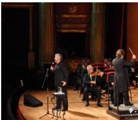
Concierto en Teatro Degollado en Guadalajara, Jalisco.