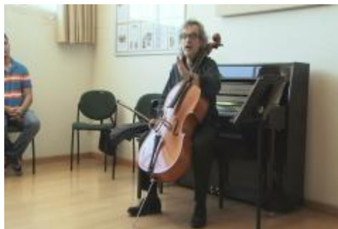
Academia Internacional de Música 2013.