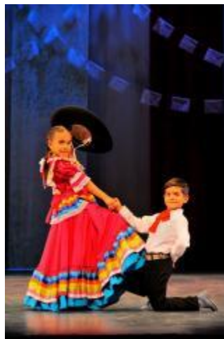
Ballet Folklórico Infantil del Departamento de Danza del IUBA.