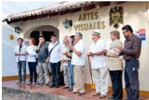
Inauguración de la XII Semana de las Artes Visuales.