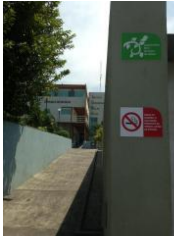
Instalaciones físicas libres de humo de tabaco.