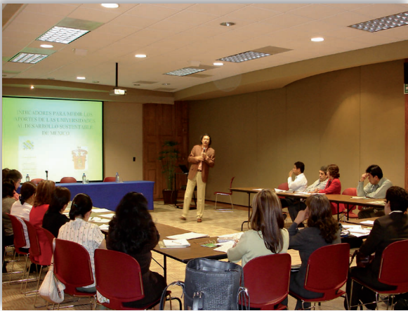
Taller para la adaptación e implementación de los Indicadores (2006), Universidad Autónoma de Coahuila.

Complexus , del latín, es el participio pasado del verbo complexi , que significa “abarcar”. Refleja el espíritu de este Consorcio, desde los puntos de vista educativo, ambiental y organizacional.