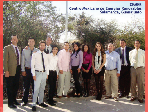
CEMER Centro Mexicano de Energías Renovables Salamanca, Guanajuato