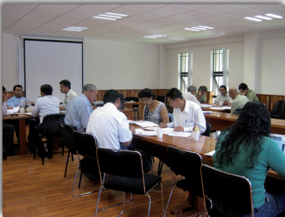
Taller para la adaptación e implementación de los Indicadores (2010), Universidad Autónoma Chapingo.