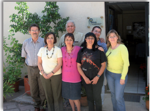
Reunión del Equipo de Trabajo del COMPLEXUS (2007), Universidad de Guanajuato.