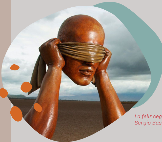
La feliz ceguera. Sergio Bustamante

Aprecia los conceptos y tipos de discapacidad, la trascendencia de Valentin Haüy y Louis Braille, la historia de los espejuelos de aumento a partir del Lente de Nimrud hasta la actualidad pasando por los monóculos, lentes de contacto y de sol hasta la valoración de la vida y obra de artistas con discapacidad sensorial visual.