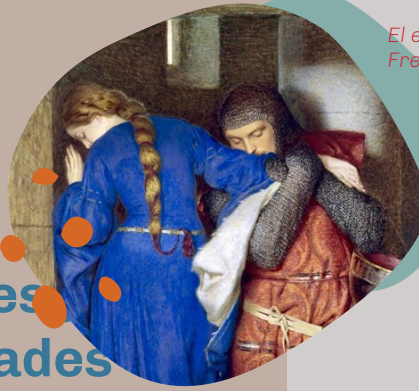
El encuentro en la torre Frederic William Burton