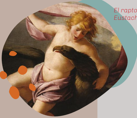
El rapto de Ganímedes. Eustache Le Sueur