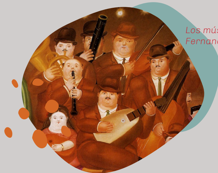
Los músicos. Fernando Botero

En Florencia, Italia, vio la luz uno de los géneros artísticos más importantes a nivel mundial: la ópera. Aprecia su historia, desarrollo y situación actual a través de la música, danza, libreto, decoración, vestuario y escenografía.