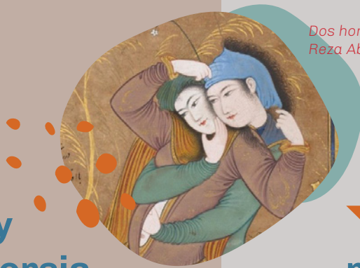
Dos hombres amantes. Reza Abbasi