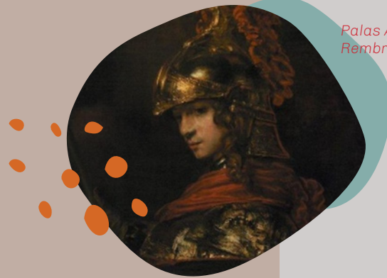
Palas Atenea. Rembrandt Harmenszoon van Rijn