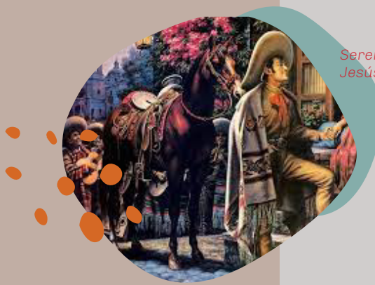
Serenata. Jesús de la Helguera