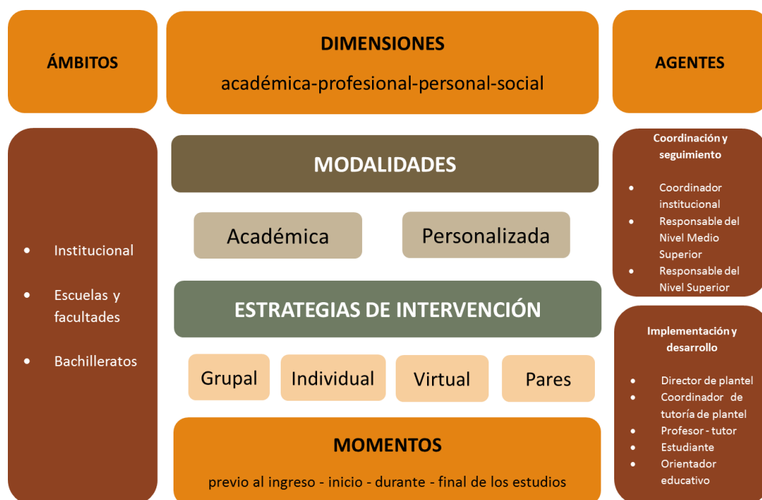
Esquema 2 Componentes del Programa Institucional de Tutoría de la Universidad de Colima.

El Programa Institucional de Tutoría se ha estructurado con los componentes: ámbitos, momentos, dimensiones, modalidades, estrategias de intervención y agentes, que interactúan como parte de un todo ( Ver esquema 2 ); se caracteriza por considerar las necesidades de los estudiantes y de la institución; por concebir multi e interdisciplinaria la acción tutorial; la mejora en el proceso de acompañamiento; propiciar el desarrollo integral del alumnado; facilitar la adquisición y el desarrollo de competencias personales y profesionales para la construcción del proyecto de vida; formación y actualización del profesorado.