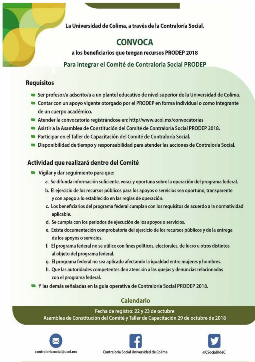
Imagen 2.- Convocatoria para integrar el Comité de Contraloría Social PRODEP 2018