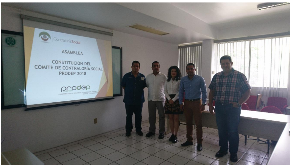
Imagen 3.- Integrantes del Comité de Contraloría Social PRODEP 2018