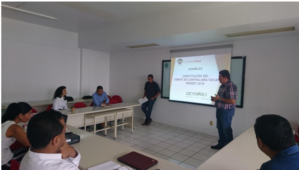
Imagen 4.- Reunión de trabajo con el Comité de Contraloría Social PRODEP 2018

De acuerdo a las reuniones establecidas para la conformación del comité y su posterior capacitación, por otra parte, se realizaron reuniones continuas e informativas con los beneficiarios del programa e integrantes del comité.