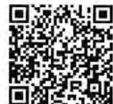
SELLO DE LA ESCUELA