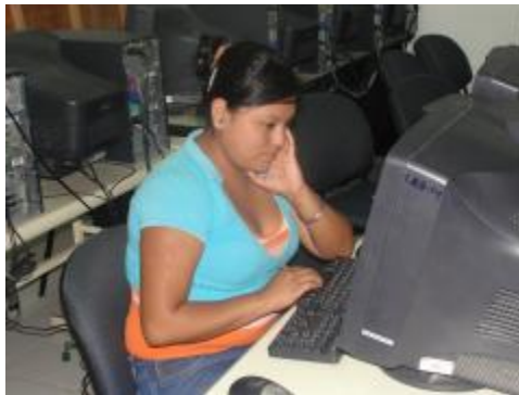
En el módulo de informática los alumnos realizan tareas, investigaciones y trabajos para reforzar su aprendizaje