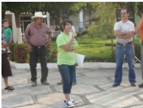
Participación de los alumnos del Bachillerato en las campañas de descacharrización