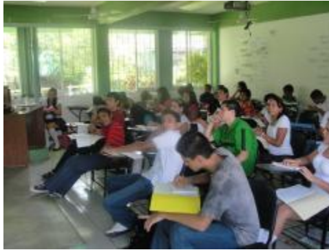
Curso de inducción a la Universidad de Colima