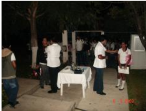
Filtro para la detección de infecciones