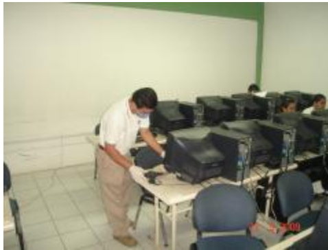
A través de la limpieza evitar la contaminación de alguna infección