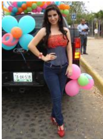
Certamen de reyna del bachillerato