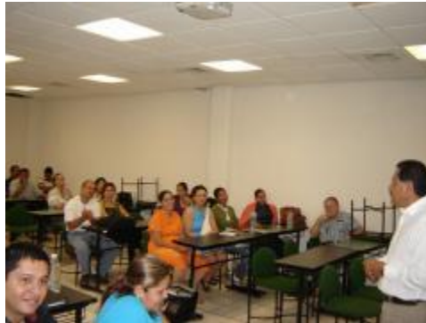
Cursos al personal docentes y administrativo