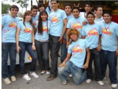
Certamen de reyna del bachillerato