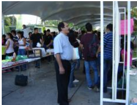
Exposición área ciencias sociales