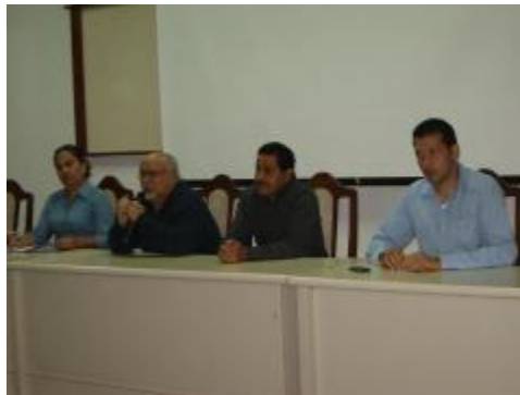
Visita del Rector al bachillerato