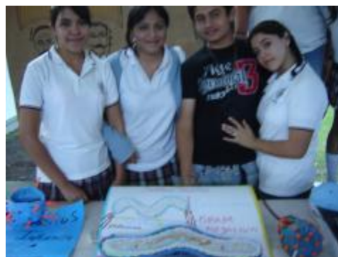
Evento académico de historia