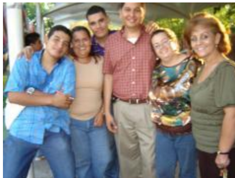
Convivencia Día de Estudiante