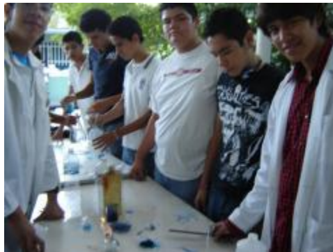
Exposición de trabajos de química