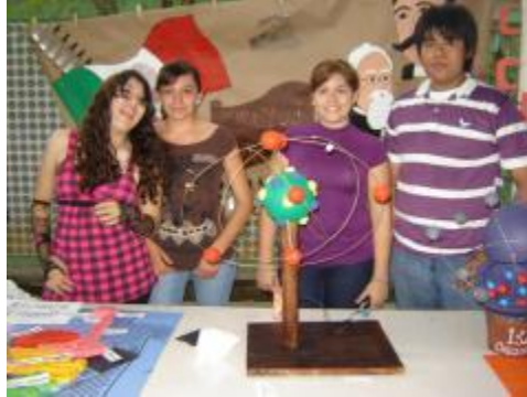
Exposición de trabajos de química