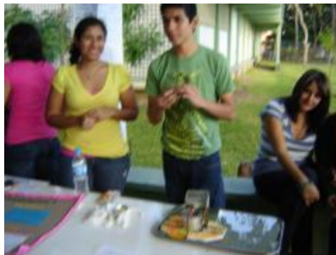
Exposición de desarrollo humano