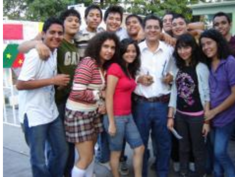
Exposición área ciencias sociales