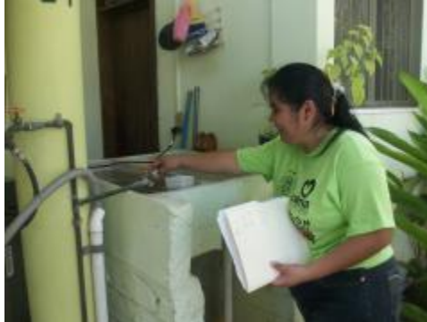
Alumnos del bachillerato 7 colocan abate en las casas