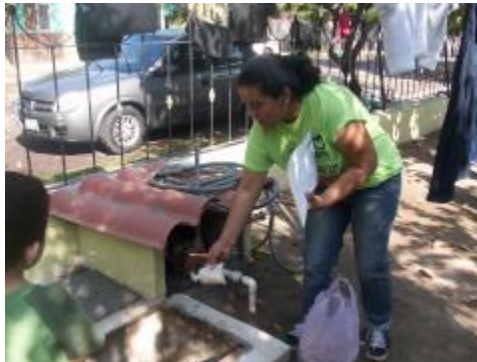
Alumnos bachillerato 7 en campaña contra el dengue Armería