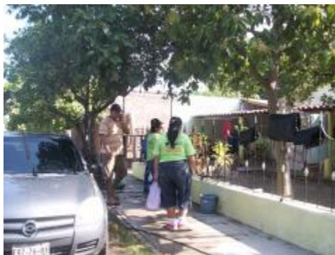
Alumnos bachillerato 7 en campaña contra el dengue Armería