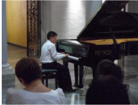
Concierto de un estudiante del área de piano.