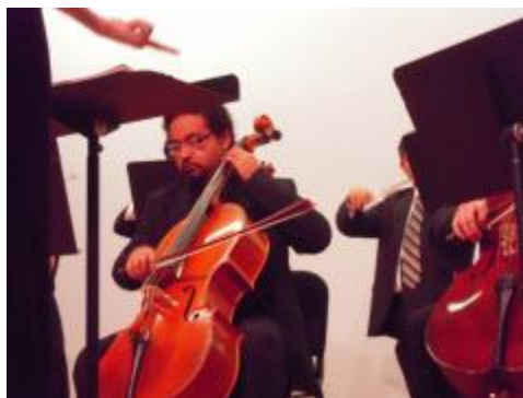
Concierto del área de cuerdas.