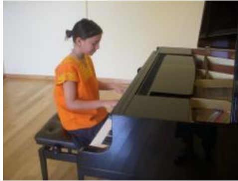
Estudiante del PE de Técnico en Artes Especialidad en Música en clase de piano.