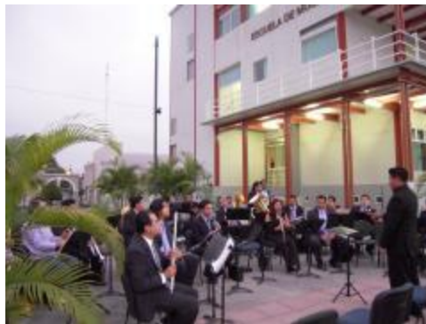
Concierto en donde participan estudiantes y profesores del PE de Técnico en Artes, Especialidad en Música.