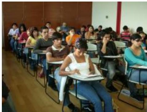
Estudiantes del 3° semestre del PE de Técnico en Artes, Especialidad en Música en una clase teórica.