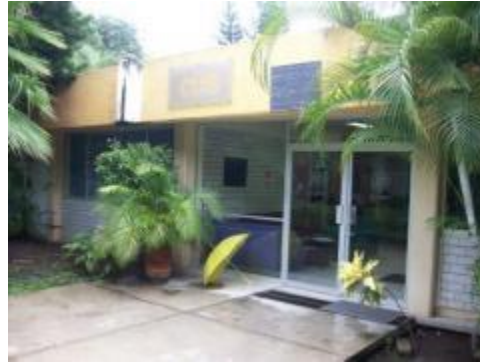
Entrada al CUIS.