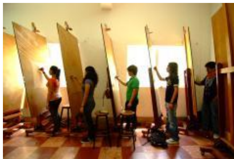
Estudiantes del PE de Lic. en Artes Visuales se encuentra haciendo una práctica de su disciplina.