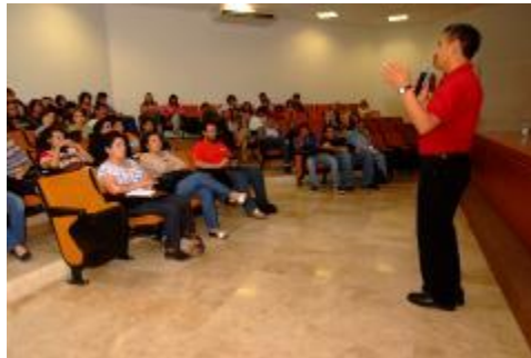
Como parte de la formación integral de los estudiantes se desarrollaron charlas con diversas temáticas, tanto disciplinares como académicas.