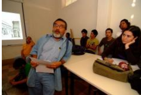
Los estudiantes en clase.