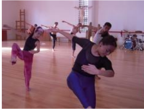
Estudiantes del PE de Lic. en Danza Escénica en clase.