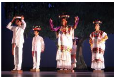
Muestras escénicas producto del trabajo de los estudiantes del PE de la Lic. en Danza Escénica.