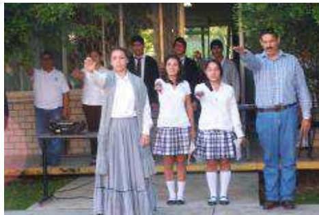
CEREMONIA DEL 15 DE SEPTIEMBRE