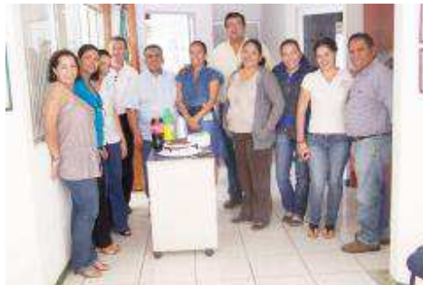
FESTEJO DE COMPAÑEROS