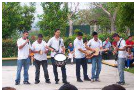
FESTIVAL DE SUMMER FEST