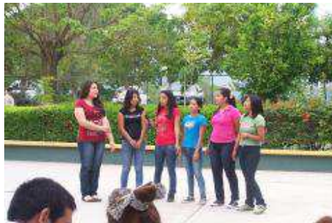
FESTIVAL DE SUMMER FEST