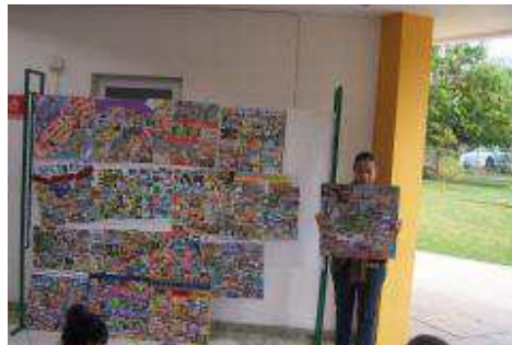
EXPOSICIÓN DE TRABAJOS DE LA MATERIA ESTRUCTURA SOCIOECONÓMICAS