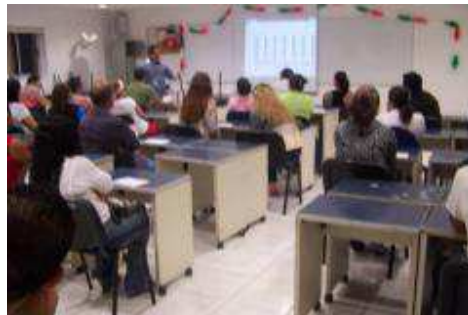
JUNTA DE PADRES DE FAMILIA, PRIMERA PARCIAL