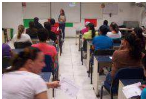
JUNTA DE PADRES DE FAMILIA, PRIMERA PARCIAL