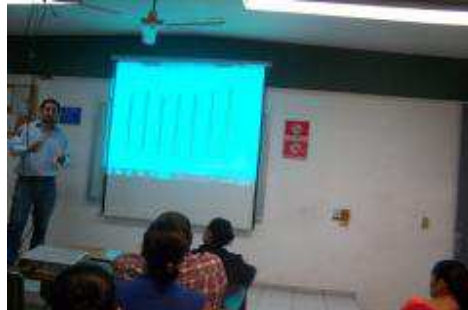
JUNTA DE PADRES DE FAMILIA, PARA VER RESULTADOS DE LA PRIMERA PARCIAL