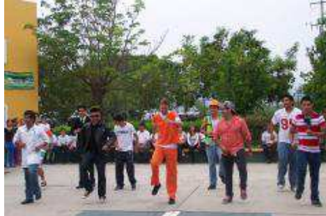
FESTIVAL DEL SUMMER FEST