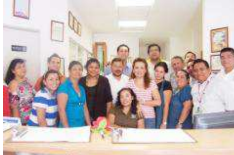
FESTEJO DE CUMPLEAÑOS