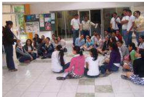
EXPOSICIÓN DE TRABAJOS DEL SECTOR PRODUCTIVO