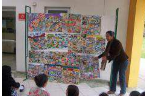
EXPOSICIÓN DE TRABAJOS, DEL SECTOR PRODUCTIVO