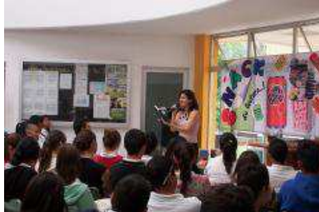
CAFE LITERARIO, LECTURA GRUPAL