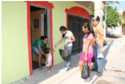
RECOLECCIÓN DE VÍVERES PARA INTEGRAR DESPENSAS PARA ADULTOS MAYORES DEL MUNICIPIO DE IXTLAHUACÁN.