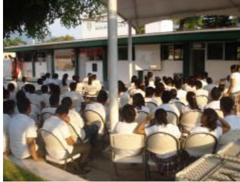
CLUB DE CINE AMBIENTAL POR LA FEDERACIÓN DE ESTUDIANTES COLIMENSES.