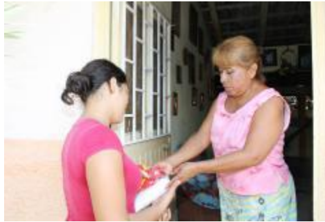
RECOLECCIÓN DE VÍVERES PARA INTEGRAR DESPENSAS PARA ADULTOS MAYORES DEL MUNICIPIO DE IXTLAHUACÁN.