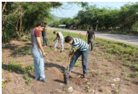
REFORESTACIÓN EN CARRETERAS DEL MUNICIPIO DE IXTLAHUACÁN.