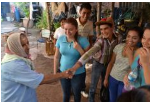
ENTREGA DE DESPENSAS A ADULTOS MAYORES DEL MUNICIPIO DE IXTLAHUACÁN.