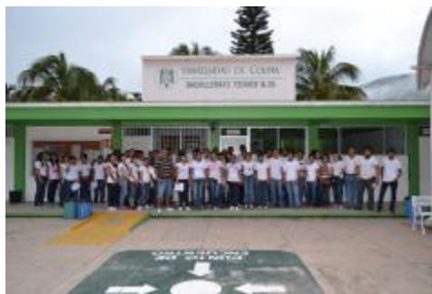
PARTICIPACIÓN EN EL PROGRAMA DE DESCACHARRIZACIÓN 2013.