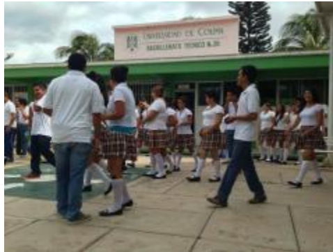
SIMULACRO DE SISMO