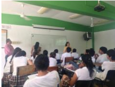
ELECCIÓN DE CONCEJALES TÉCNICOS