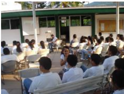
CLUB DE CINE AMBIENTAL POR LA FEDERACIÓN DE ESTUDIANTES COLIMENSES.