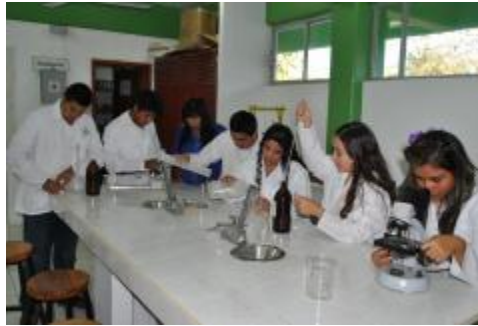
PRÁCTICAS DE LABORATORIO