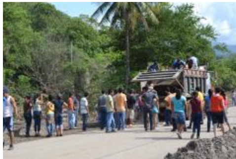
VOLUNTARIOS EN APOYO A LOS DAMNIFICADOS DE LAS CONCHAS DEL MUNICIPIO DE IXTLAHUCÁN