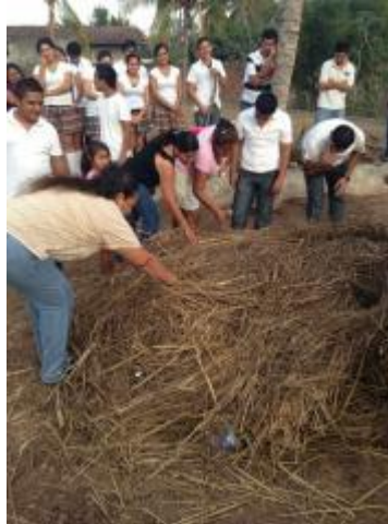
ELABORACIÓN DE COMPOSTAS