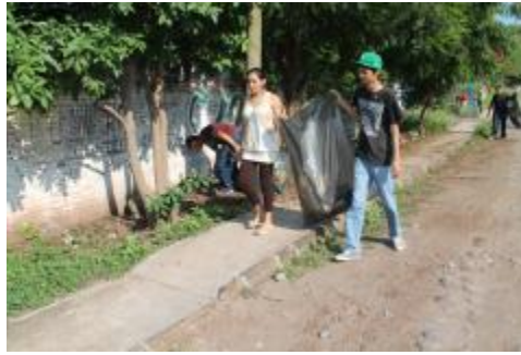
RECOLECCIÓN DE ENVASES DE PLÁSTICO PARA ENVIARLOS A CENTROS DE ACOPIO.