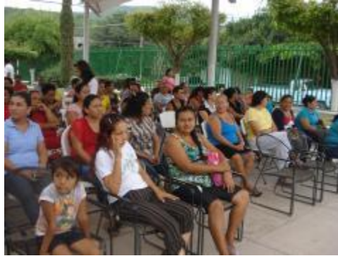
REUNIONES CON PADRES DE FAMILIA