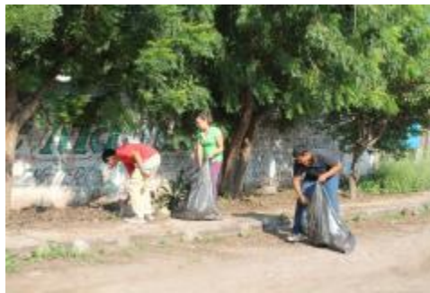
RECOLECCIÓN DE ENVASES DE PLÁSTICO PARA ENVIARLOS A CENTROS DE ACOPIO.