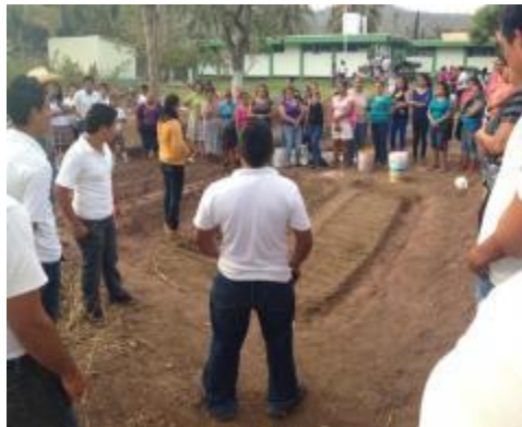
HUERTOS FAMILIARES REALIZADOS POR LOS ESTUDIANTES.