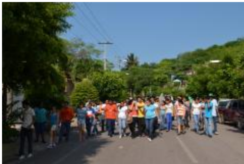
ESTUDIANTES VOLUNTARIOS EN ACCIÓN