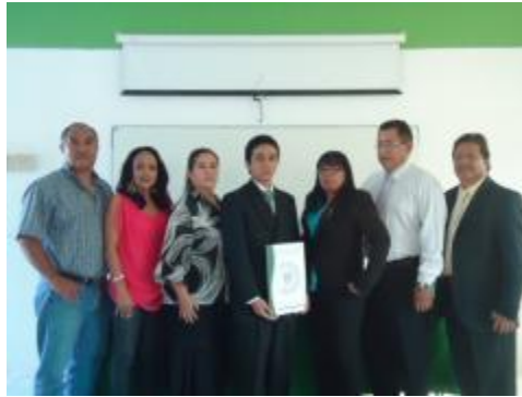
ALUMNOS TITULADO "TÉCNICO EN CONTABILIDAD"