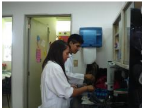
PARTICIPACIÓN DE ESTUDIANTES EN ESTANCIAS DE INVESTIGACIÓN CON PROFESORES DE LA FCBA Y FMVZ DE LA UNIVERSIDAD DE COLIMA.