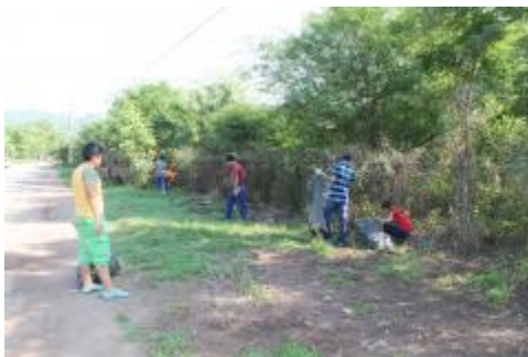
LIMPIEZA DE CALLES DEL MUNICIPIO DE IXTLAHUACÁN.