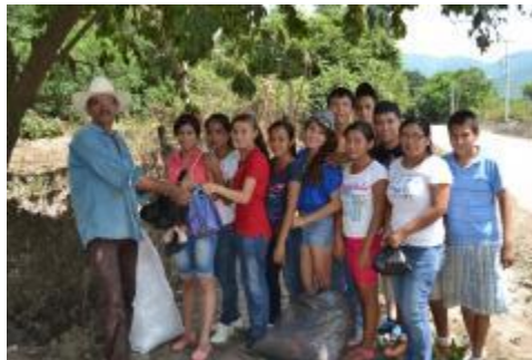
ENTREGA DE DESPENSAS A DAMNIFICADOS DE LAS CONCHAS DEL MUNICIPIO DE IXTLAHUCÁN