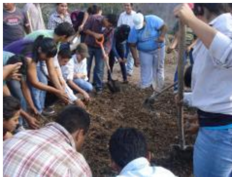
ELABORACIÓN DE COMPOSTAS