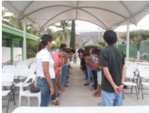
CHARLA COMUNICACION DE PADRES A HIJOS