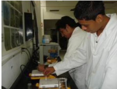
PARTICIPACIÓN DE ESTUDIANTES EN ESTANCIAS DE INVESTIGACIÓN CON PROFESORES DE LA FCBA Y FMVZ DE LA UNIVERSIDAD DE COLIMA.