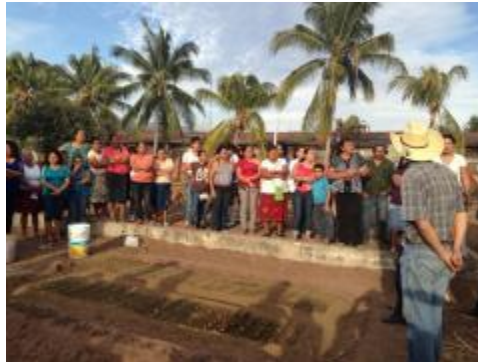
HUERTOS FAMILIARES REALIZADOS POR LOS ESTUDIANTES.