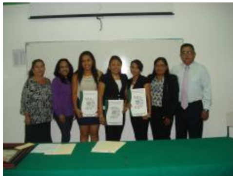
ALUMNOS TITULADOS "TÉCNICOS EN CONTABILIDAD"