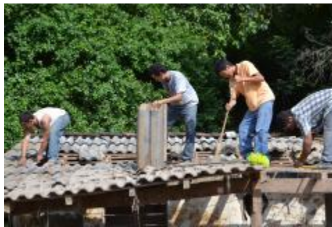
LIMPIEZA DE HOGARES DE DAMNIFICADOS EN LA COMUNIDAD DE LAS CONCHAS DEL MUNICIPIO DE IXTLAHUCÁN