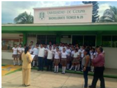
ELECCIÓN DE CONSEJALES TÉCNICOS