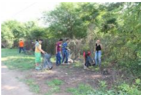
LIMPIEZA DE CALLES DEL MUNICIPIO DE IXTLAHUACÁN.