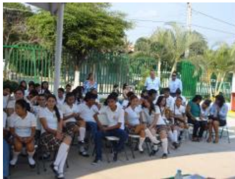
JORNADAS ESCOLARES "COLIMA UN ESTADO DE PARTICIPACIÓN CIUDADANA PARA LA PREVENCIÓN DEL DELITO."