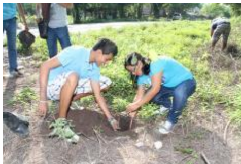
REFORESTACIÓN EN CARRETERAS DEL MUNICIPIO DE IXTLAHUACÁN.