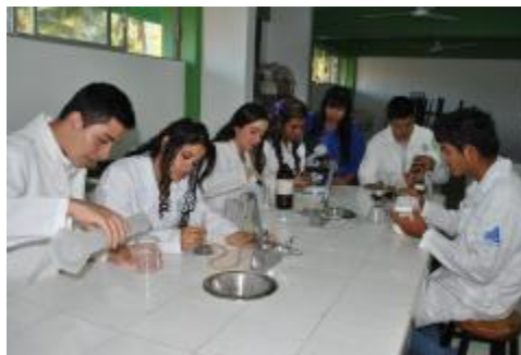
PRÁCTICAS DE LABORATORIO