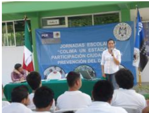
JORNADAS ESCOLARES "COLIMA UN ESTADO DE PARTICIPACIÓN CIUDADANA PARA LA PREVENCIÓN DEL DELITO."