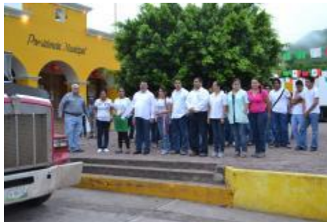
PARTICIPACIÓN EN EL PROGRAMA DE DESCACHARRIZACIÓN 2013.