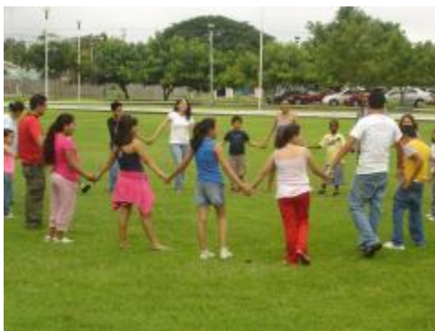
Actividades del Curso de Filosofía

En el marco del Programa de Estudiantes Voluntarios Universitarios (EVUC) y servicio social algunos de nuestros estudiantes el programa de Filosofía para niños, en las que se llevan a cabo sesiones sabatinas de talleres convivenciales de filosofía para niños con participación tanto de alumnos como de maestros. Se realizan entrevistas y encuestas, en cuya elaboración se encuentran trabajando actualmente los participantes en el proyecto.