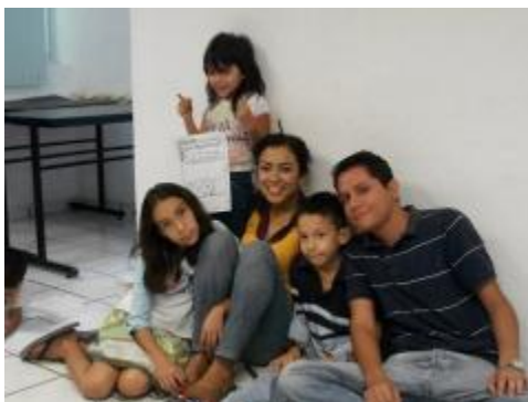
Estudiantes y ni

En el marco del Programa de Estudiantes Voluntarios Universitarios (EVUC) y servicio social algunos de nuestros estudiantes el programa de Filosofía para niños, en las que se llevan a cabo sesiones sabatinas de talleres convivenciales de filosofía para niños con participación tanto de alumnos como de maestros. Se realizan entrevistas y encuestas, en cuya elaboración se encuentran trabajando actualmente los participantes en el proyecto.