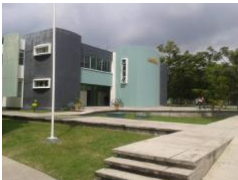
Edificio de la Escuela de Filosofía, ubicado en el campus Villa de Álvarez