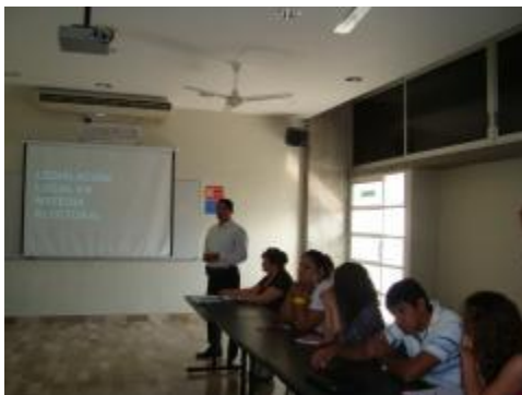
Charla sobre la Legislación local en materia electoral.