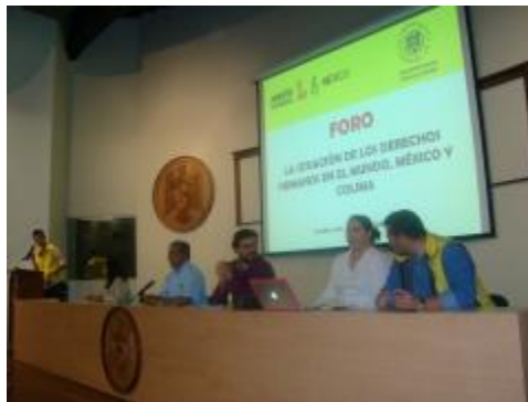
Foro sobre Amnistía Internacional.