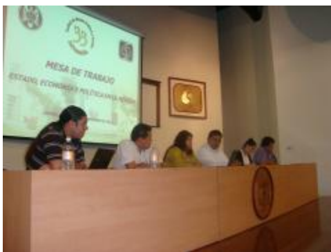
XXXIII Aniversario. Mesa de trabajo "Estado, Economía y Política en la Región."