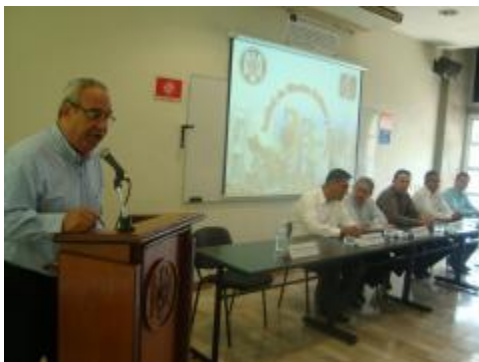
Inauguración del XXXIII Aniversario de la Facultad de Ciencias Políticas y Sociales.