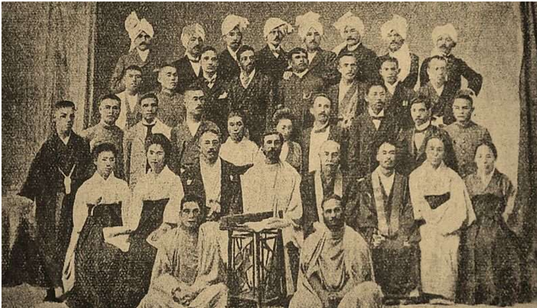
Maha Boddhi Society década de 1890