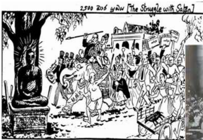
From IKSATHI DIKKU PERAMUNA A 1956 cartoon lampooning the UNF