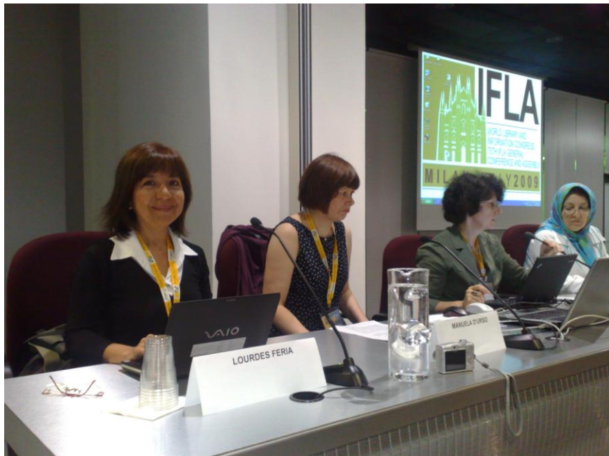
Ponente Congreso Mundial de IFLA en la 76th IFLA General Conference and Assembly