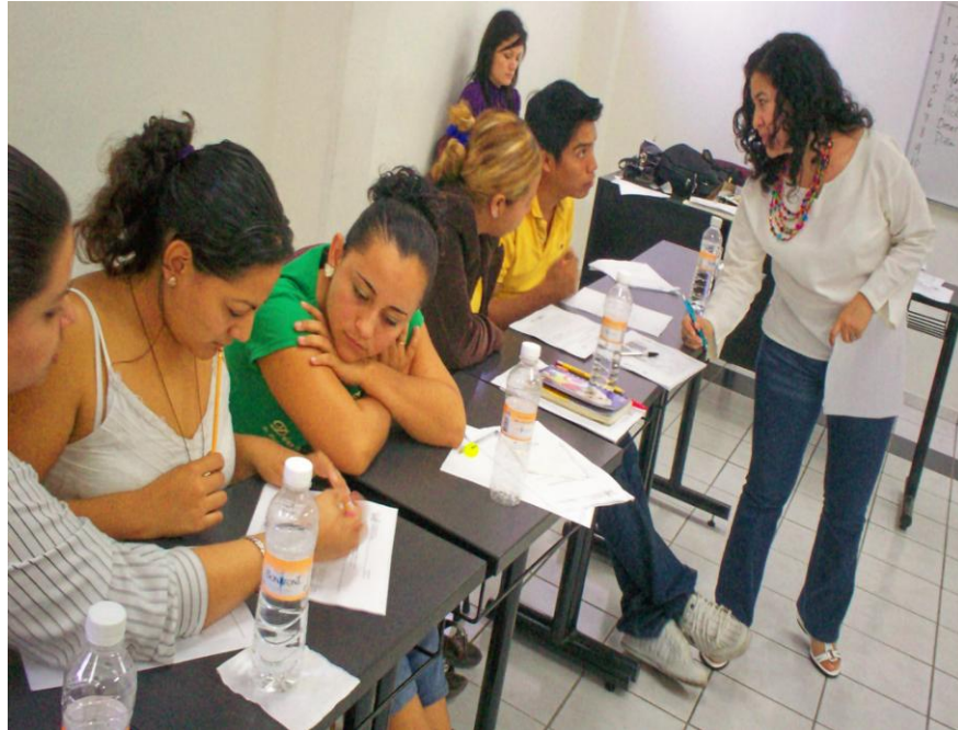
Capacitación de estudiantes voluntarios y promotores de centros comunitarios digitales que participaron en la fase piloto como facilitadores.

Dirección General de Tecnologías para el Conocimiento Informe de Actividades 2009