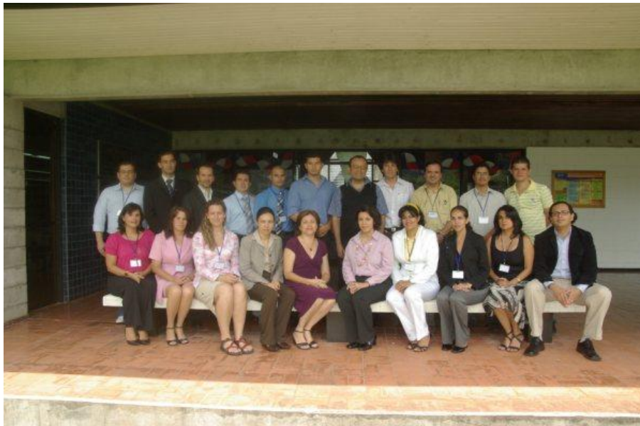
Taller sobre Alfabetización Internacional a través de aplicaciones Web 2.0 enfocada a la Gestión del Conocimiento.

Dirección General de Tecnologías para el Conocimiento Informe de Actividades 2009