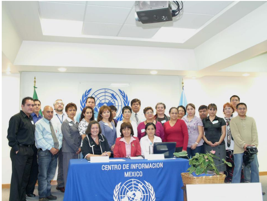
Taller para bibliotecas depositarias sobre “Acceso a Información y Documentación de Naciones Unidas”