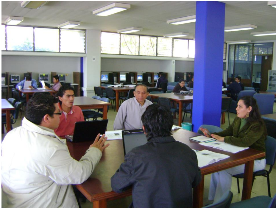
Administración de Bibliotecas