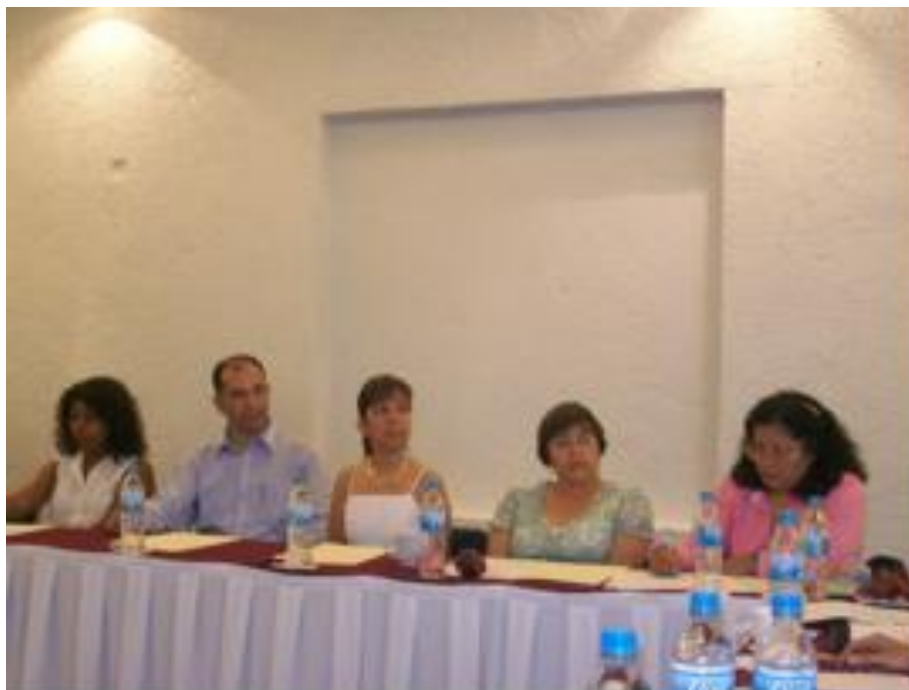
Presentación de la Biblioteca Virtual e-Géneros en foro de especialistas: Red de género de ANUIES Centro Occidente, Manzanillo.