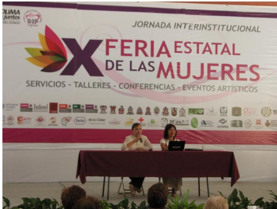
Ponente en la Feria Estatal de la Mujer en Colima

Dirección General de Tecnologías para el Conocimiento Informe de Actividades 2009