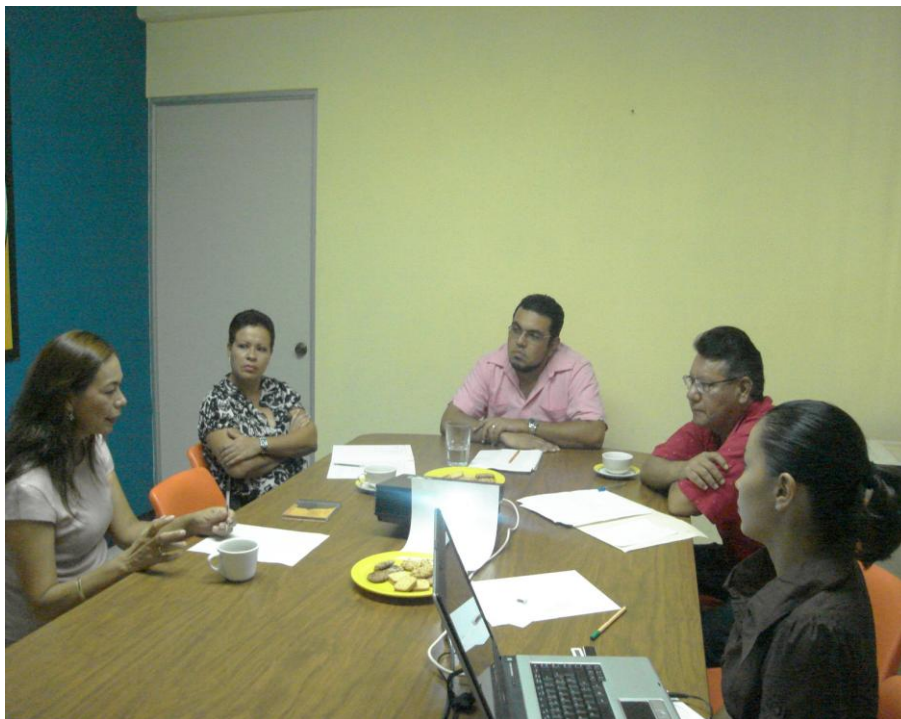
Reunión de los responsables de la Biblioteca Virtual e-Genero