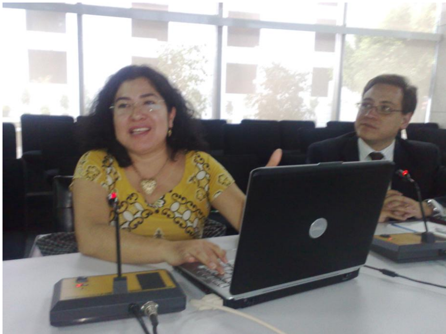
Reunión con el Asesor del Portal Mujeres Migrantes