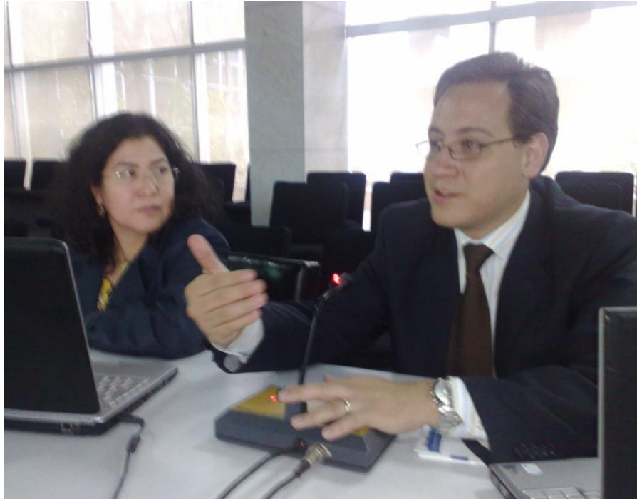
Reunión con el Asesor del Portal Mujeres Migrantes

Dirección General de Tecnologías para el Conocimiento Informe de Actividades 2009