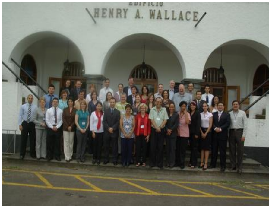
Reunión Internacional de Profesionales de Información Agropecuaria y Forestal SIDALC