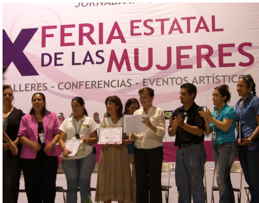
Ponente en la Feria Estatal de la Mujer en Colima