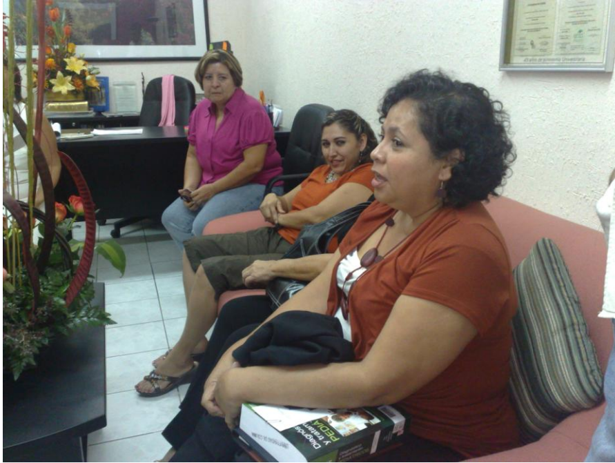
Reunión con colaboradores bibliotecarios

Dirección General de Tecnologías para el Conocimiento Informe de Actividades 2009