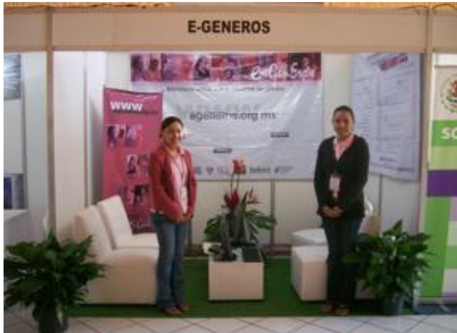
Presencia de la Biblioteca Virtual e-Géneros en la Feria Estatal de la Mujer, Colima.

Dirección General de Tecnologías para el Conocimiento Informe de Actividades 2009