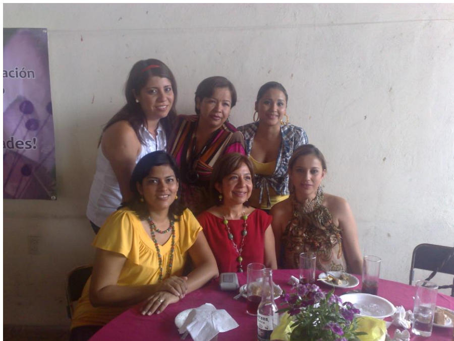
Reunión de Trabajo del Personal de la Biblioteca de Ciencias Agropecuarias