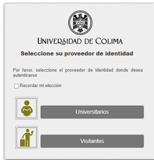
Imagen 1. Proveedor de identidad

Se ingresará al sistema con su número de trabajador o correo electrónico institucional.