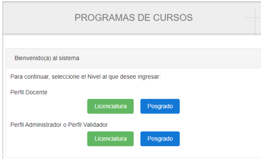
Imagen 2. Pantalla de inicio, selección de perfil