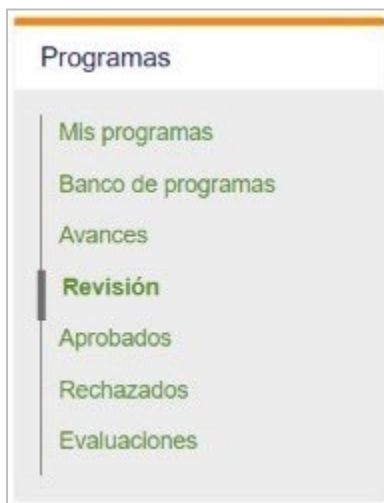
Imagen 4. Menú de opciones "Programas"